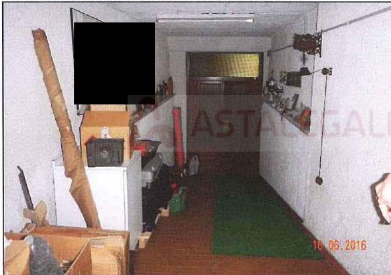
Vista del corridoio d'ingresso