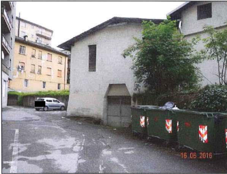
Vista esterna dell'ingresso a nord