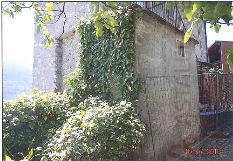
Vista da nord-est