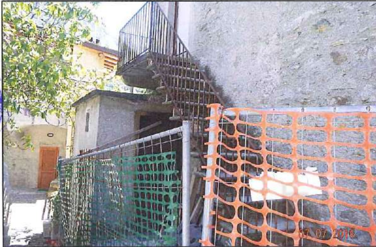
Vista fronte nord