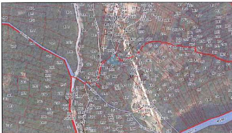
Ortofoto con sovrapposizione mappa catastale