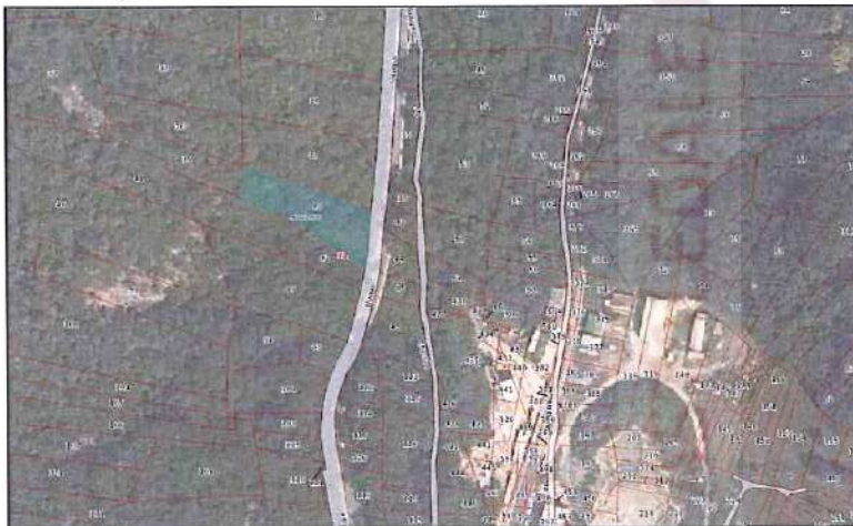
Ortofoto con sovrapposizione mappa catastale