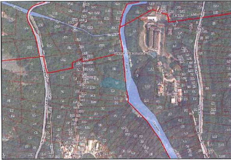
Ortofoto con sovrapposizione mappa catastale