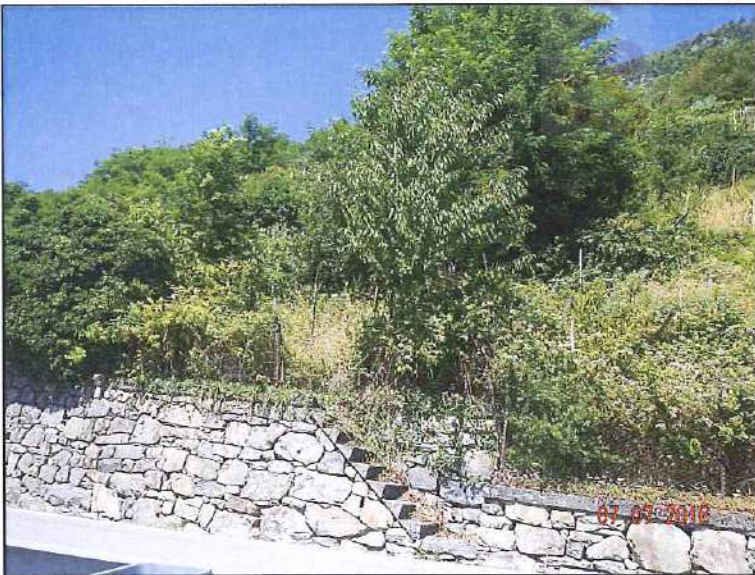
Vista dalla strada a sud