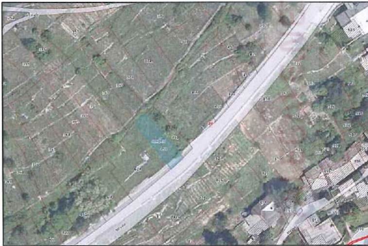
Ortofoto con sovrapposizione mappa catastale