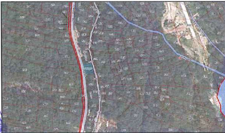
Ortofoto con sovrapposizione mappa catastale