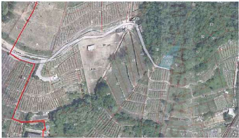
Ortofoto con sovrapposizione mappa catastale