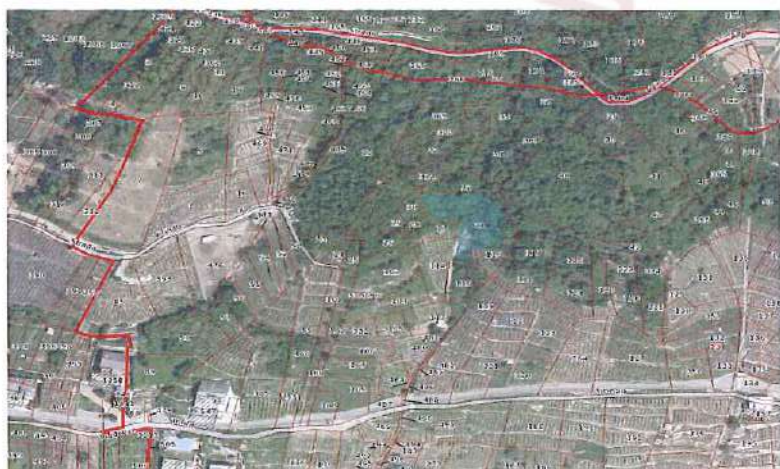
Ortofoto con sovrapposizione mappa catastale