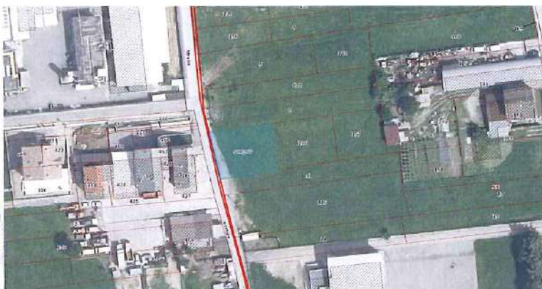
Ortofoto con sovrapposizione mapa catastale