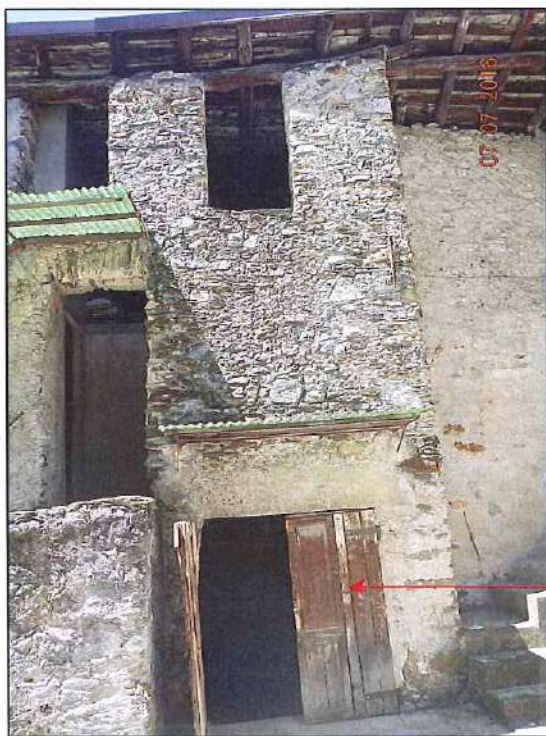
vista dalla corte interna