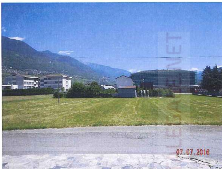
vista da ovest verso est