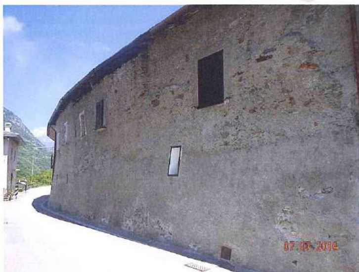
vista dalla strada comunale