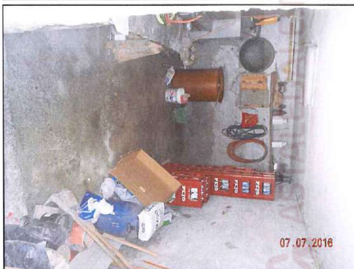
vista interna piano terra