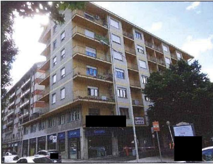
Vista esterna fronte nord- ovest