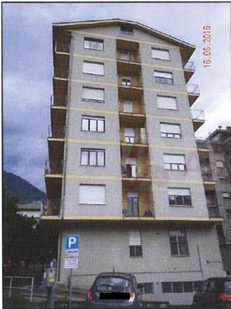
Vista esterna fronte sud