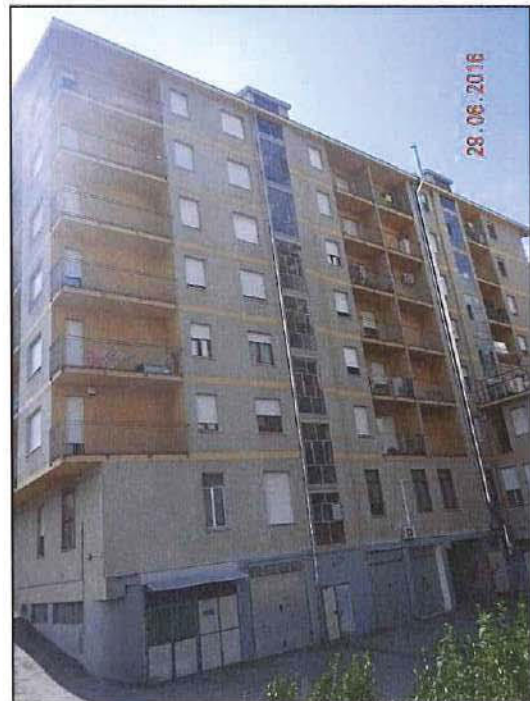
Vista esterna fronte est