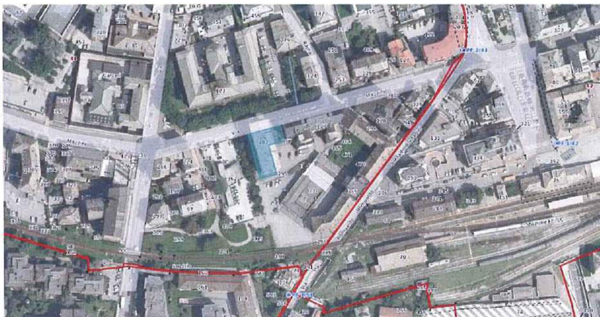
Ortofoto con sovrapposizione mappa catastale