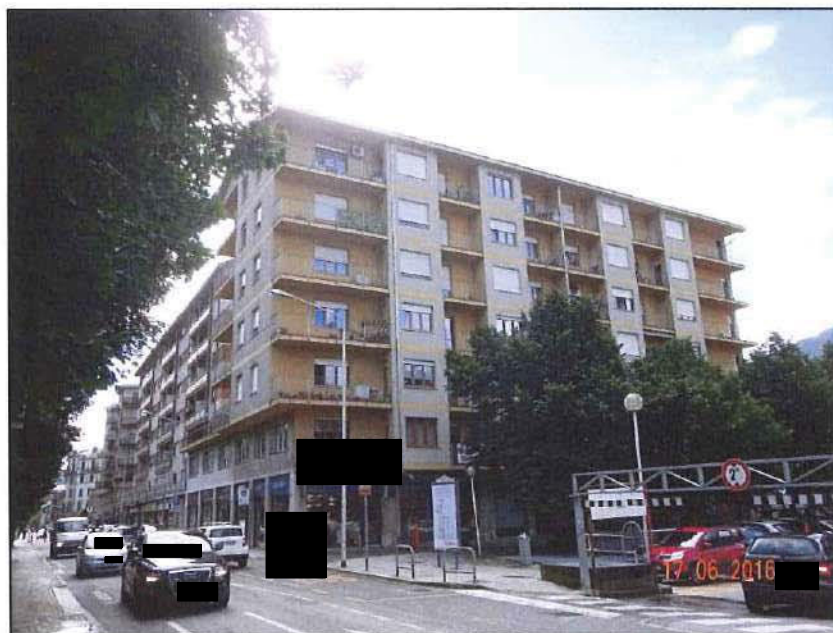
Vista esterna fronte ovest