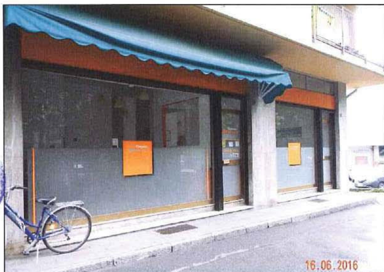
Vista ingresso dall'esterno del sub 15