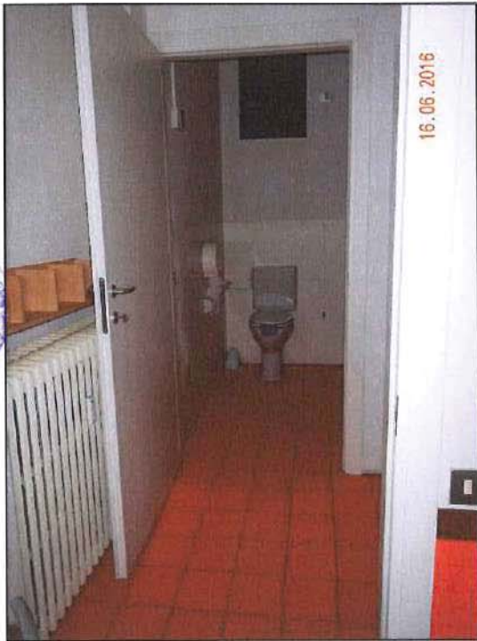
Vista interna w.c. disabili