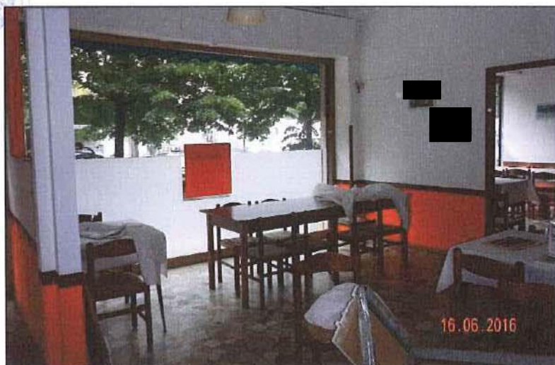
Vista interna sala