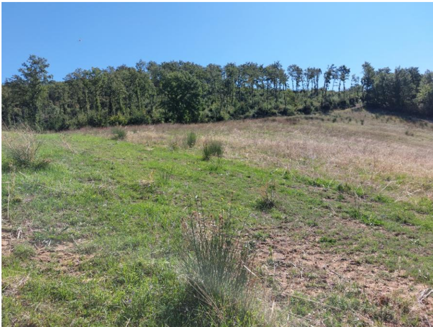
Foto n.92: Veduta delle particelle n.49 destinata a pascolo e n.195 destinata a bosco del foglio 70 (Bene G).