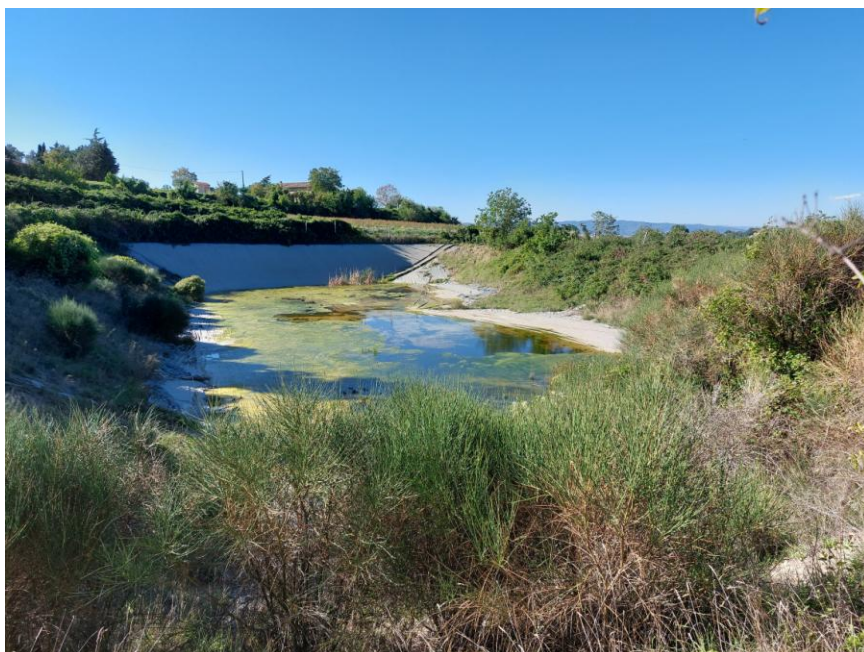
Foto n.87: Particolare della laguna di stoccaggio liquami, ricadente all'interno particelle 111-369-394 del foglio 54 (Bene G). Notare la copertura con membrana in PVC di colore grigio scuro e la recinzione con rete metallica e pali in cemento armato.