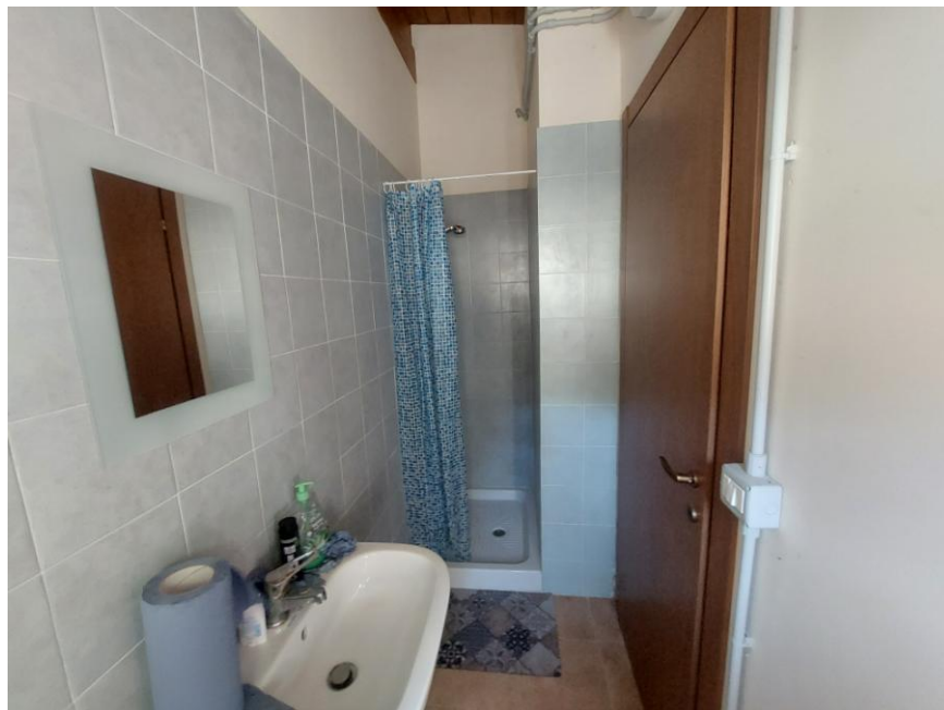
Foto n.80: Particolare del bagnolo (particella n.607, foglio 70 - Bene G). Notare, le pareti parzialmente rivestite con piastrelle di ceramica, il pavimento in monocottura e il piatto doccia.