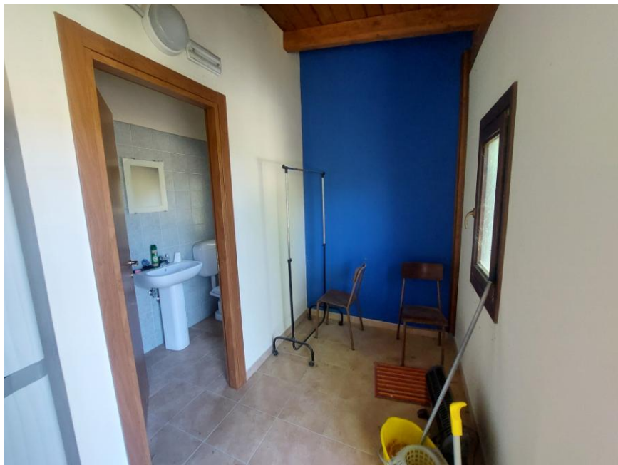
Foto n.78: Particolare interno dello spogliatoio sul prospetto est (particella n.607, foglio 70 - Bene G). Notare le pareti intonacate e tinteggiate e il pavimento con mattonelle in ceramica.