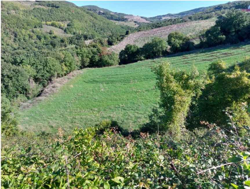
Foto n.91: Veduta della particella n.394 del foglio 54 destinata a seminativo (Bene G).