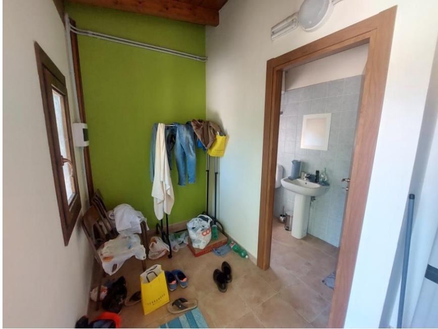
Foto n.79: Altro particolare interno dello spogliatoio sul prospetto ovest (particella n.607, foglio 70 - Bene G). Notare, gli infissi e la finestra in legno e l'impianto elettrico fuoritraccia.