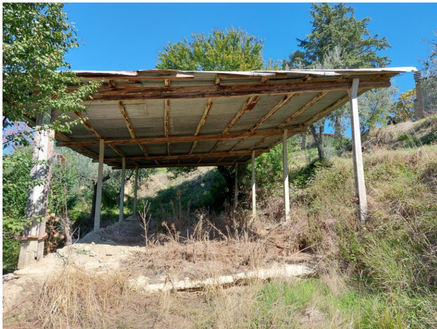
Foto n.84: Particolare della tettoia adibita a fienile (particella n.5, foglio 70 - Bene G). Notare il tetto del tipo ad una falda con copertura in lamiera, la struttura in cemento armato e solai con orditura in legno.