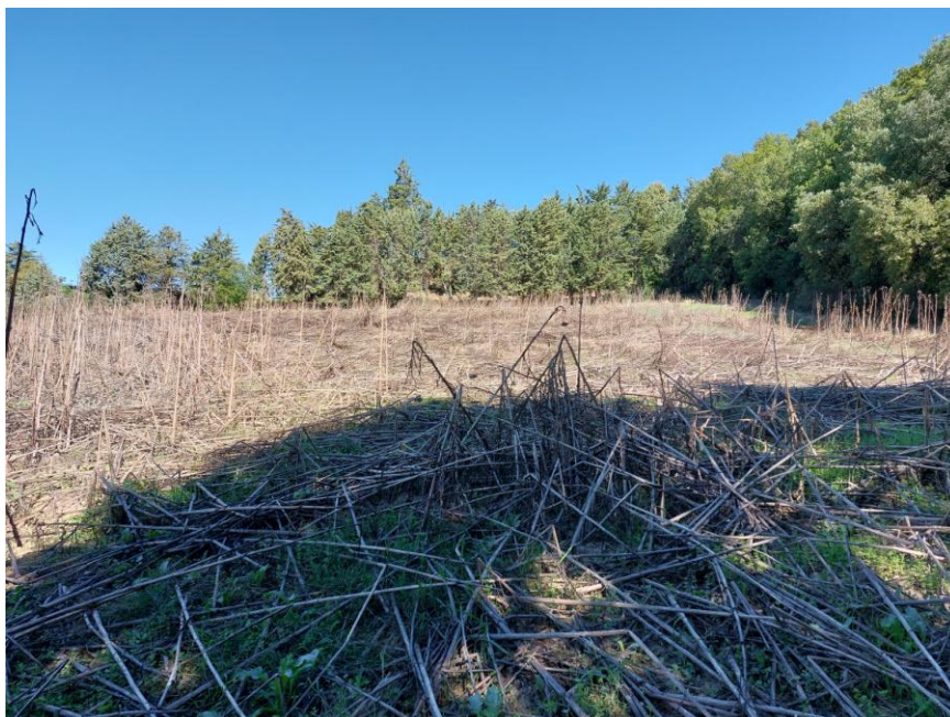
Foto n.88: Veduta delle particelle n.18-606 del foglio 70 destinate a seminativo (Bene G).