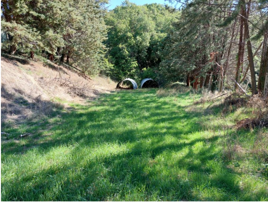
Foto n.89: Particolare della particella n.606 del foglio 70 destinata a seminativo (Bene G).