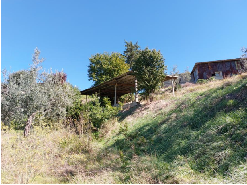
Foto n.83: Veduta della tettoia adibita a fienile, non autorizzata, ricadente all'interno della particella n.5 del foglio 70 (Bene G). È visibile, a sinistra dell'immagine, il fabbricato rurale adibito a stalla, deposito e rimessa (Bene D).