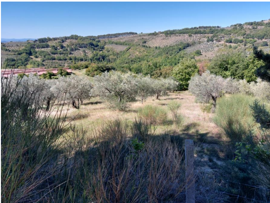
Foto n.90: Veduta delle particelle n.113-121 del foglio 54 destinate ad oliveto (Bene G).