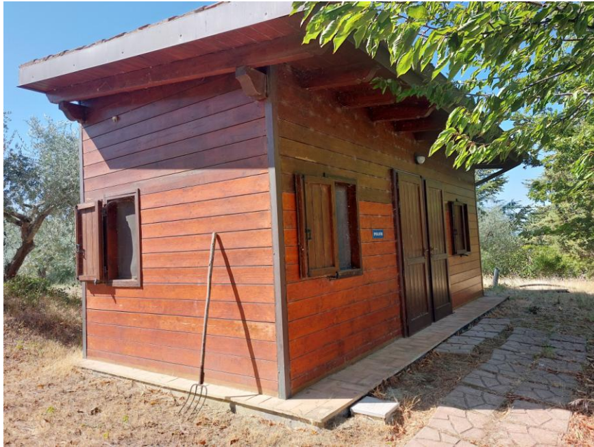
Foto n.77: Particolare del fabbricato adibito a spogliatoio, non autorizzato, ricadente all'interno della particella n.607 del foglio 70 (Bene G). Notare la struttura in legno, il marciapiede lastricato, i canali di gronda e i pluviali discendenti in rame, gli infissi esterni e le finestre in legno con portelloni con doghe alla mercantile.