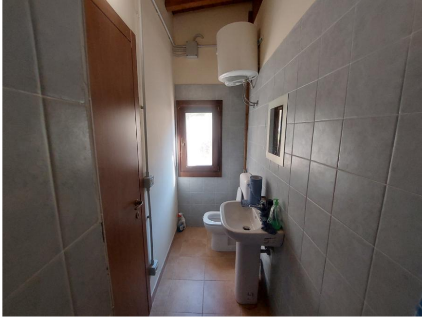
Foto n.81: Altro particolare del bagno (particella n.607, foglio 70 - Bene G) ripreso da angolazione opposta rispetto alla foto precedente. Notare, la dotazione di sanitari, le pareti parzialmente rivestite con piastrelle di ceramica, il pavimento in monocottura e la caldaia per la produzione di acqua calda termo sanitaria