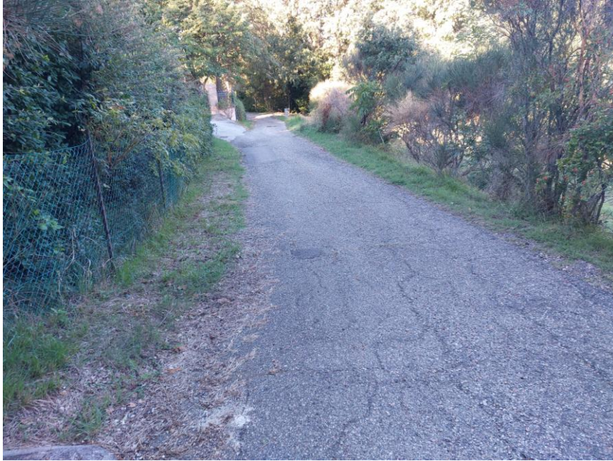
Foto n.85: Particolare della strada asfaltata ricadente all'interno della particella n.185 del foglio 70 (Bene G).