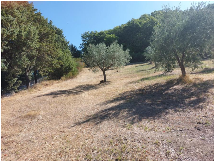
Foto n.82: Particolare della particella n.606 del foglio 70 destinata ad oliveto (Bene G). È visibile sulla sinistra della foto la strada interpodereale.