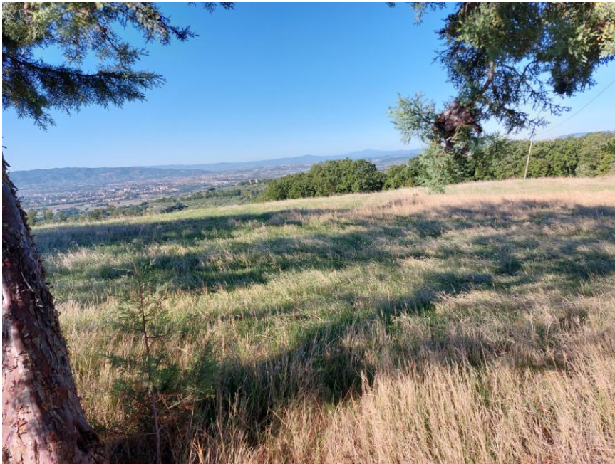
Foto n.86: Veduta delle particelle n.21-148 del foglio 70 destinate a seminativo (Bene G).