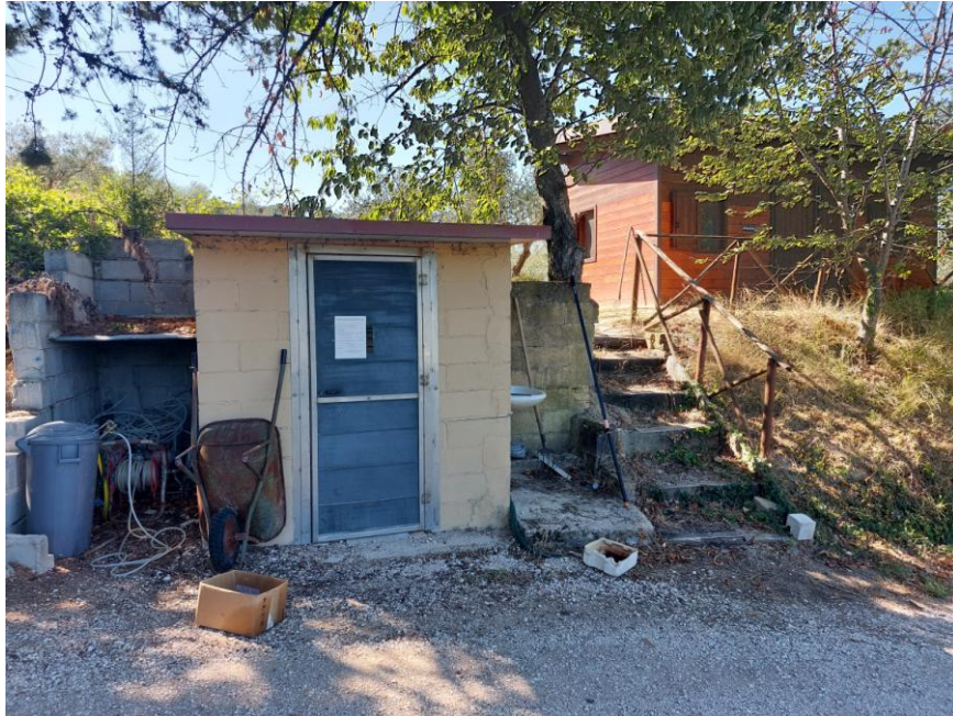
Foto n. 75: Particolare del piccolo fabbricato adibito a locale tecnico, non autorizzato, ricadente all'interno della particella n.608 del foglio 70 (Bene G). Notare in primo piano la porta metallica sul prospetto nord, la struttura portante in blocchi forati di laterizio e il tetto a una falda. È visibile, a destra dell'immagine, il fabbricato adibito a spogliatoio non autorizzato.