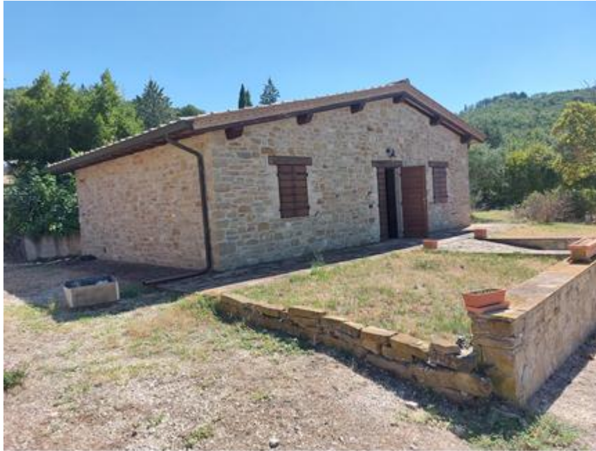
Foto n.51: Altro particolare del fabbricato di civile abitazione (Bene B). Sono visibili i prospetti nord ed ovest. Notare il marciapiede perimetrale lastricato e i canali di gronda e i pluviali discendenti in rame.