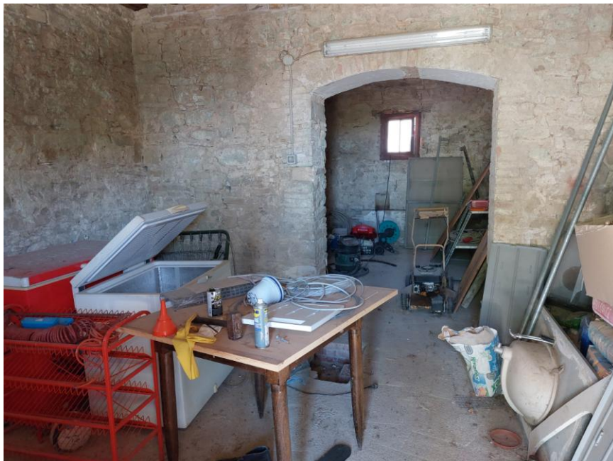
Foto n.41: Particolare interno del fondo al piano terra ripreso da sotto il portico (Bene A). Notare, le pareti in pietra faccia vista, l'impianto elettrico del tipo fuori traccia protetto da canaline per cavi e l'apertura di collegamento che immette alla cantina. È visibile centralmente la finestra con affaccio sul prospetto posteriore est.