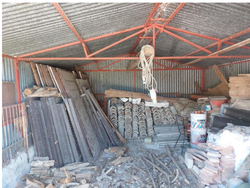
Foto n.54: Particolare interno del piccolo fabbricato adibito a magazzino (Beni B-C). Notare il tetto del tipo a capanna, la struttura in ferro e le tamponature esterne in lamiera.