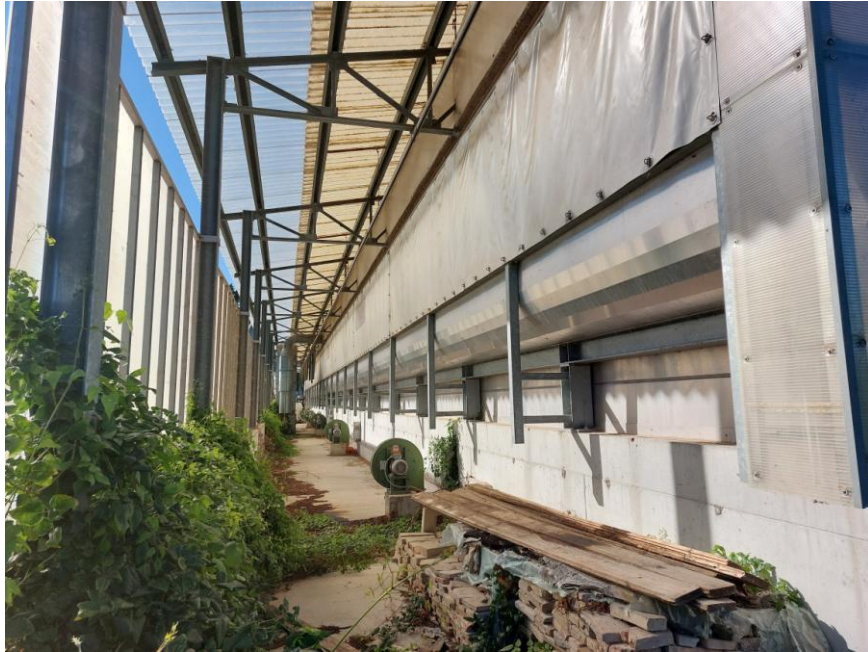
Foto n.31: Particolare interno dell'impianto di compostaggio (Bene E). Notare, il binario per lo scorrimento della macchina semovente sul prospetto laterale est.