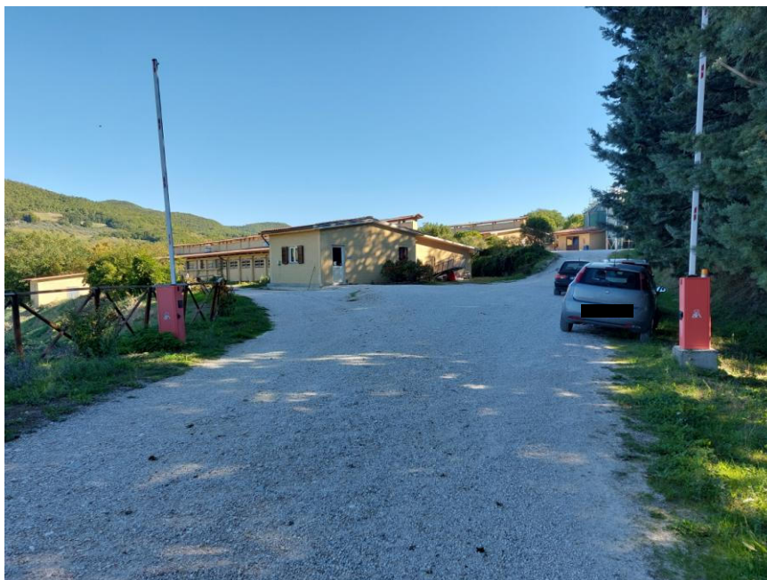
Foto n.3: Particolare dei fabbricati agricoli (Bene F). Sono visibili, a sinistra dell'immagine, il locale tecnico e la stalla n.2, al centro il piccolo fabbricato adibito ad ufficio e a destra dell'immagine, la stalla n.1. Notare, in primo piano, l'accesso carrabile delimitato da doppia sbarra automatica sui due lati e la corte adibita a piazzale di lavoro in ghiaia battuta (NCT foglio 54, particella n.393).