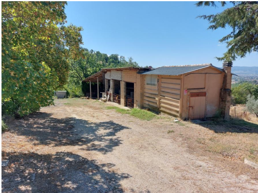
Foto n.66: Particolare del fabbricato rurale adibito a stalla, deposito e rimessa su un unico livello (Bene D). Sono visibili, a destra dell'immagine il prospetto nord del deposito e al centro dell'immagine il prospetto est della rimessa. Notare, la struttura in muratura mista, parte con pannelli di tamponatura prefabbricati in cemento armato e parte con blocchi forati di laterizio ed esternamente non intonacata e tinteggiata.