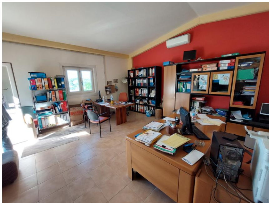
Foto n.6: Particolare interno dell'ufficio (Bene F). Notare il pavimento in monocottura, l'impianto di condizionamento e gli infissi in PVC.