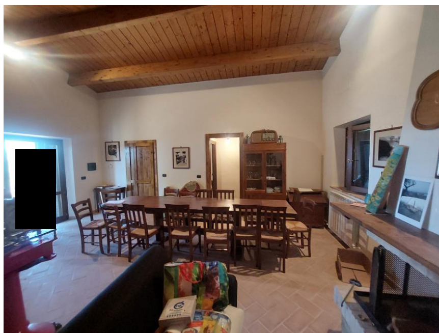
Foto n.56: Altro particolare della cucina/soggiorno (Bene B) ripreso da angolazione opposta rispetto all'immagine precedente. Sono visibili, al centro dell'immagine l'apertura che immette al piccolo disimpegno e a sinistra dell'immagine, l'ingresso sul prospetto principale ovest. Notare le pareti intonacate e tinteggiate, il pavimento realizzato con mattonelle di cotto, gli infissi della finestra in legno e l'impianto elettrico sottotraccia.