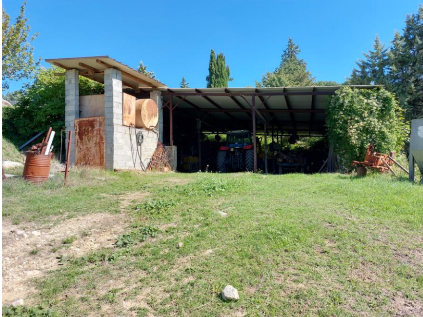
Foto n. 61: Particolare della tettoia adibita a rimessa (Bene C). È visibile sulla sinistra dell'immagine, la porta metallica sul prospetto ovest del ripostiglio non autorizzato. Notare il tetto del tipo a una falda e il manto di copertura in lamiera con orditura in legno.