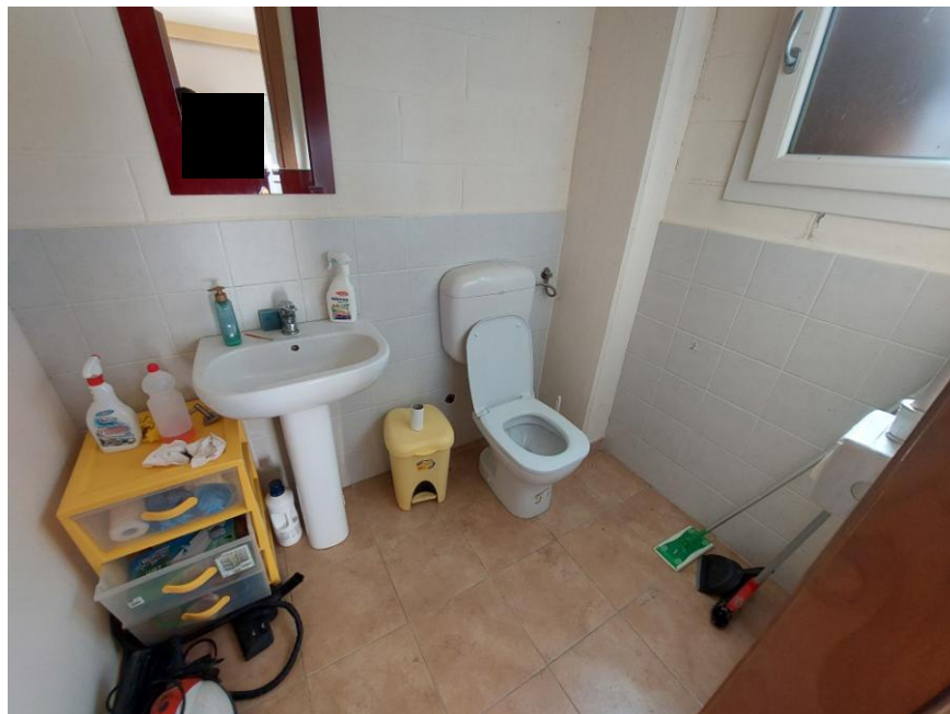
Foto n.8: Particolare del w.c. (Bene F). Notare il pavimento in monocottura, le pareti parzialmente rivestite con piastrelle di ceramica e la dotazione di sanitari.