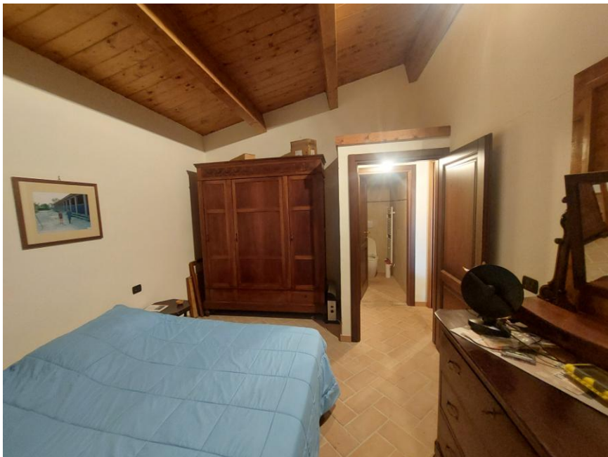
Foto n.58: Altro particolare della camera (Bene B) ripreso da angolazione opposta rispetto all'immagine precedente. Sono visibili al centro dell'immagine, le aperture del piccolo disimpegno e del bagno. Notare le pareti intonacate e tinteggiate e i solai con orditura in legno lamellare.