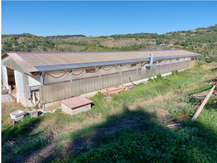
Foto n.29: Veduta dei prospetti sud ed est dell'impianto di compostaggio (Bene E). Notare il tetto del tipo a due falde, il manto di copertura e le tamponature esterne con pannelli in policarbonato. Al centro dell'immagine è visibile il piccolo fabbricato dove sono alloggiate le pompe.