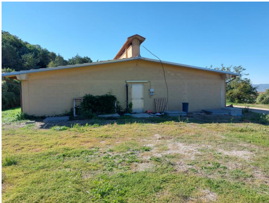
Foto n.13: Particolare del retro prospetto nord della Stalla n.2 (Bene F). È visibile, centralmente l'accesso pedonale delimitato da porta in metallo e il tetto a due falde riunite al colmo con cupolino "a taglio termico". Notare la tamponatura esterna con blocchi di calcestruzzo intonacati e tinteggiati.