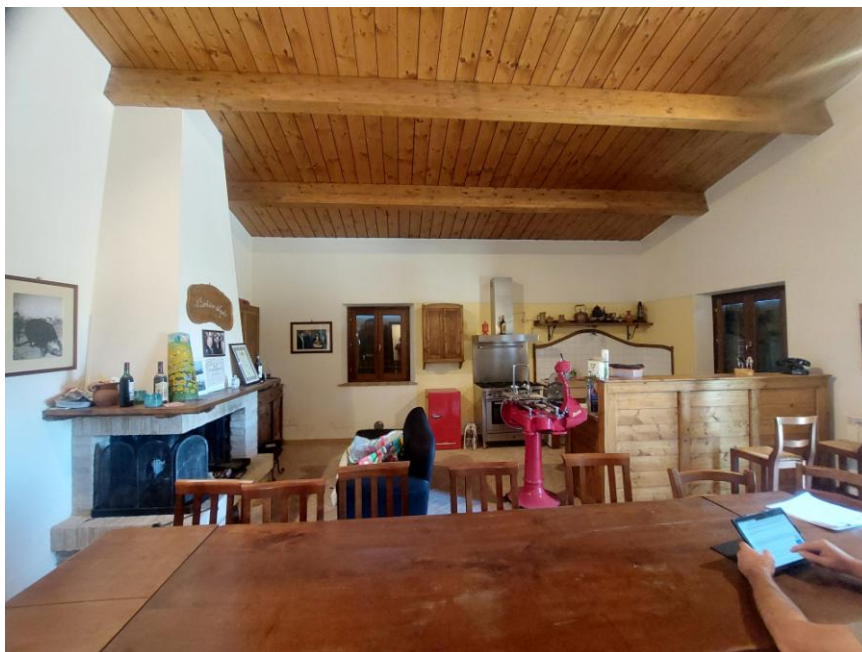
Foto n.55: Particolare della cucina/soggiorno del fabbricato di civile abitazione (Bene B). Notare, il caminetto, la parete rivestita con piastrelle di ceramica nell'angolo cottura e i solai con orditura in legno lamellare.