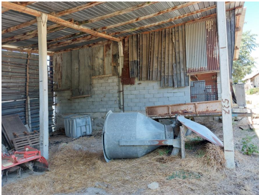
Foto n.74: Particolare interno della rimessa (Bene D). Notare la struttura in cemento armato e i solai con orditura in legno e le tamponature esterne in parte realizzate con blocchi forati di laterizio e parte con lamiera.