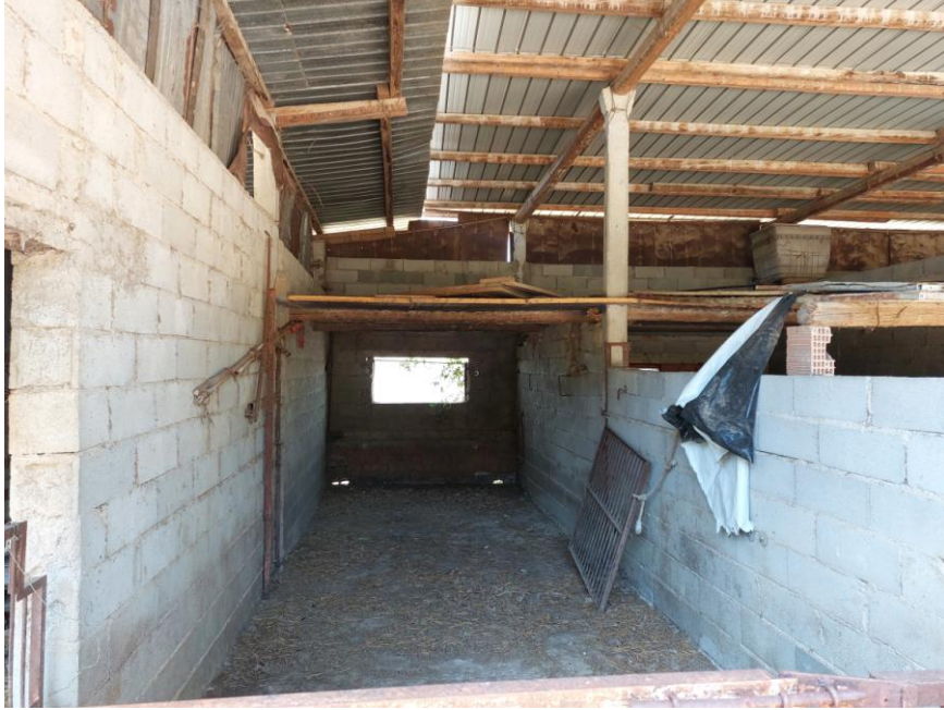
Foto n.73: Altro particolare interno della rimessa (Bene D). Notare l'apertura di collegamento delimitata da cancello in metallo tra la stalla e la rimessa.