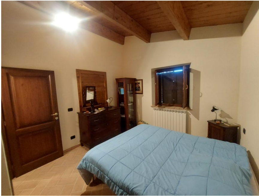
Foto n.57: Particolare della camera (Bene B). Notare, le pareti intonacate e tinteggiate, il pavimento realizzato con mattonelle in cotto, gli infissi e la finestra in legno, l'elemento radiante dell'impianto di riscaldamento in alluminio e l'impianto elettrico sottotraccia.