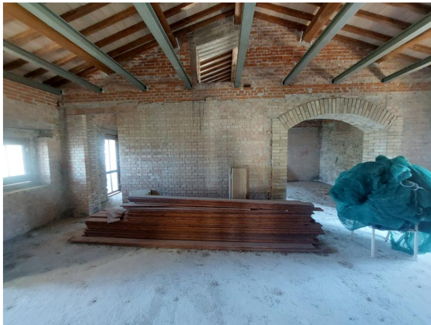
Foto n. 46: Altro particolare del locale indicato in planimetria come cucina/pranzo (Bene A). Notare il pavimento in battuto di cemento e le pareti realizzate con mattoncini stilati a faccia vista, non intonacate né tinteggiate. Sono visibili, ai lati dell'immagine, le aperture di collegamento con il locale indicato in planimetria come soggiorno.