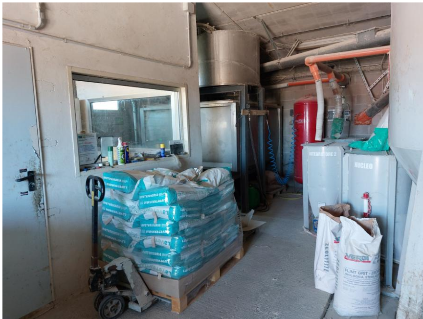
Foto n.20: Particolare interno del locale tecnico al piano terra (Bene F). Notare il pavimento in battuto di cemento e l'impianto elettrico del tipo fuori traccia protetto da canaline per cavi. È visibile sulla destra dell'immagine il locale comandi.