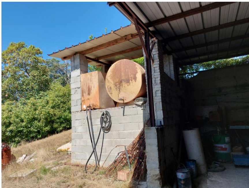
Foto n. 62: Altro particolare della tettoia adibita a rimessa (Bene C). Notare, il prospetto sud del ripostiglio tamponato con blocchi forati di laterizio, la tettoia con pannelli in ferro coibentato e la struttura portante in ferro/acciaio della tettoia.