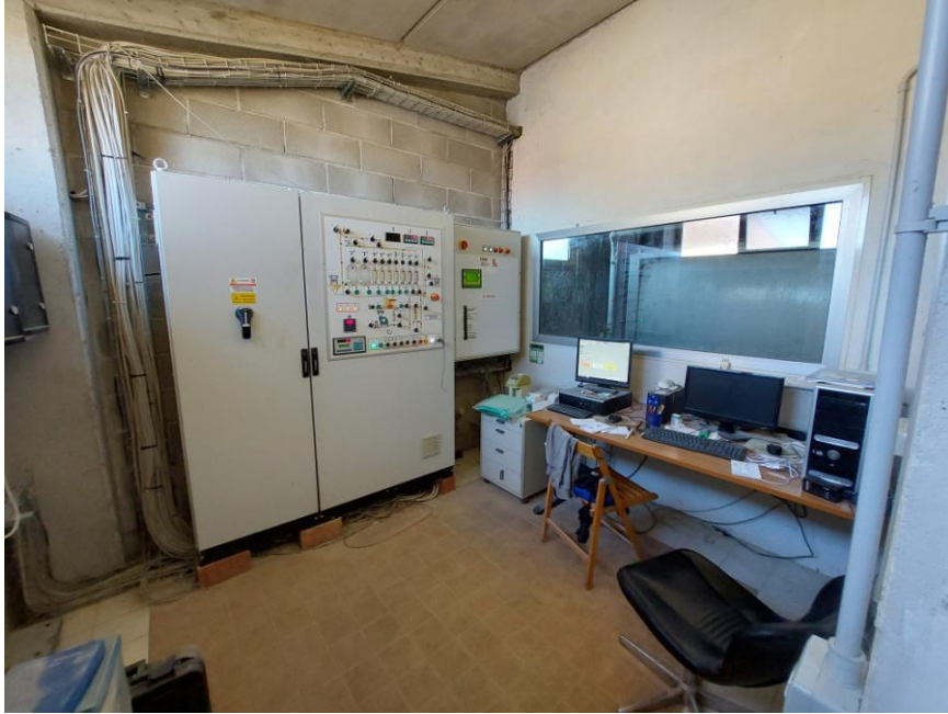
Foto n.21: Altro particolare del locale tecnico al piano terra (Bene F). Notare il pavimento rivestito con piastrelle di ceramica e la parete non intonacate ne tinteggiate.