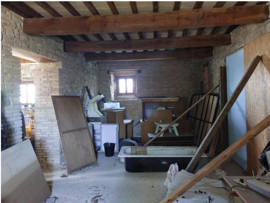
Foto n.44: Particolare del locale indicato in planimetria come cucina al piano terra (Bene A). Sono visibili, a sinistra dell'immagine, l'apertura di collegamento con il locale indicato in planimetria come camera e a destra dell'immagine, l'apertura di collegamento con il locale indicato in planimetria come soggiorno. Notare centralmente la finestra che si affaccia sul prospetto principale ovest.