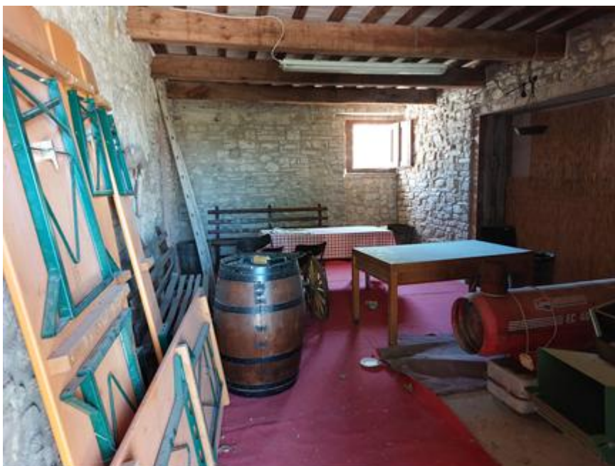
Foto n.42: Particolare del locale indicato in planimetria come soggiorno al piano terra, ripreso da sotto il portico (Bene A). È visibile centralmente la finestra con affaccio sul prospetto posteriore est e a destra dell'immagine, l'apertura di collegamento con il locale indicato in planimetria come cucina. Notare le pareti in pietra faccia vista e l'impianto elettrico del tipo fuori traccia.