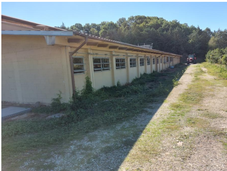
Foto n.24: Particolare dei prospetti nord ed ovest della Stalla n.1 (Bene F). Sono visibili le finestre con telaio in alluminio anodizzato con lamelle multiple in policarbonato.