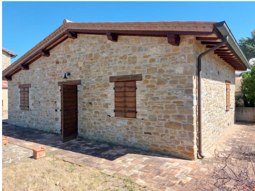
Foto n.50: Altro particolare del fabbricato di civile abitazione (Bene B). Sono visibili i prospetti sud ed ovest. Notare le gronde realizzate con zampini in legno ed interposte pianelle, le finestre e la portafinestra dotate di portelloni con doghe alla mercantile e gli imbotti con mattoncini e gli architravi in legno.