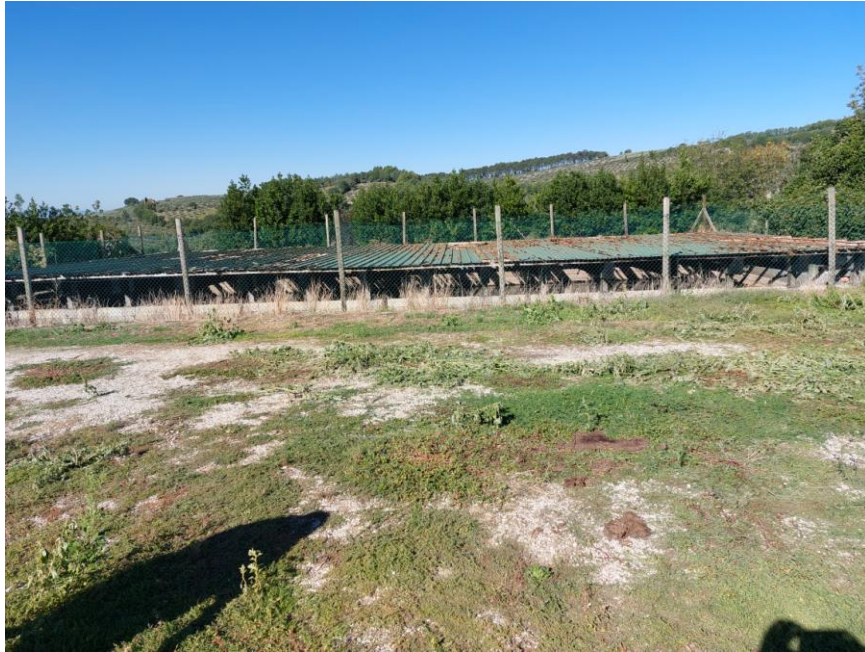
Foto n.15: Particolare della vasca interrata per lo stoccaggio ed il recupero dei liquami (Bene F). Notare la recinzione con rete metallica e pali in legno.