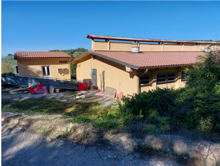
Foto n.5: Particolare dei prospetti sud ed est della Stalla n.2 (Bene F). Sono visibili, in primo piano, l'accesso pedonale delimitato da porta in metallo della stalla e a sinistra dell'immagine, l'accesso pedonale delimitato da portafinestra a due ante del magazzino. Notare il tetto a due falde riunite al colmo con cupolino "a taglio termico" e il manto di copertura in coppo tegola.