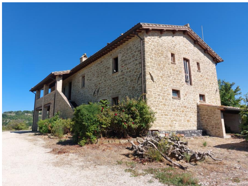
Foto n.38: Particolare dei prospetti sud ed ovest del fabbricato rurale (Bene A). Notare gli infissi in legno delle finestre e a destra dell'immagine, la piccola tettoia adibita a ripostiglio.