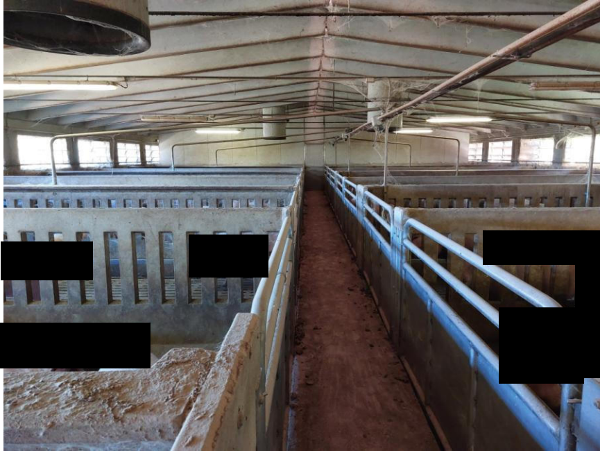
Foto n.25: Particolare interno della Stalla n.1 (Bene F). Notare la struttura portante dell'edificio in cemento armato prefabbricato e la stabulazione del tipo in gruppo in box collettivo.