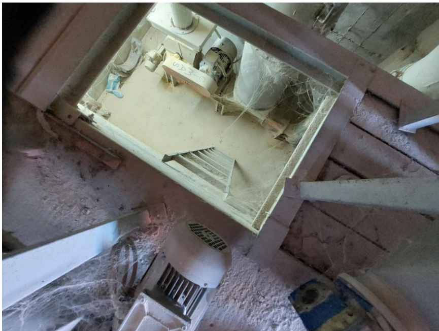
Foto n.22: Particolare del locale tecnico al piano primo sottostrada (Bene F). Notare il pavimento in battuto di cemento e la scala in ferro di collegamento amovibile.