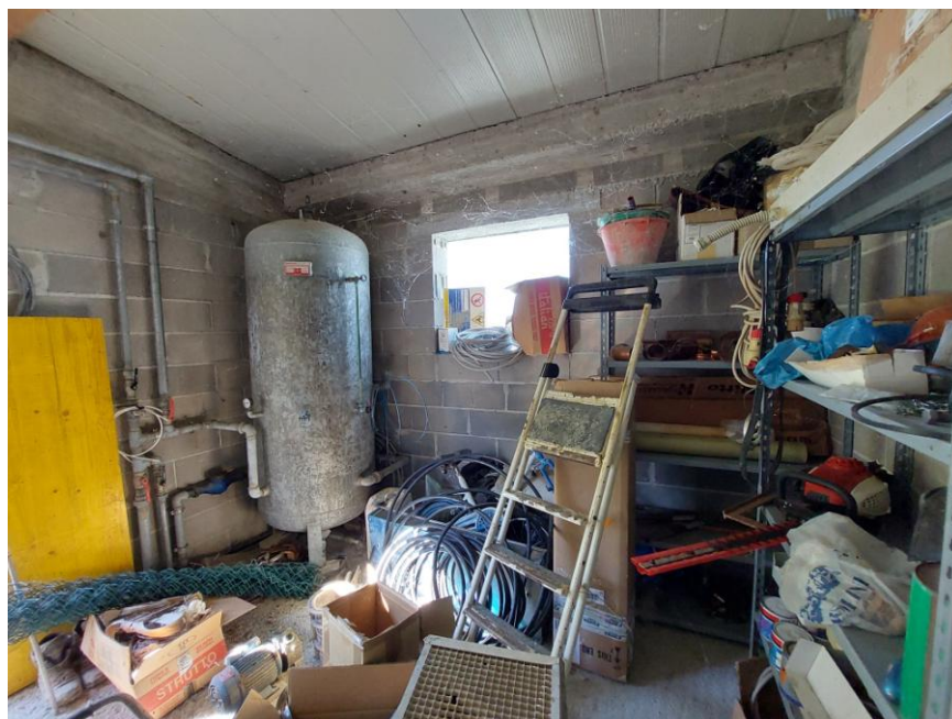
Foto n.12: Particolare interno del locale tecnico (Bene F). Notare, la struttura in blocchi forati di laterizio, le pareti non intonacate ne tinteggiate, la copertura con pannelli in ferro coibentati e il polmone di pressurizzazione dell'acqua.