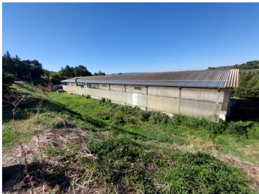
Foto n. 30: Particolare del prospetto est dell'impianto di compostaggio (Bene E).