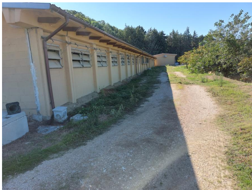
Foto n.10: Particolare del prospetto ovest della Stalla n.2 (Bene F) ripreso da angolazione opposta rispetto alla foto precedente. Notare i canali di gronda e i pluviali discendenti in rame e sullo sfondo il prospetto nord del piccolo fabbricato adibito ad ufficio.