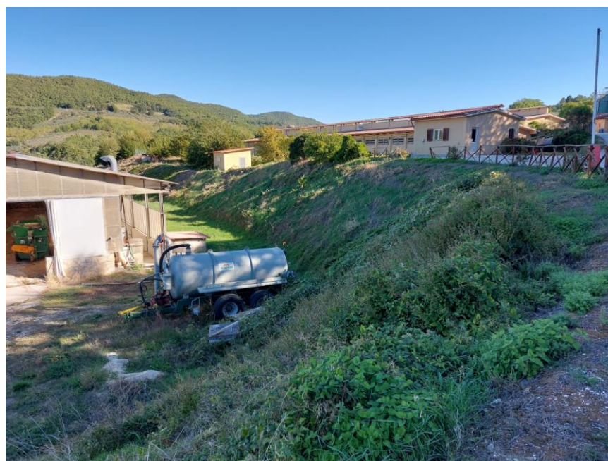
Foto n. 2: Altra veduta del centro aziendale in Comune di Assisi, Località Biagiano. Sono visibili, a sinistra dell'immagine, l'impianto di compostaggio (Bene E), in alto vari fabbricati agricoli intonacati in giallo (stalla, locale tecnico e ufficio - Bene F) che costituiscono il nucleo centrale dell'attività agricola di allevamento dei suini.