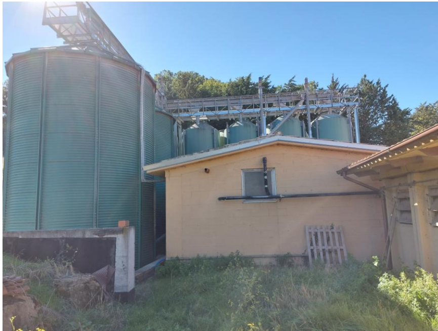
Foto n.19: Particolare del prospetto nord del locale tecnico (Bene F). Notare il tetto a due falde, le pareti intonacate e tinteggiate e gli infissi esterni delle finestre in alluminio.