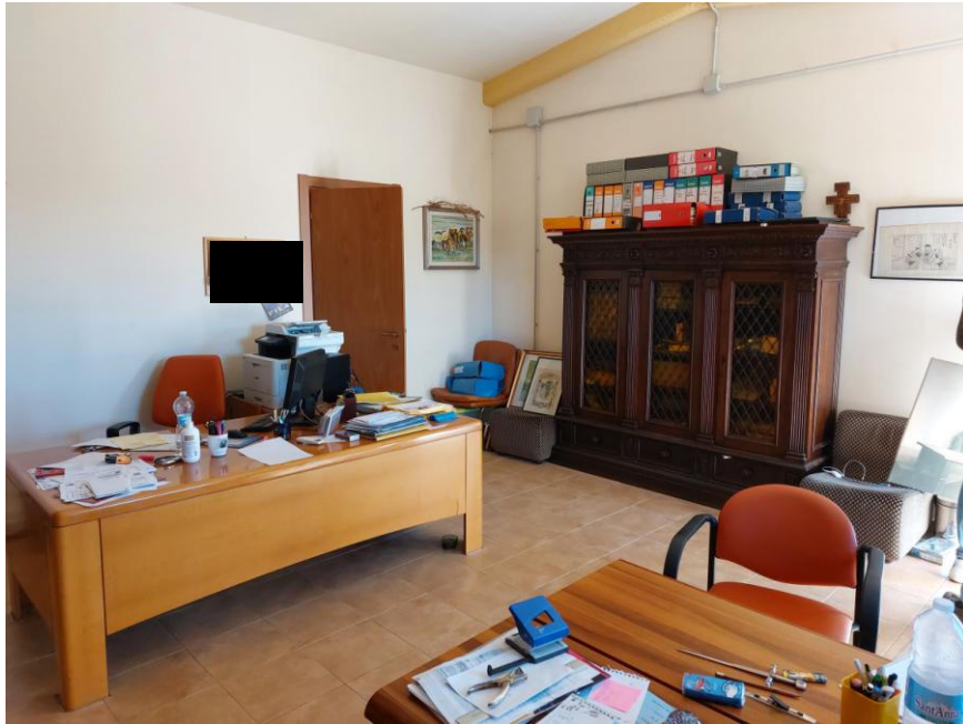
Foto n.7: Altro particolare interno dell'ufficio (Bene F). Notare le pareti intonacate e tinteggiate, l'impianto elettrico fuori traccia protetto da canaline per cavi e la porta in legno di accesso al w.c..