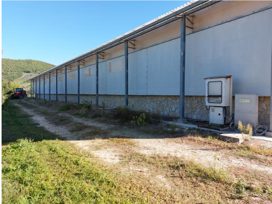
Foto n.33: Particolare del prospetto ovest dell'impianto di compostaggio (Bene E). Notare la struttura portante con pilastri e travi d'acciaio.