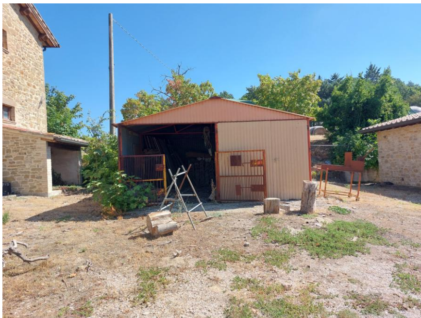
Foto n.53: Particolare della corte comune (Beni B-C). Notare in primo piano il piccolo fabbricato in lamiera adibito a magazzino non autorizzato.