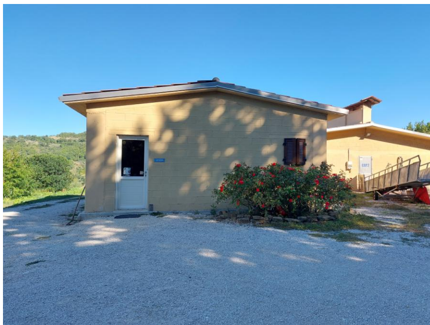
Foto n.4: Particolare dell'ufficio (Bene F). Notare il prospetto sud dell'ufficio, la porta in alluminio anodizzato e vetro, il tetto a due falde e la finestra con persiane in legno. È visibile, a destra dell'immagine, l'accesso pedonale delimitato da porta in metallo sul prospetto sud alla Stalla n.2.