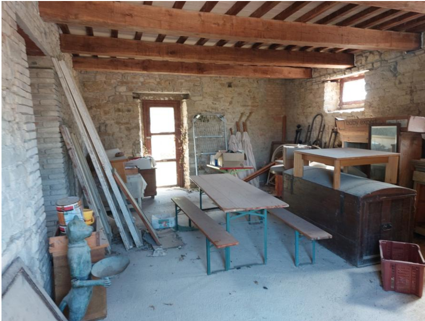
Foto n.43: Particolare del locale, indicato in planimetria come camera, al piano terra (Bene A). Sono visibili, centralmente l'accesso pedonale sul prospetto posteriore est e a destra dell'immagine, la finestra che si affaccia sul prospetto sud. Notare il locale privo dei muri divisorii, il pavimento in battuto di cemento, le travi dei solai, gli infissi di finestra e portafinestra in legno.