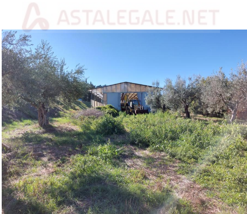
Foto n.32: Particolare dell'impianto di compostaggio (Bene E). Notare l'accesso carrabile sul retro prospetto nord del fabbricato.