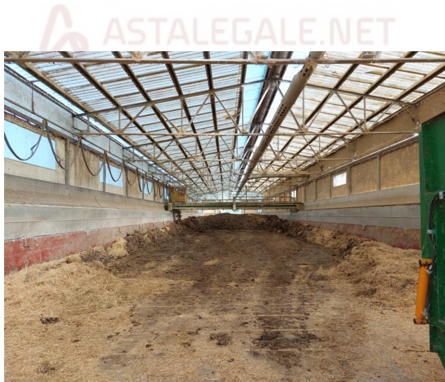
Foto n.34: Particolare interno della vasca di compostaggio (Bene E). Notare al centro macchina semovente, la struttura portante in cemento armato prefabbricato con pilastri e travi d'acciaio e le tamponature con pannelli in policarbonato.