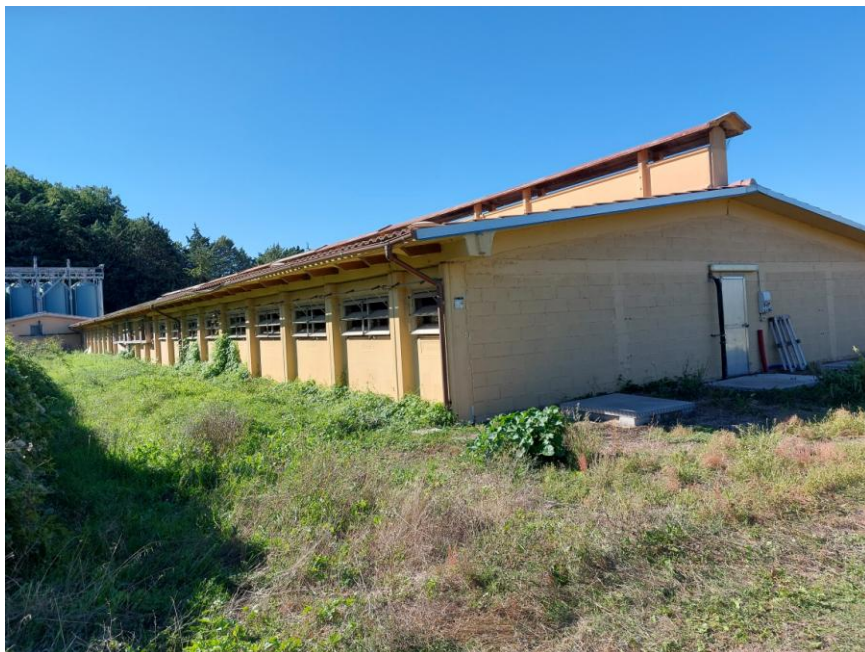
Foto n.23: Particolare dei prospetti nord ed est della Stalla n.1 (Bene F). Sono visibili, i canali di gronda e i pluviali discendenti in rame e sulla sinistra dell'immagine, il prospetto nord del piccolo fabbricato adibito a locale tecnico e i silos verticali.