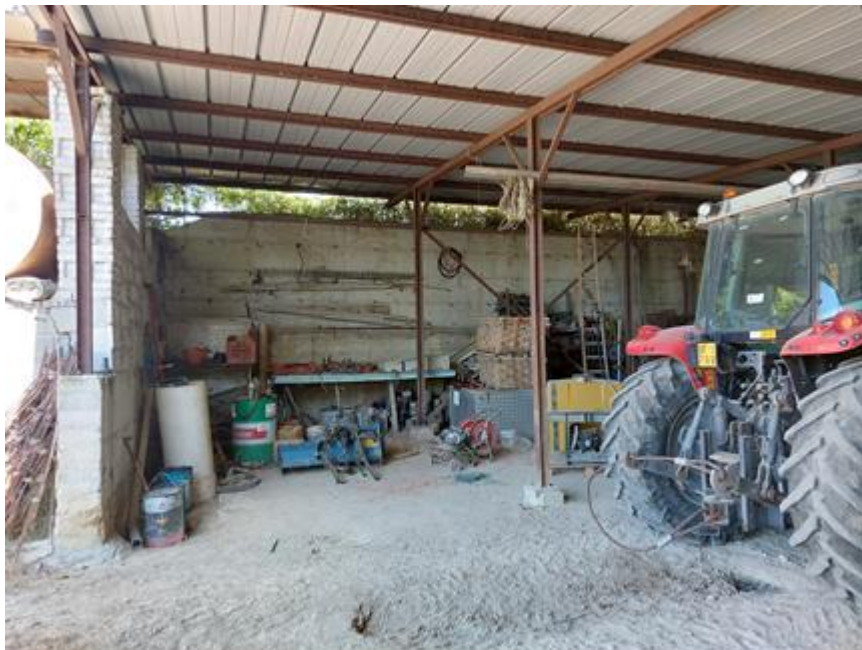
Foto n.64: Particolare interno della rimessa (Bene C). Notare la parete laterale di contenimento sul prospetto nord in cemento armato.