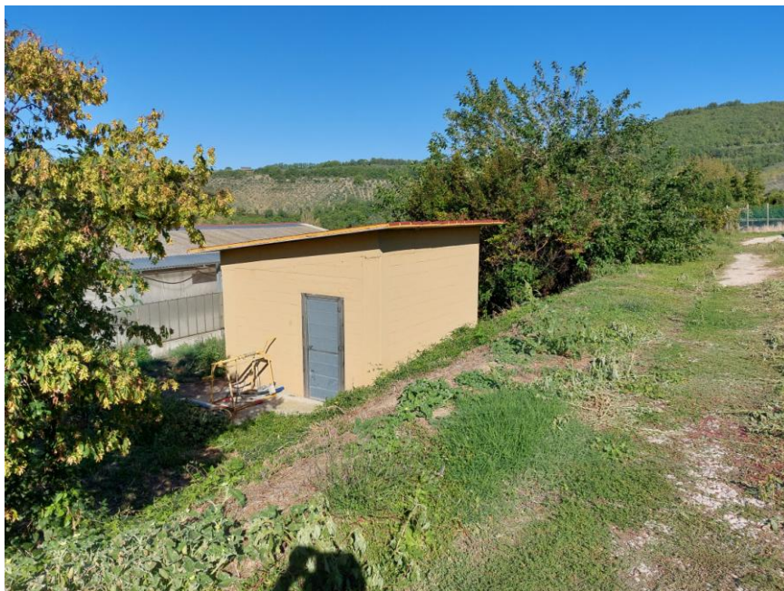
Foto n.11: Particolare del piccolo fabbricato adibito a locale tecnico (Bene F). Notare l'accesso pedonale sul prospetto sud delimitato da porta in metallo, il tetto a una falda e le pareti intonacate e tinteggiate in giallo. Sono visibili, sulla sinistra dell'immagine l'impianto di compostaggio (Bene E) e sulla destra dell'immagine, la rete della vasca per lo stoccaggio ed il recupero dei liquami (Bene F).