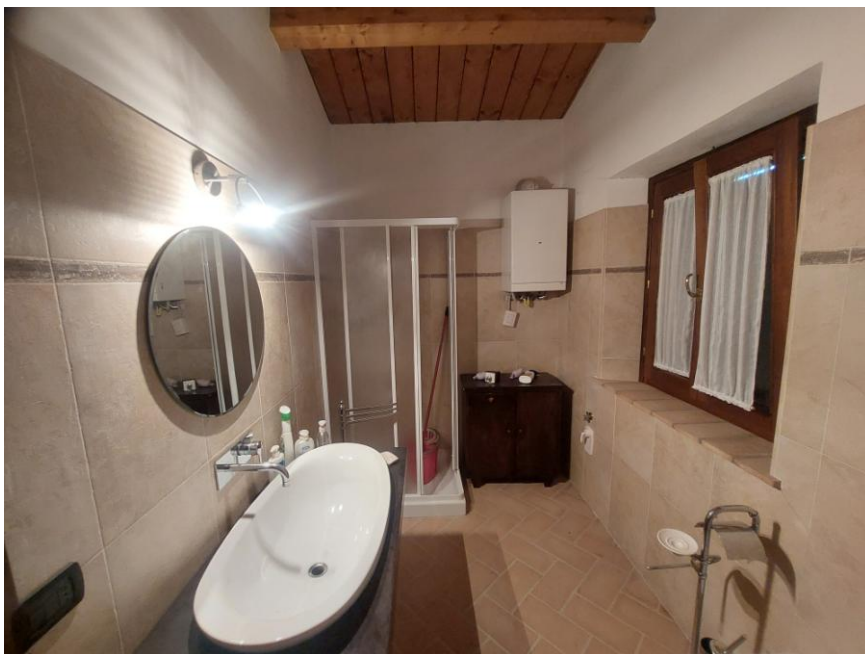
Foto n.60: Altro particolare del bagno (Bene B) ripreso da angolazione opposta rispetto alla foto precedente. Notare la caldaia per la produzione di acqua calda termo sanitaria e il box doccia.