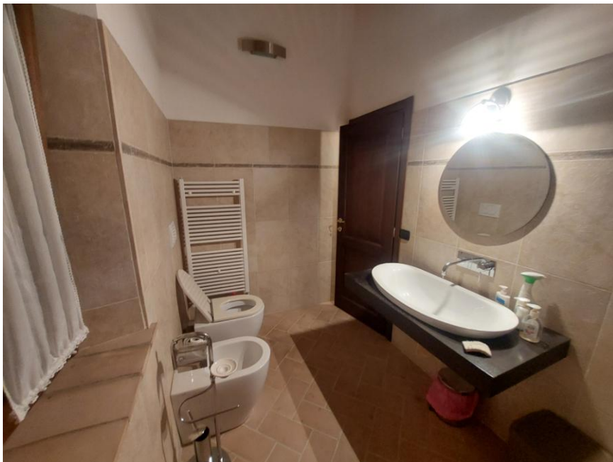
Foto n.59: Particolare del bagno (Bene B). Notare, la dotazione di sanitari, le pareti parzialmente rivestite con piastrelle di ceramica, il pavimento in monocottura e l'elemento radiante dell'impianto di riscaldamento in alluminio.