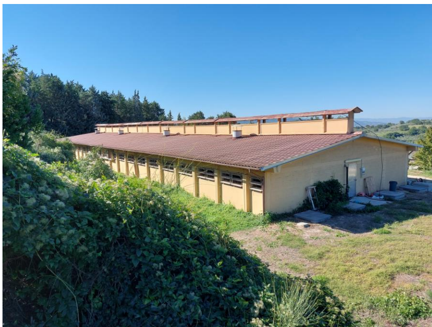
Foto n.14: Veduta dei prospetti nord ed est della Stalla n.2 (Bene F). Notare il manto di copertura in coppo tegola e le finestre con telaio in alluminio anodizzato con lamelle multiple in policarbonato dotate di centralina elettronica.