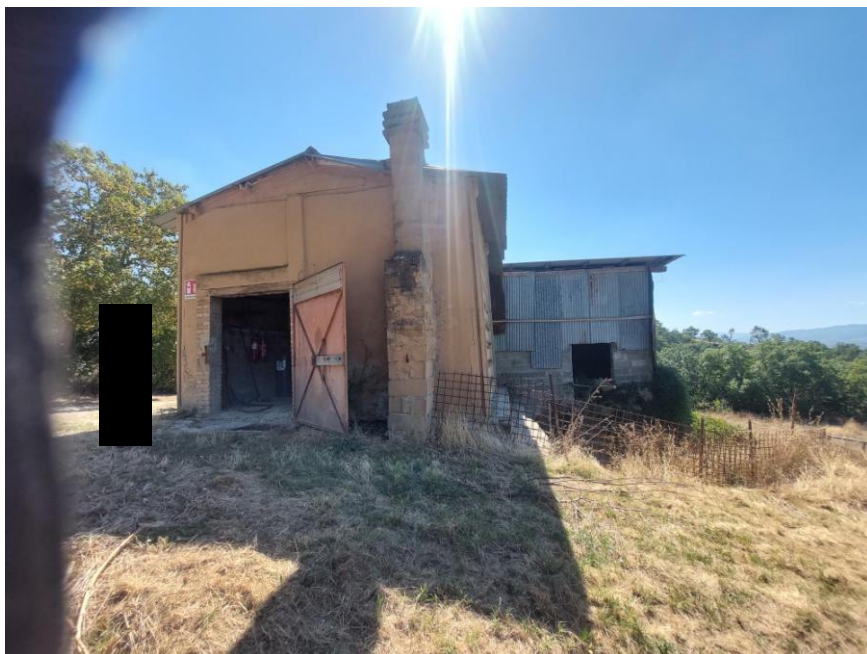
Foto n.67: Particolare del prospetto nord del fabbricato rurale (Bene D). Sono visibili, a sinistra dell'immagine, l'accesso pedonale delimitato da portellone in metallo al deposito e a destra dell'immagine, l'accesso alla stalla.