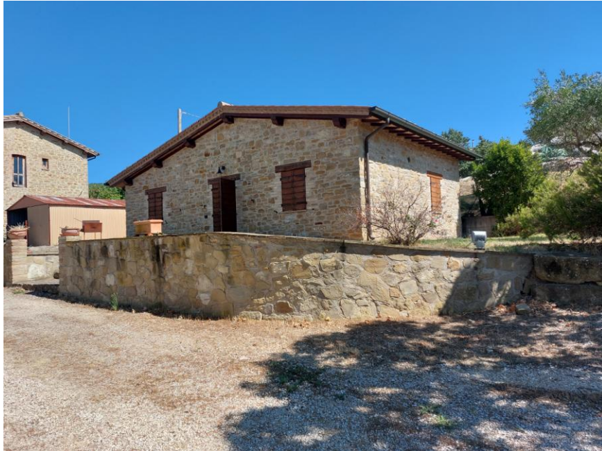
Foto n.49: Particolare del fabbricato di civile abitazione su un unico livello (Bene B). Notare, le tamponature esterne in pietra faccia vista e il tetto del tipo a capanna. Sono visibili, a sinistra dell'immagine, il fabbricato rurale (Bene A) e il piccolo fabbricato in lamiera adibito a magazzino non autorizzato.