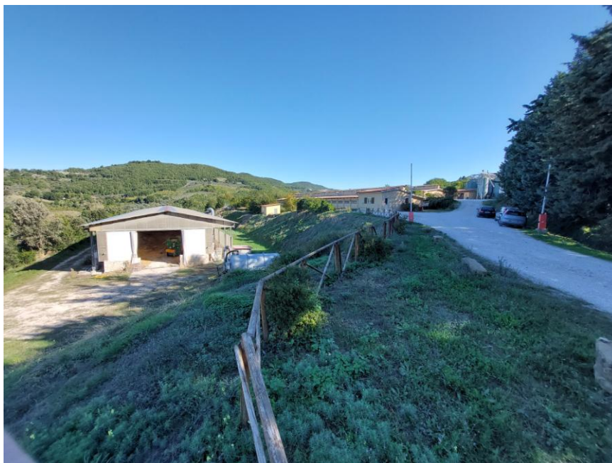
Foto n. 1: Veduta del centro aziendale in Comune di Assisi, Località Biagiano che costituisce parte del compendio immobiliare pignorato. Sono visibili alcune unità immobiliari (Beni E-F) oltre ad alcuni dei terreni agricoli (Bene G).