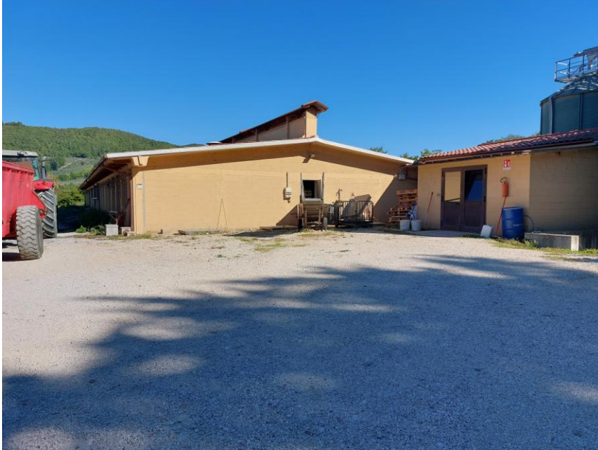
Foto n.17: Particolare del prospetto principale sud della Stalla n.1 (Bene F). Sono visibili, al centro dell'immagine, l'accesso pedonale delimitato da porta in metallo della stalla e il piazzale di lavoro in ghiaia battuta e a sinistra dell'immagine, l'accesso pedonale delimitato da portafinestra a due ante del locale tecnico.