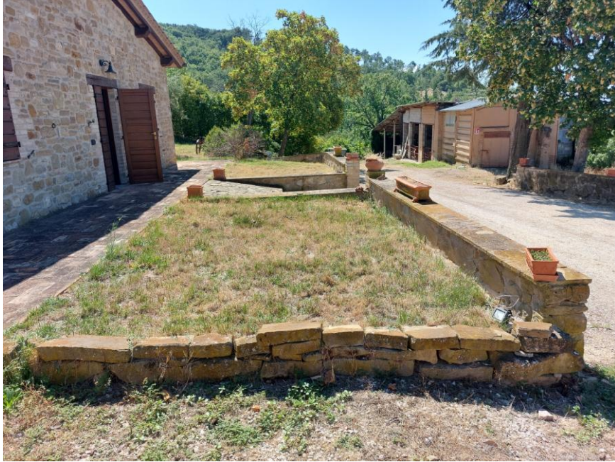
Foto n.65: Particolare della corte comune (Beni B-C). Sono visibili, a sinistra dell'immagine il fabbricato di civile abitazione (Bene B) e a destra dell'immagine, la strada interpoderale in direzione nord/sud e il fabbricato rurale adibito a stalla, deposito e rimessa (Bene D).