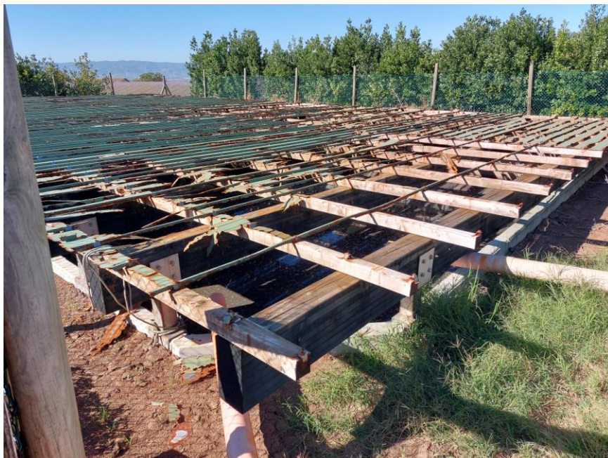
Foto n.16: Altro particolare della vasca interrata (Bene F). Notare i pannelli in lamiera grecata di colore verde.