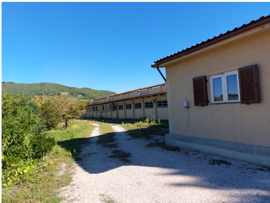
Foto n.9: Particolare del prospetto ovest della Stalla n.2 (Bene F). É visibile, a destra dell'immagine, la finestra con persiane in legno dell'ufficio sul prospetto ovest. Notare la struttura portante dell'edificio in cemento armato prefabbricato e le tamponature esterne intonacate e tinteggiate.