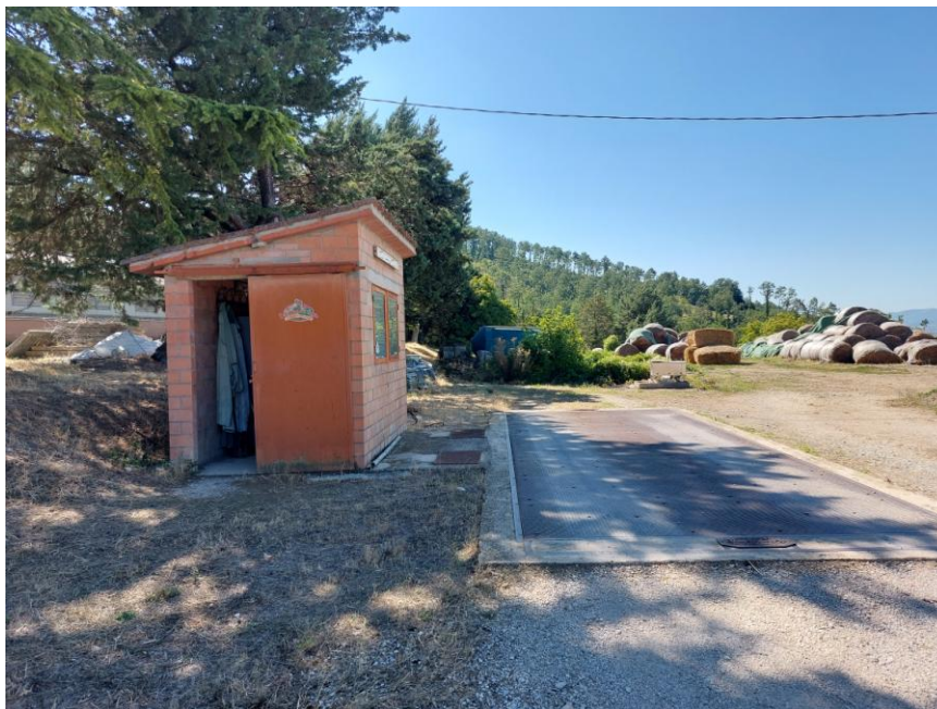
Foto n.52: Particolare della corte comune adibita a piazzale di lavoro sulla zona est (Beni B-C). Sono visibili in primo piano la pesa a ponte interrata e il locale tecnico. Notare le tamponature in mattoni forati non intonacata né tinteggiata e il tetto a una falda con copertura in coppo tegola.