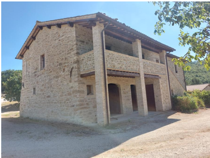
Foto n.37: Altro particolare del fabbricato rurale (Bene A). Sono visibili gli accessi pedonali al piano terra sotto il portico. Notare la struttura portante in pietra e mattoncini stilati a faccia vista, il tetto del tipo a due falde, i canali di gronda e i pluviali discendenti in rame.