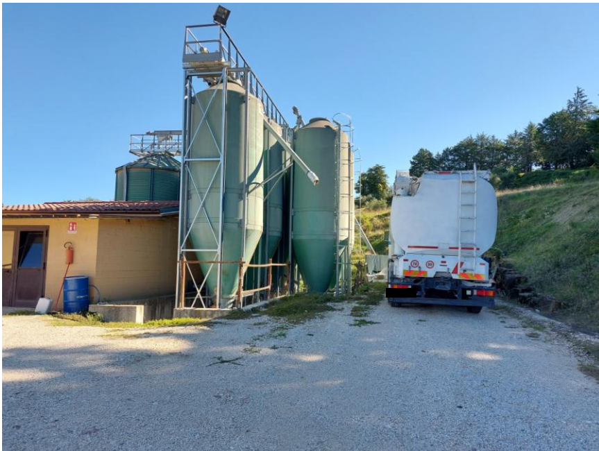
Foto n.18: Particolare del locale tecnico dell'impianto di alimentazione su due livelli (PT e 1PS - Bene F). Notare i silos verticali per lo stoccaggio dei mangimi sui prospetti sud ed est.