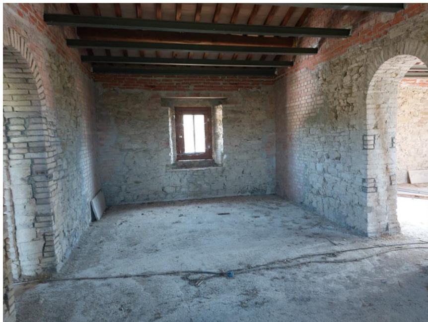
Foto n.48: Particolare del locale indicato in planimetria come camera al piano primo (Bene A). Sono visibili, a sinistra dell'immagine, l'apertura di collegamento con il locale indicato in planimetria come cucina/pranzo, centralmente la finestra che si affaccia sul prospetto est e a destra dell'immagine, l'apertura di collegamento con il locale indicato in planimetria come camera sul prospetto sud. Notare, il locale privo dei muri divisorii, degli impianti e di tutte le finiture ad eccezione degli infissi in legno.