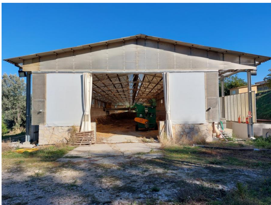
Foto n.28: Particolare dell'impianto di compostaggio (Bene E). Notare l'accesso carrabile sul prospetto sud dell'impianto di compostaggio e il tetto del tipo a due falde.