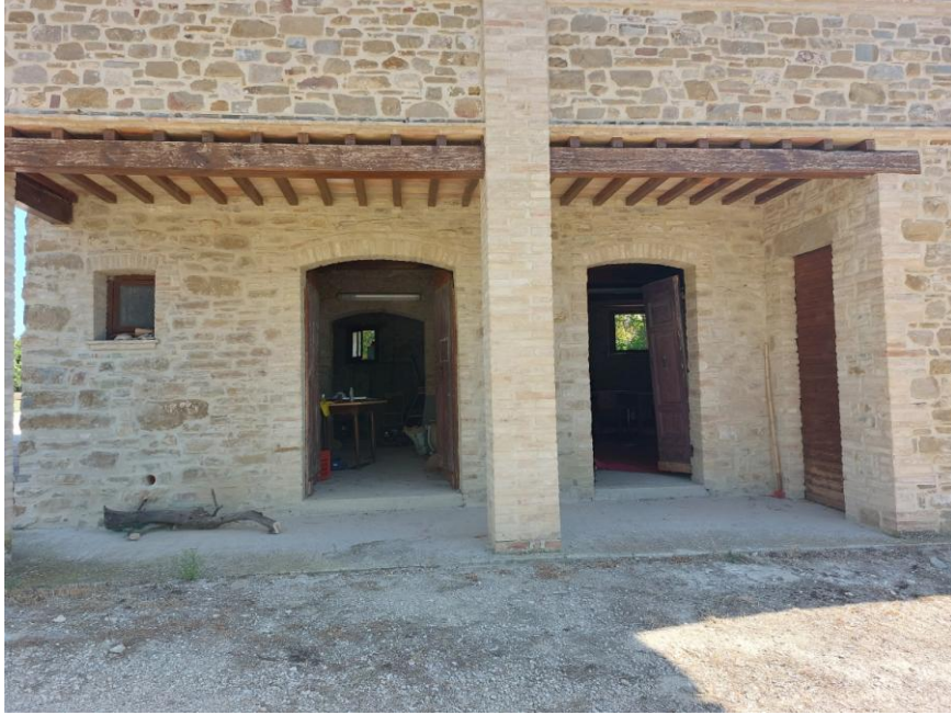
Foto n.39: Particolare del portico al piano terra sul prospetto principale ovest (Bene A). Sono visibili in primo piano gli accessi pedonali al piano terra delimitati da portoncini in legno a due ante e a destra dell'immagine, la porta in legno del vano sottoscala. Notare i solai con travi in legno e pianelle.