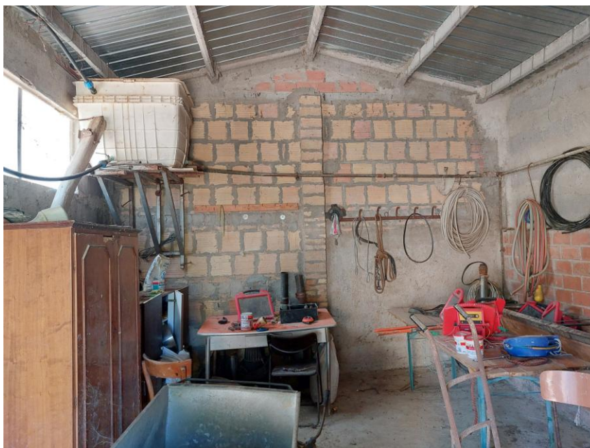
Foto n.69: Particolare del locale adibito a deposito del fabbricato rurale (Bene D). Notare il tetto del tipo a capanna, le pareti al grezzo non intonacate ne tinteggiate e il pavimento in battuto di cemento.