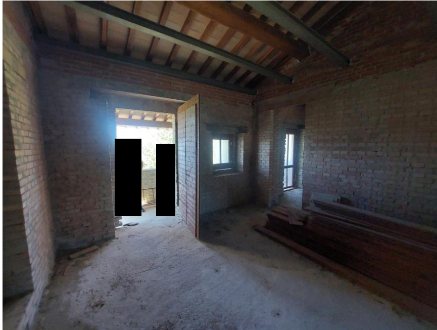
Foto n. 45: Particolare del locale indicato in planimetria come cucina/pranzo al piano primo (Bene A). Sono visibili, centralmente, l'ingresso principale sotto la loggia delimitato da portone in legno e a destra dell'immagine, l'apertura di collegamento con il locale indicato in planimetria come soggiorno.