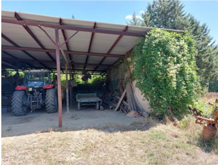
Foto n.63: Altro particolare della rimessa (Bene C). Notare la struttura portante in ferro/acciaio della tettoia.