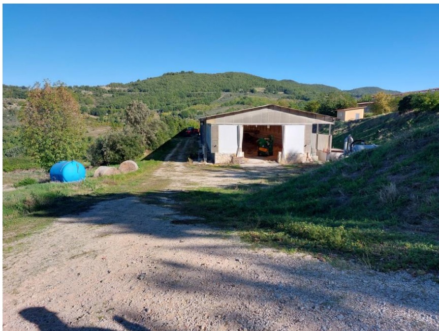
Foto n.27: Veduta del prospetto principale sud dell'impianto di compostaggio (Bene E). Notare l'ampio piazzale di lavoro in ghiaia battuta. È visibile, sulla destra dell'immagine, il piccolo fabbricato adibito a locale tecnico (Bene F) posto a metà della scarpata che scende verso ovest.