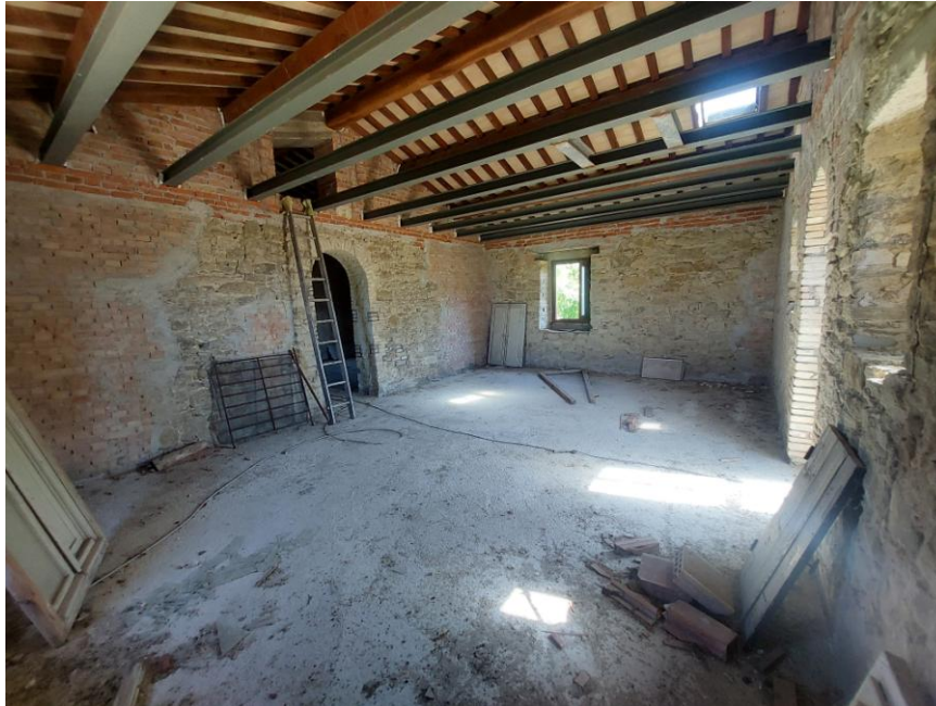
Foto n.47: Particolare del locale indicato in planimetria come camera sul prospetto sud al piano primo (Bene A). Sono visibili, centralmente, l'apertura di collegamento con il locale indicato in planimetria come camera e la finestra che si affaccia sul prospetto est. Notare il locale privo dei muri divisorii, i solai con orditura in legno e pianelle, il lucernario, la struttura con travi in ferro e le pareti non intonacate.