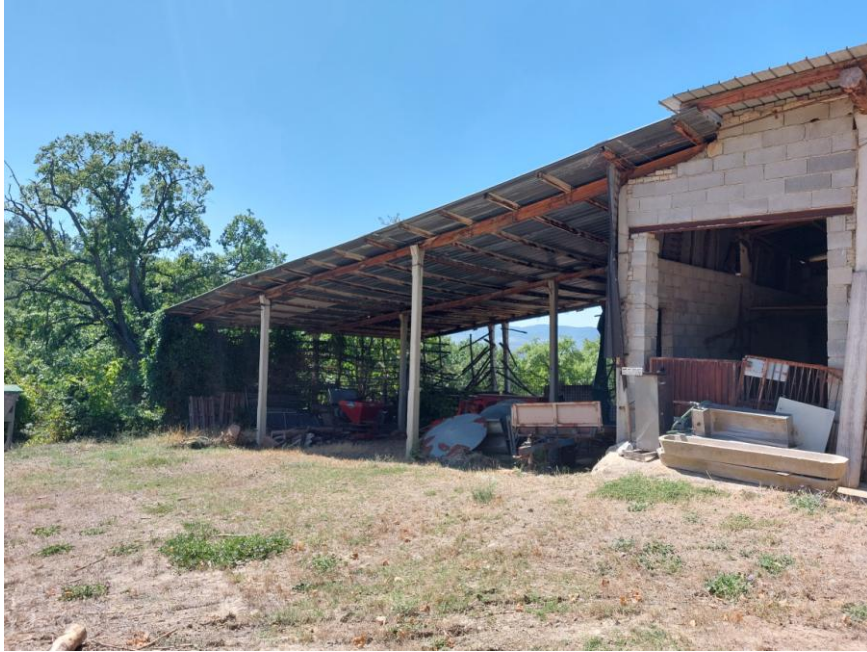
Foto n.71: Altro particolare del fabbricato agricolo adibito a rimessa (Bene D). Notare il tetto del tipo ad una falda con copertura in lamiera, i solai con orditura in legno, la struttura in cemento armato e le pareti parzialmente tamponate in stato di degrado.