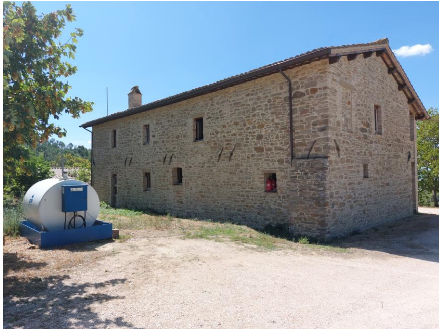
Foto n.35: Particolare del fabbricato rurale adibito in parte ad uso abitativo e in parte a servizio dell'agricoltura su due livelli (piano terra e 1° - Bene A). Notare i prospetti nord ed est, il tetto del tipo a due falde e il manto di copertura in coppi. È visibile, a sinistra dell'immagine, l'apertura di accesso al piano terra.