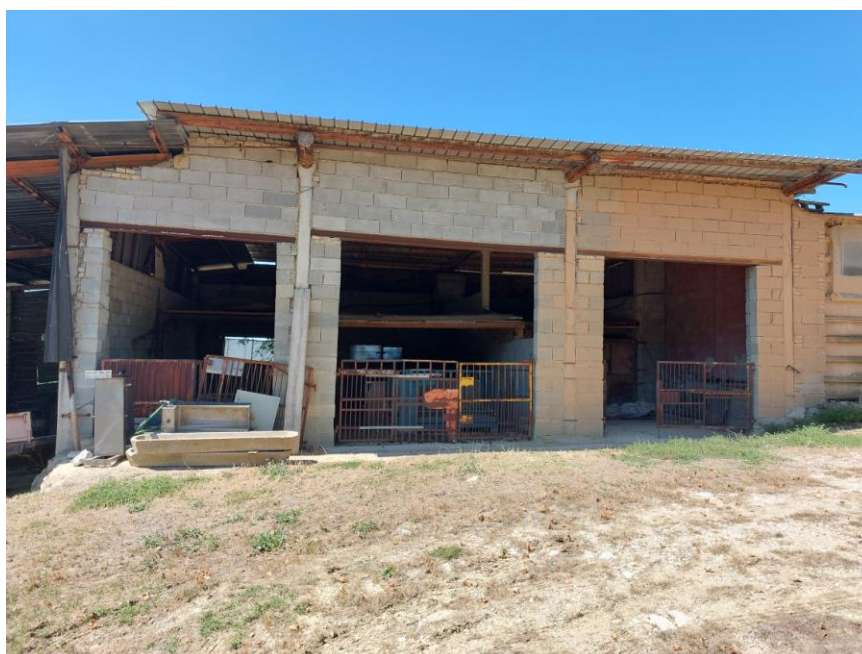
Foto n.70: Particolare del prospetto est del fabbricato rurale adibito a rimessa (Bene D). Notare la struttura portante in cemento armato, la copertura in lamiera e le pareti tamponate con blocchi forati di laterizio ed esternamente non intonacate.