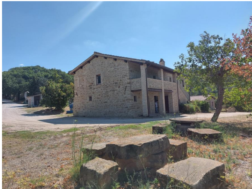
Foto n.36: Particolare dei prospetti nord ed ovest del fabbricato rurale (Bene A). Notare il portico, la loggia e la scala esterna. Sono visibili, a sinistra dell'immagine, la strada interpodereale "di Casanuova" e a destra dell'immagine, il fabbricato di civile abitazione su un unico livello (Bene B).