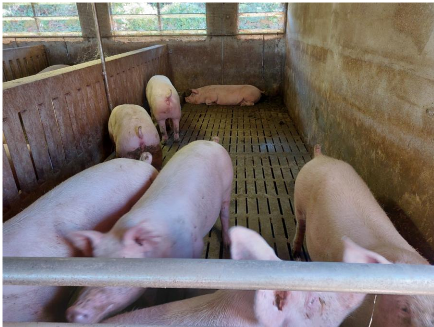
Foto n.26: Altro particolare interno della Stalla n.1 (Bene F). Notare il pavimento totalmente fessurato.