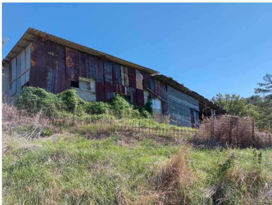
Foto n.68: Particolare del prospetto ovest del fabbricato rurale adibito a stalla (Bene D). Notare le tamponature esterne in lamiera in stato di degrado.