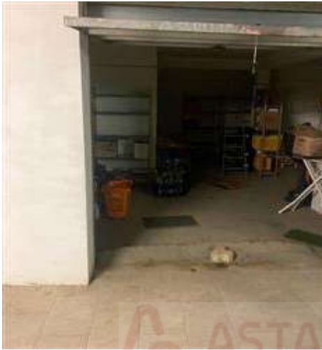
Ingresso garage, porta basculante

L'intero edificio sviluppa 3 piani, 2 piani fuori terra, 1 piano interrato. Immobile costruito nel 2001.