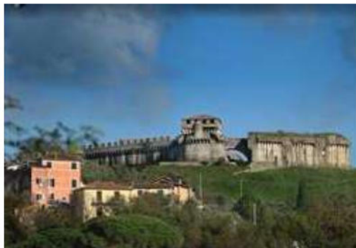
Fortezza di Sarzanello

agricole. I più importanti centri urbani limitrofi sono Sarzana e Carrara . Il traffico nella zona è locale, i parcheggi sono sufficienti. Sono presenti i servizi di urbanizzazione primaria e secondaria. Costituiscono attrazioni storico -paesaggistiche la Fortezza di Sarzanello , a poca distanza la zona archeologica di Luni e le spiagge di Marinella .