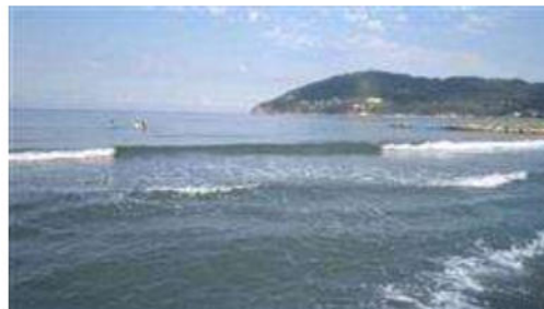
Spiaggia libera di Marinella di Sarzana