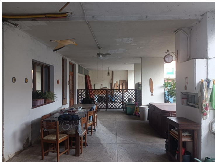
Vista del portico a ovest e ad est