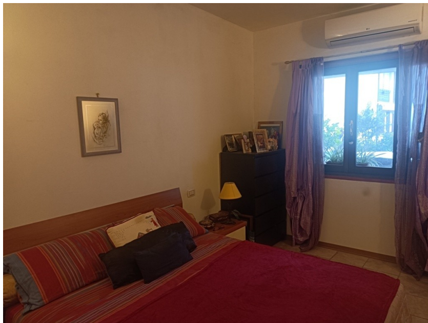
Il bagno a piano terra e la "cantina" adibita a camera da letto