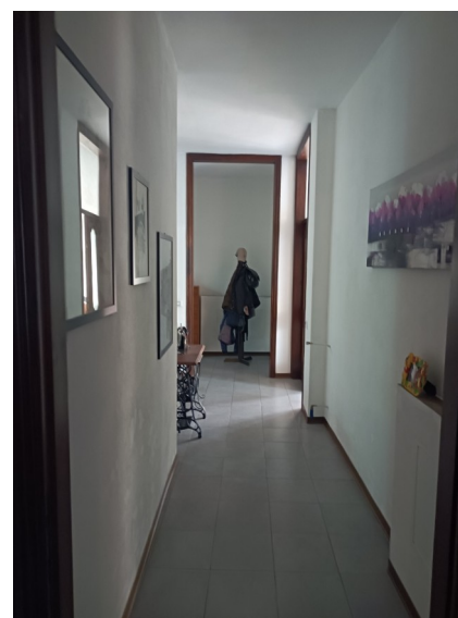
La scala dal p.t. al 1° p. e il disimpegno al 1° p.