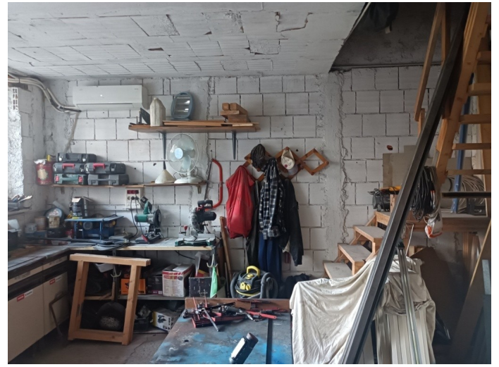
Ripostiglio a sud con corte esclusiva esterna e interno a p.t.