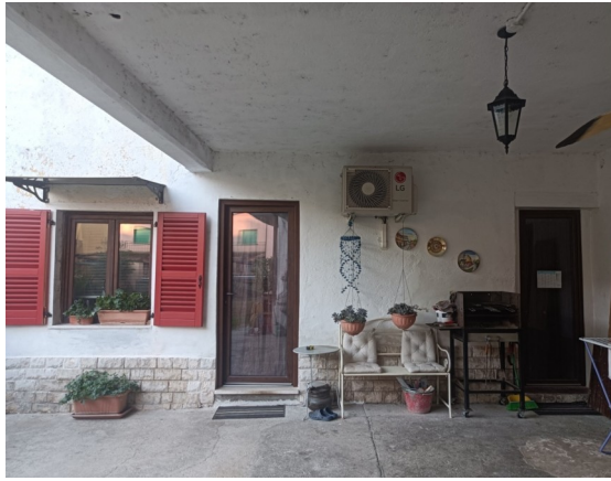
Ingresso ai ripostigli