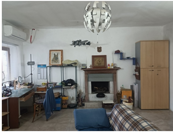
Ripostiglio a ovest p.t. con il bagno di pertinenza