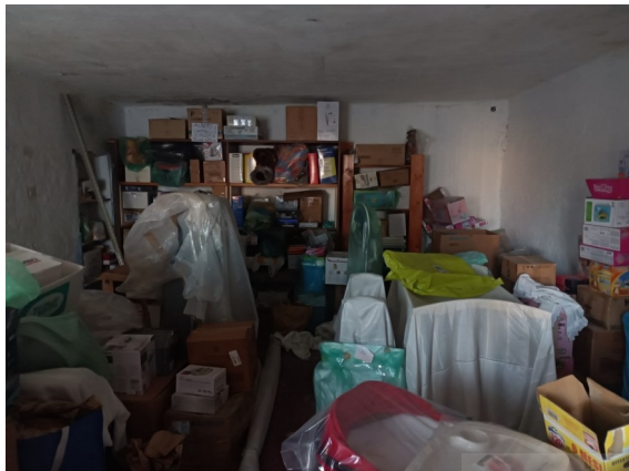
Ripostiglio a ovest 1° p.