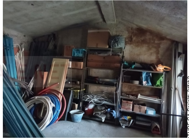
Ripostiglio a sud 1° p.