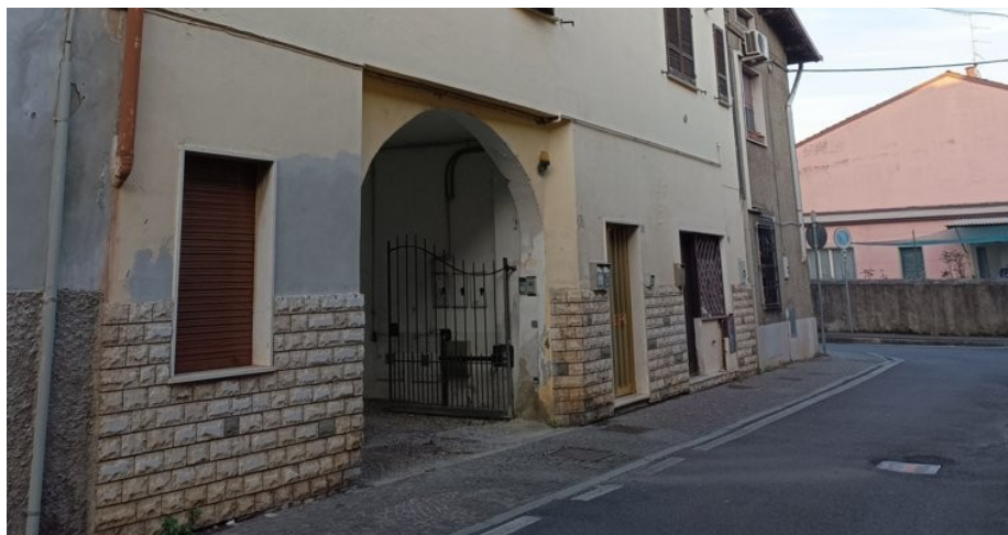
Ingresso sulla Via Magenta al civico n. 1