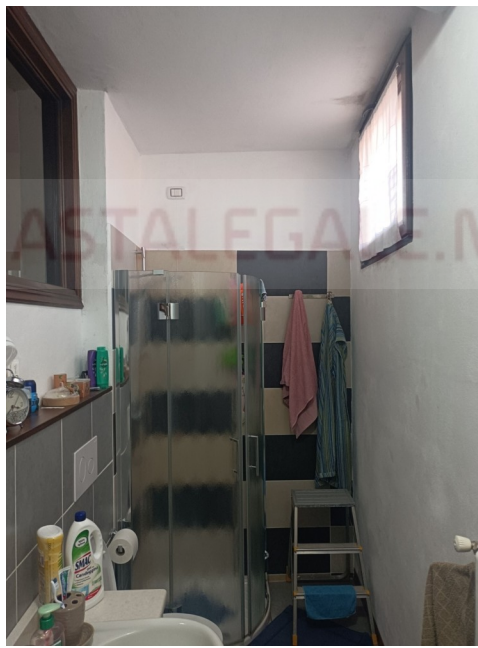
1° p. Bagno lavanderia a nord