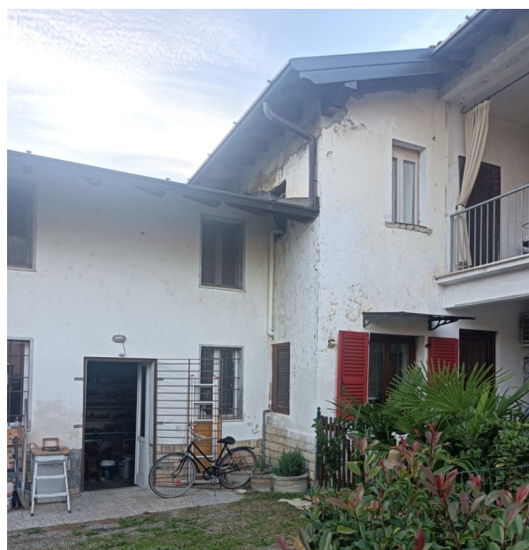
Prospetto ovest con i corpi ripostiglio