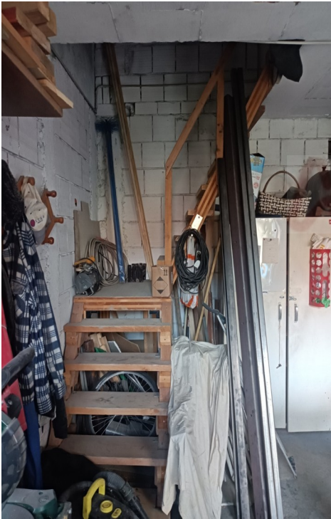
Scala di collegamento