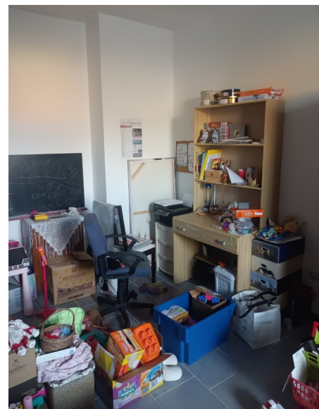
1° p. Camera a est

Firmato Da: RESPELLI PAOLA Emesso Da: INFOCAMERE QUALIFIED SIGNATURE CA Serial#: 2dfcb2