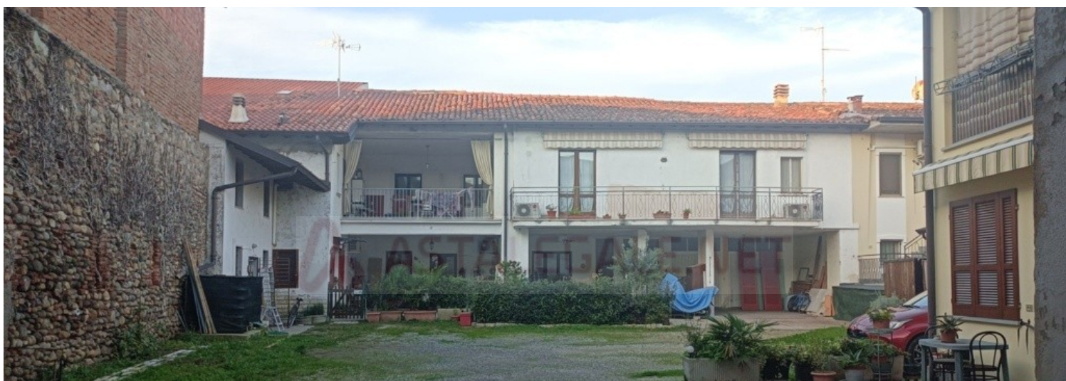
Corte interna con prospetto nord e antistante corte comune esclusiva