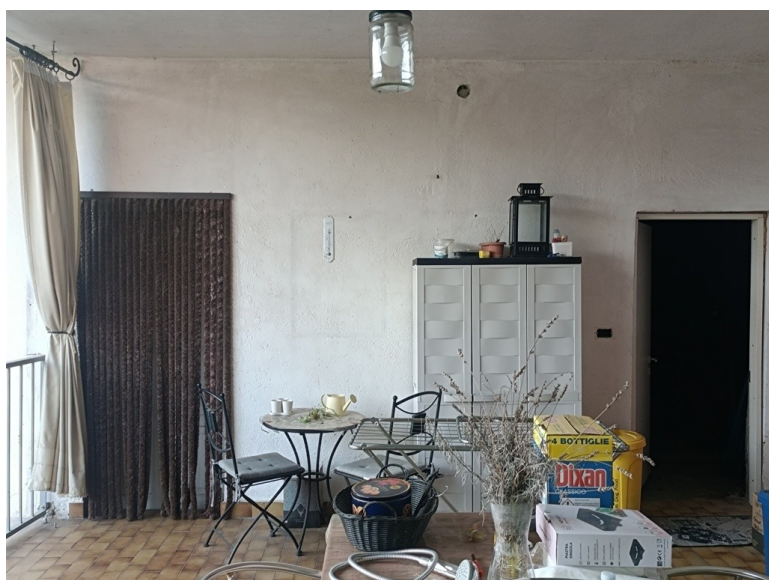
1° p. La loggia