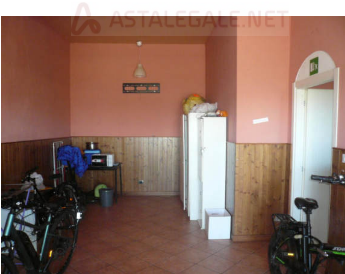
Figura 32 - Vista dei beni oggetto di vendita