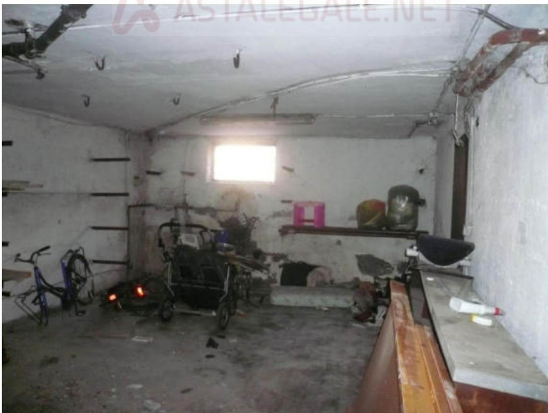
Figura 34 - Vista dei beni oggetto di vendita