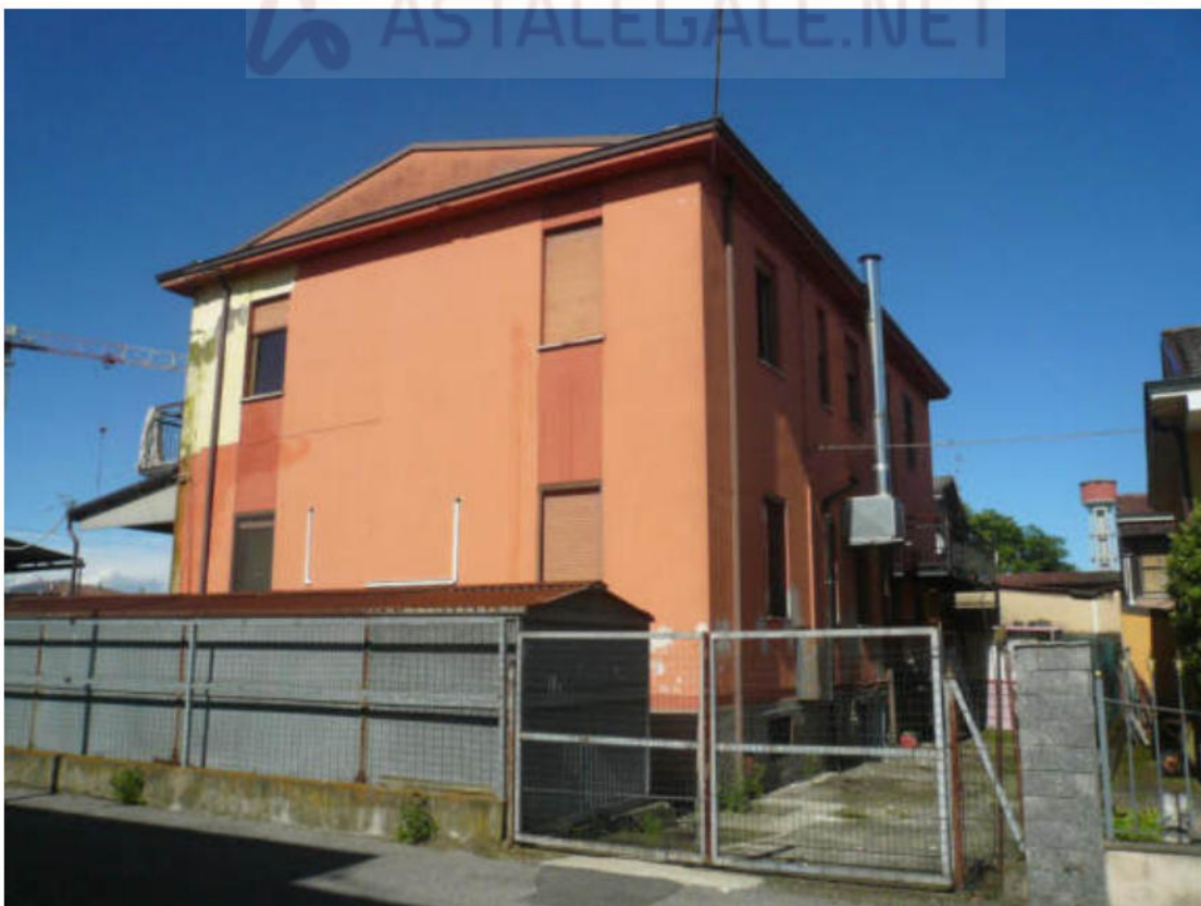
Figura 4 - Vista dei beni oggetto di vendita