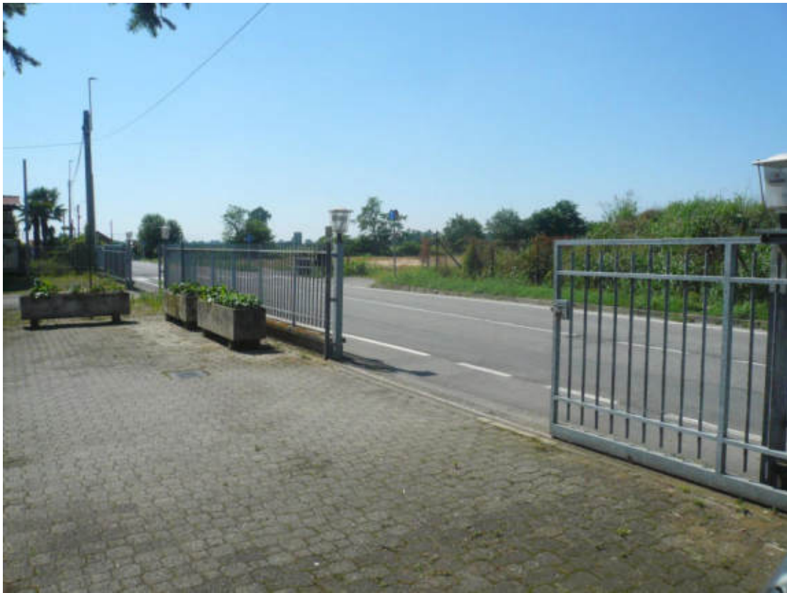
Figura 11 - Vista dei beni oggetto di vendita