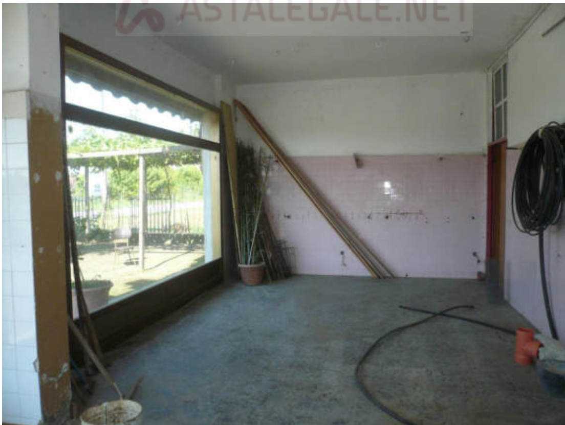
Figura 14 - Vista dei beni oggetto di vendita