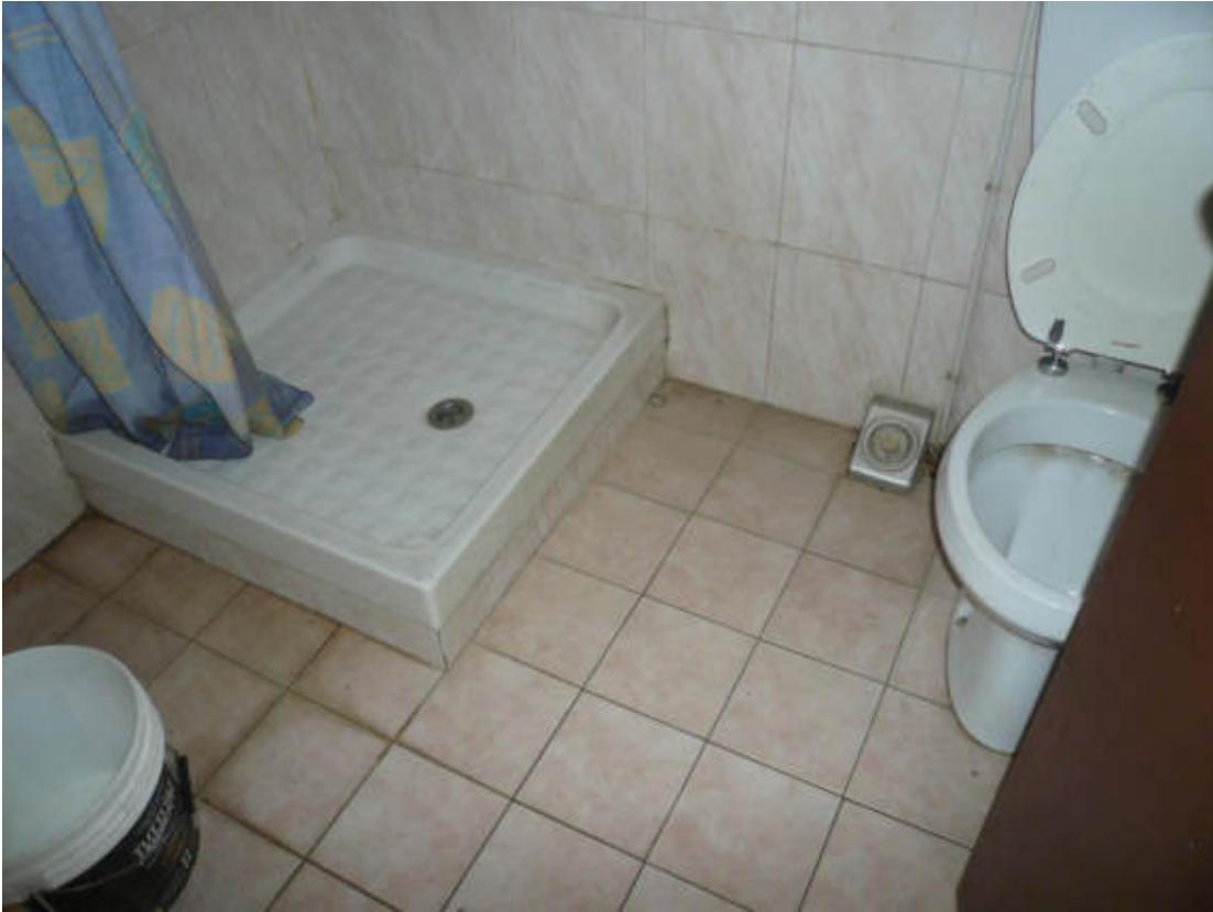
Figura 31 - Vista dei beni oggetto di vendita