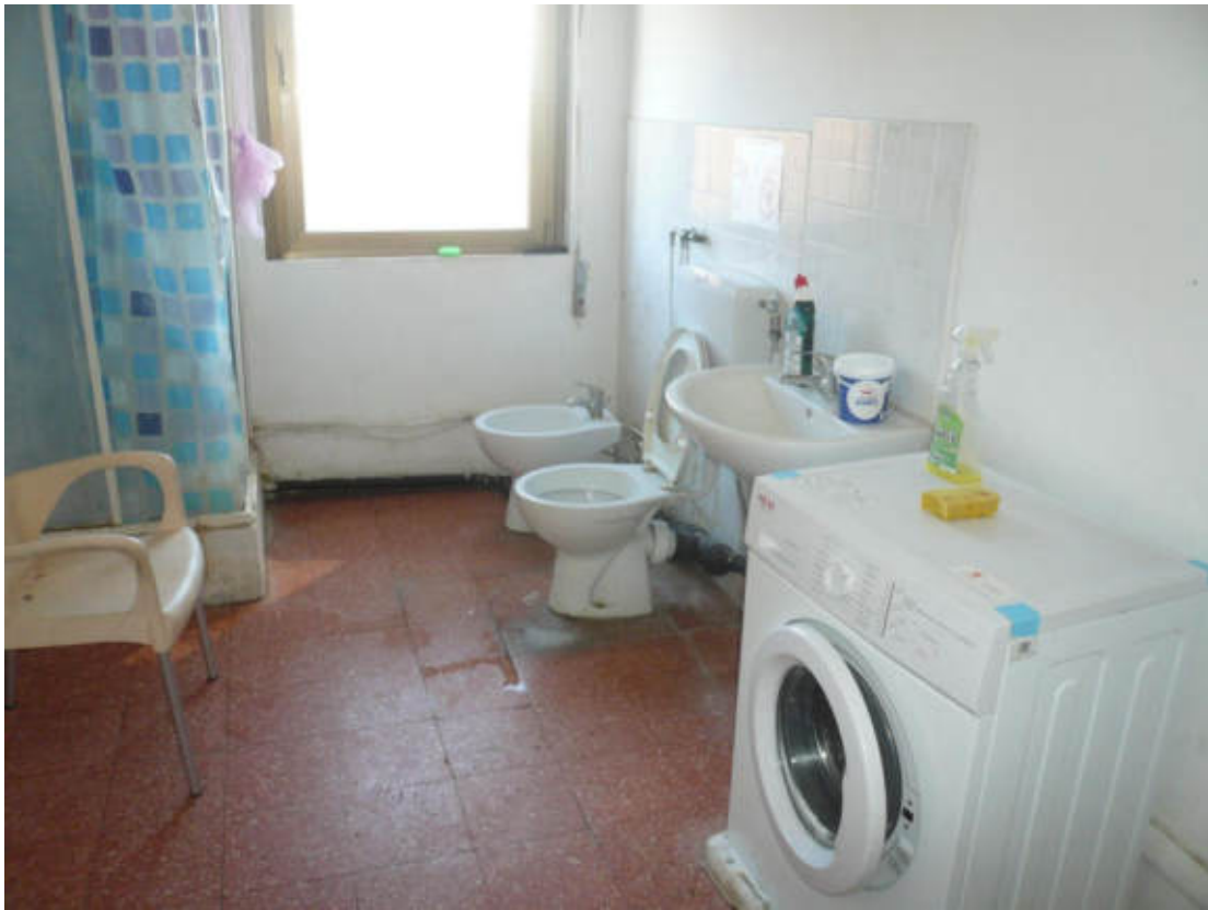
Figura 27 - Vista dei beni oggetto di vendita