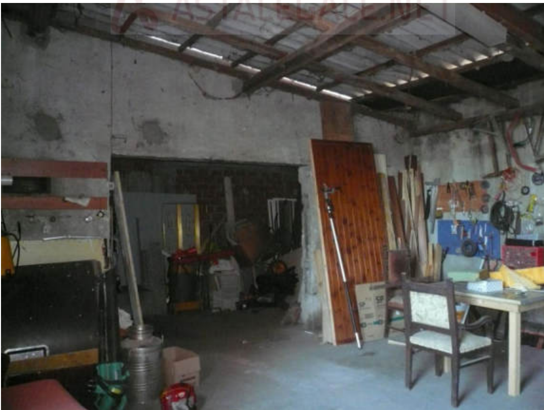
Figura 16 - Vista dei beni oggetto di vendita