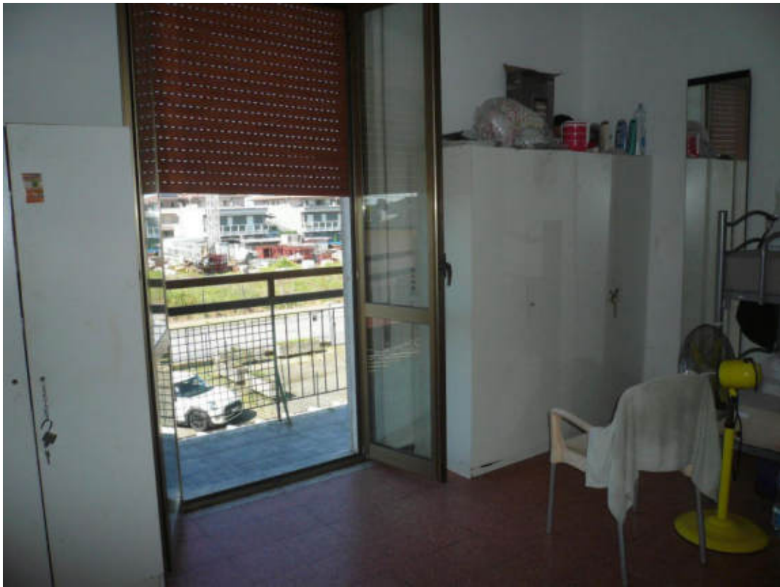
Figura 25 - Vista dei beni oggetto di vendita