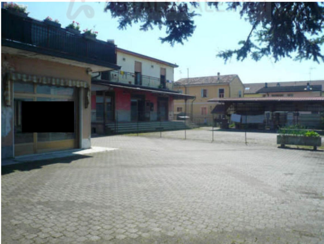
Figura 10 - Vista dei beni oggetto di vendita