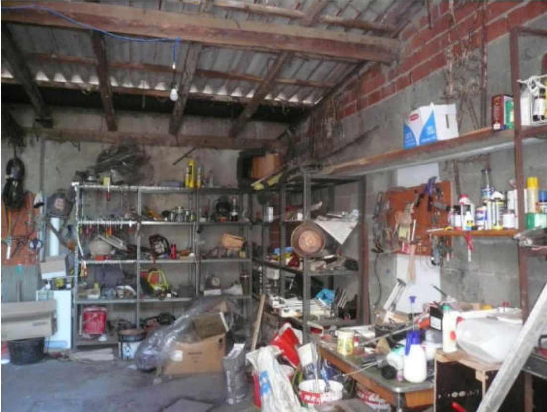
Figura 15 - Vista dei beni oggetto di vendita