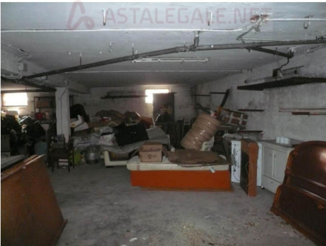
Figura 36 - Vista dei beni oggetto di vendita