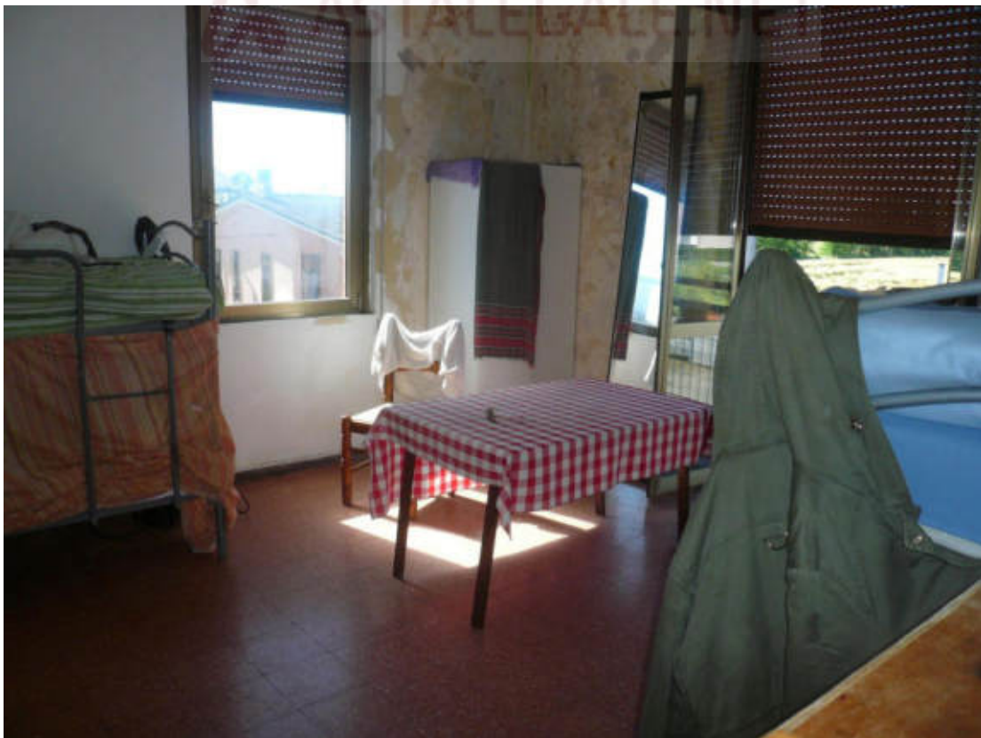
Figura 26 - Vista dei beni oggetto di vendita