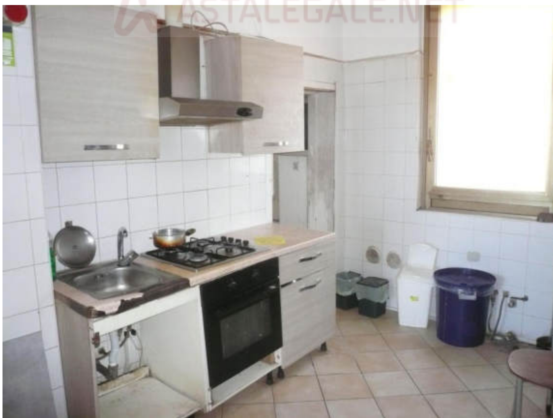
Figura 30 - Vista dei beni oggetto di vendita