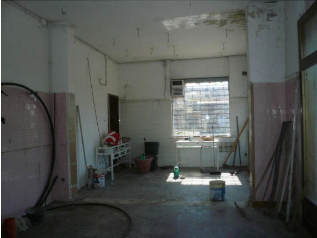
Figura 13 - Vista dei beni oggetto di vendita