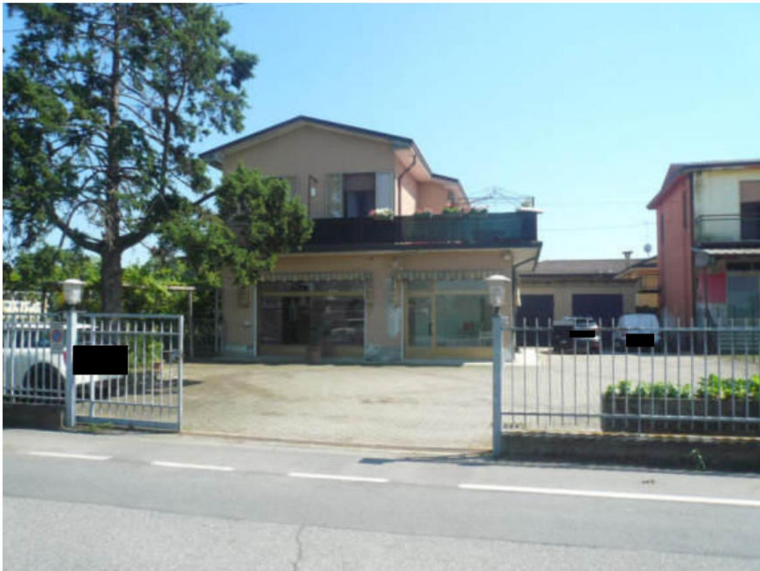
Figura 7 - Vista dei beni oggetto di vendita