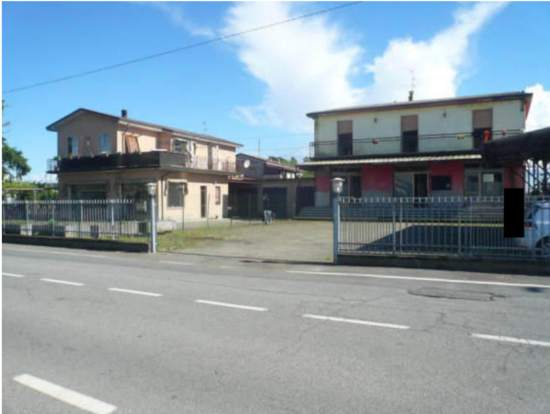
Figura 1 - Vista dei beni oggetto di vendita