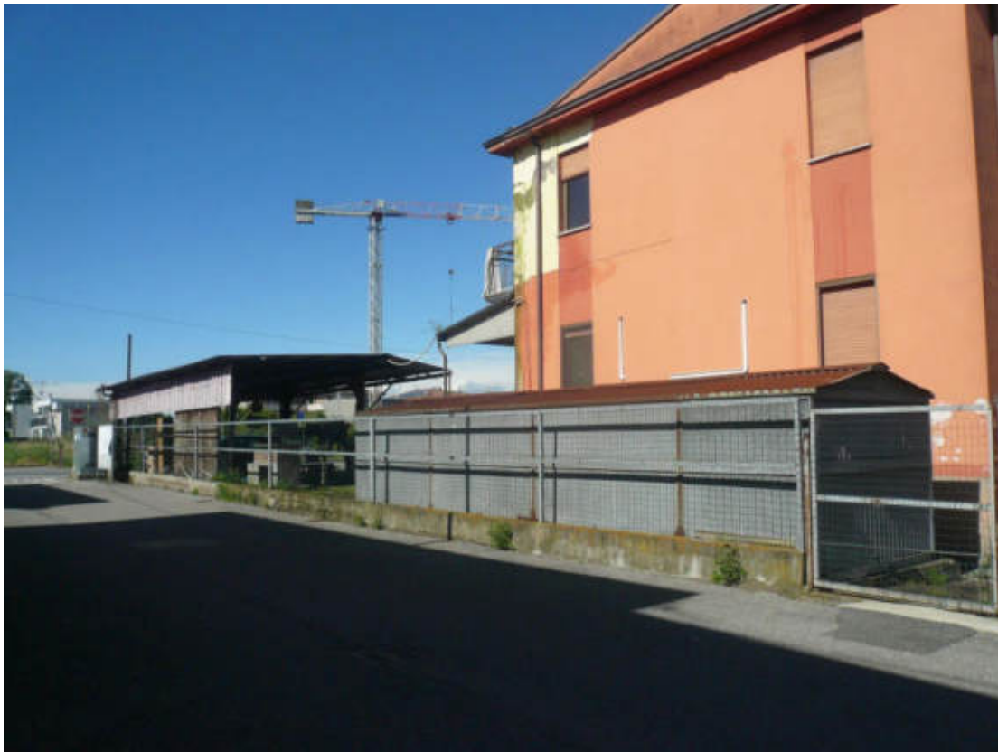
Figura 5 - Vista dei beni oggetto di vendita