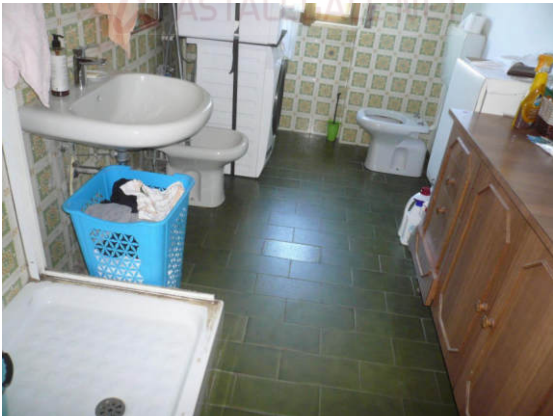
Figura 22 - Vista dei beni oggetto di vendita