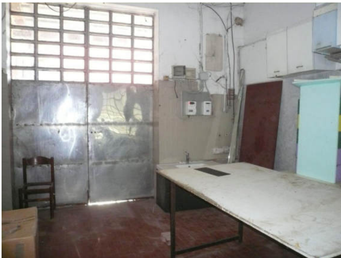
Figura 17 - Vista dei beni oggetto di vendita