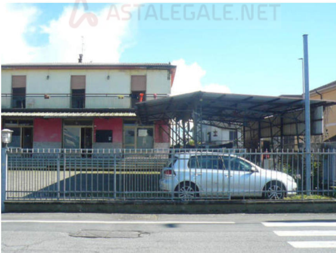
Figura 2 - Vista dei beni oggetto di vendita