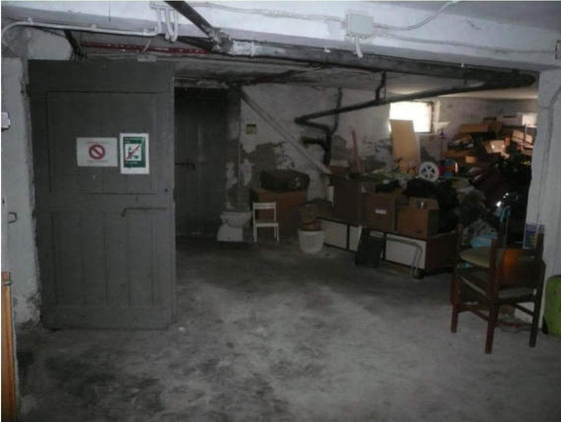
Figura 35 - Vista dei beni oggetto di vendita