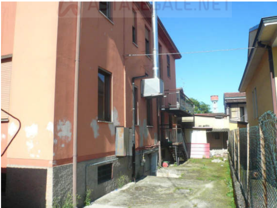
Figura 6 - Vista dei beni oggetto di vendita