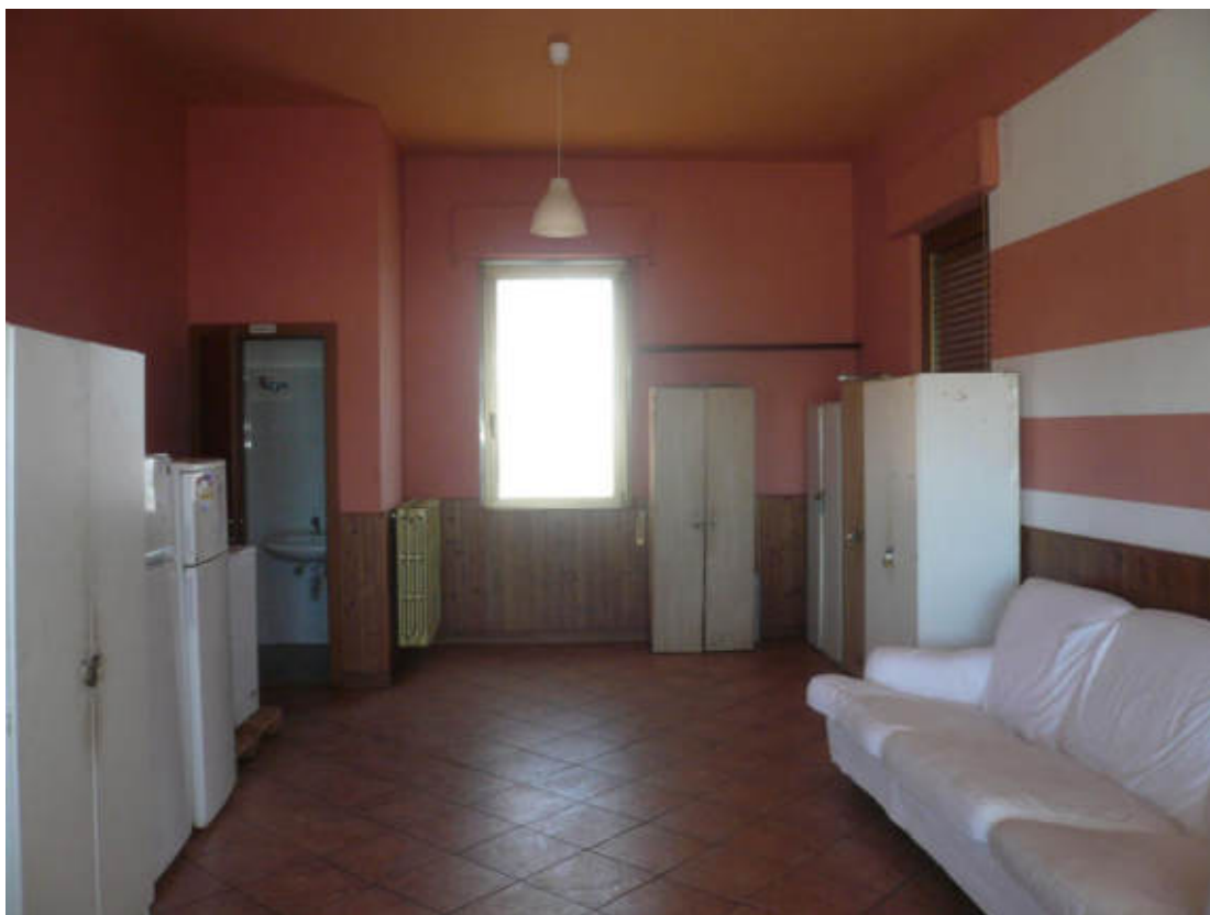
Figura 29 - Vista dei beni oggetto di vendita