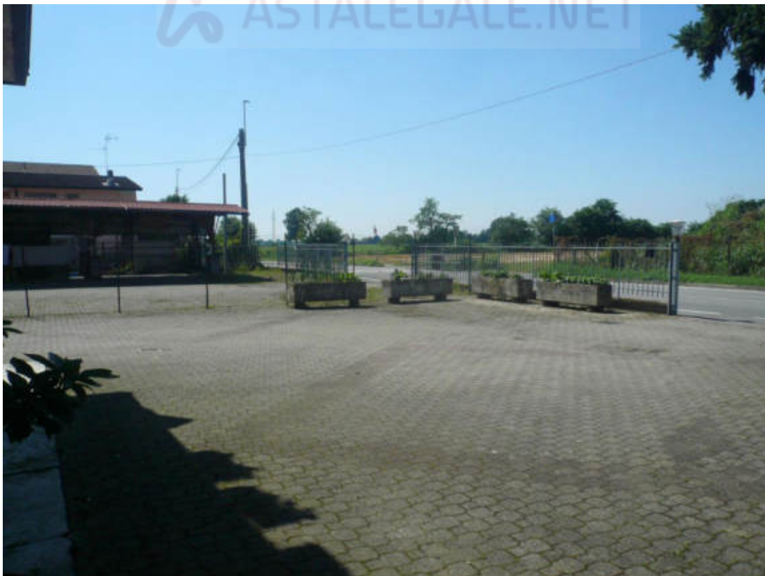
Figura 12 - Vista dei beni oggetto di vendita