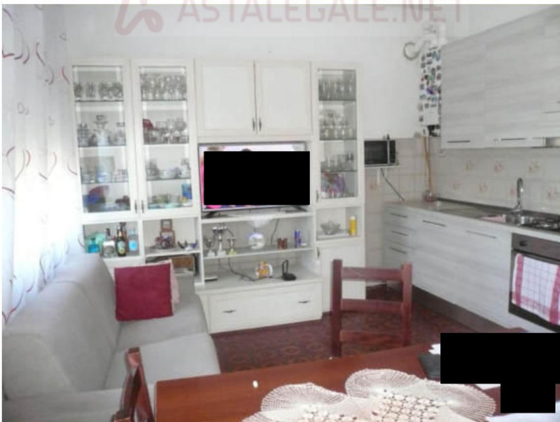
Figura 20 - Vista dei beni oggetto di vendita