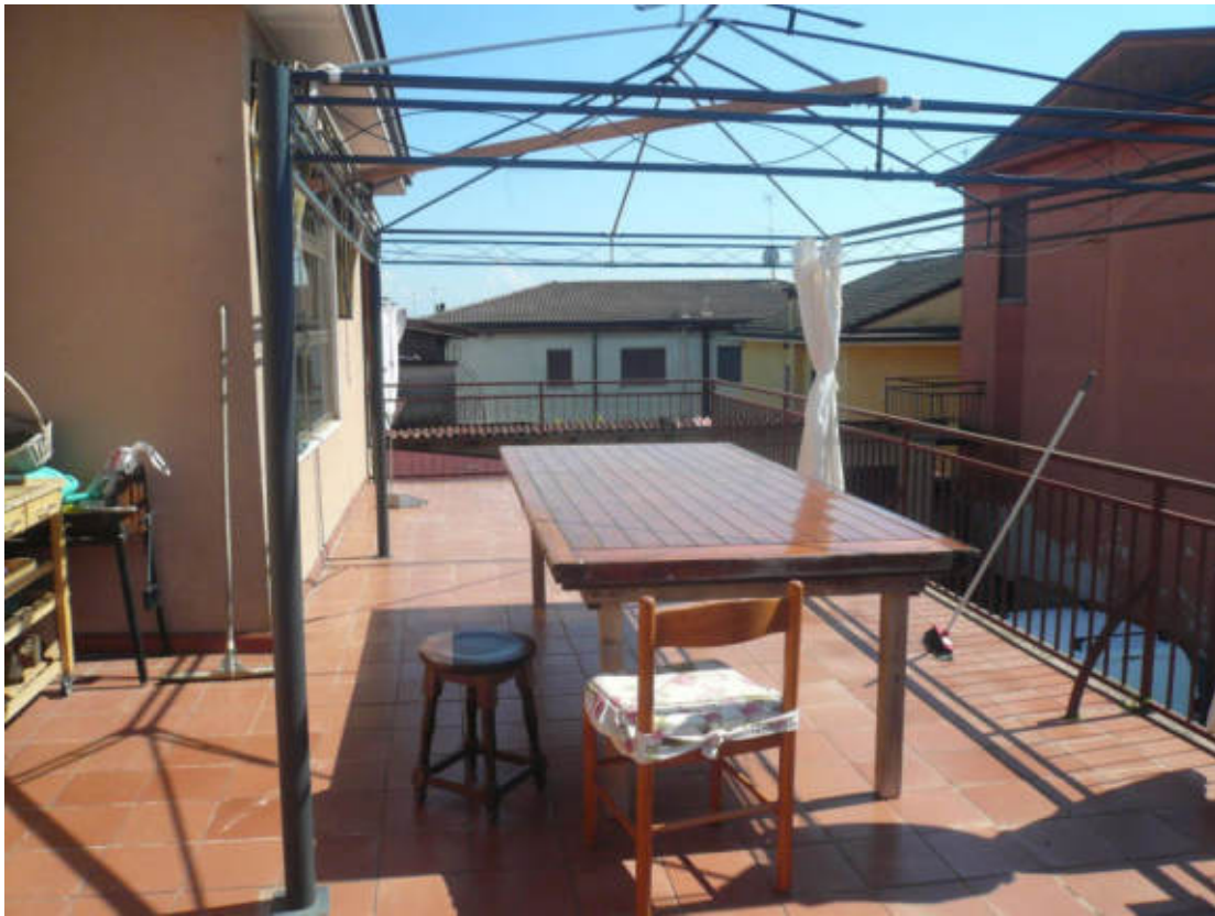
Figura 21 - Vista dei beni oggetto di vendita