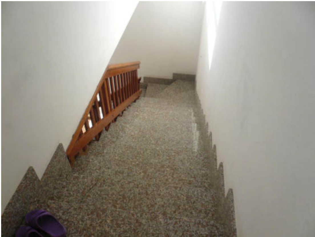
Figura 23 - Vista dei beni oggetto di vendita