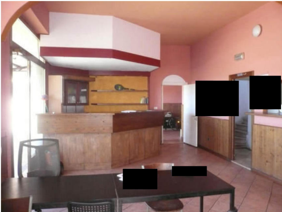
Figura 33 - Vista dei beni oggetto di vendita