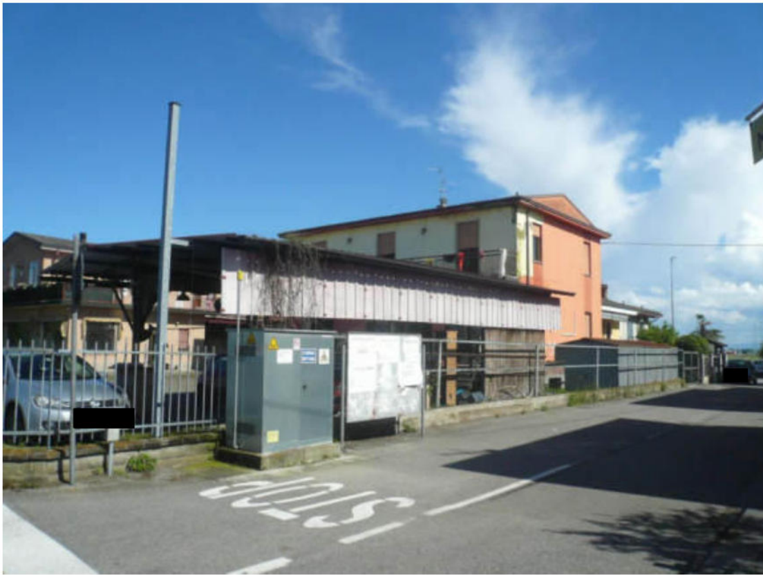
Figura 3 - Vista dei beni oggetto di vendita