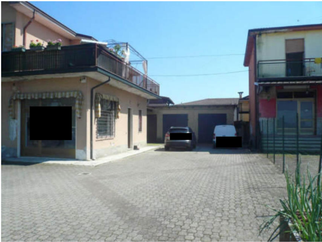
Figura 9 - Vista dei beni oggetto di vendita