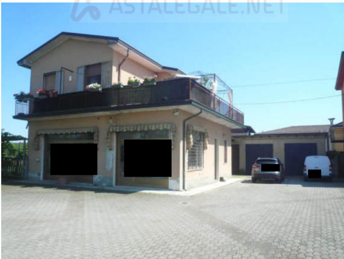
Figura 8 - Vista dei beni oggetto di vendita