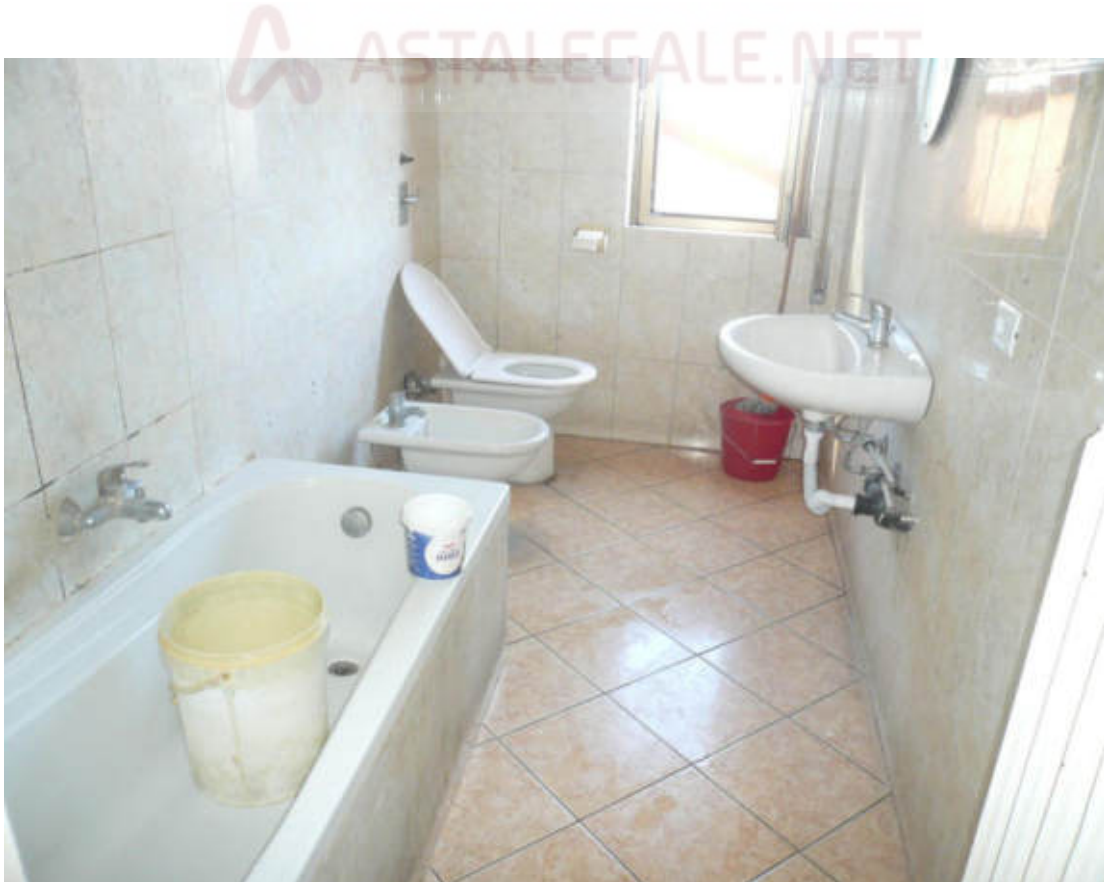
Figura 28 - Vista dei beni oggetto di vendita