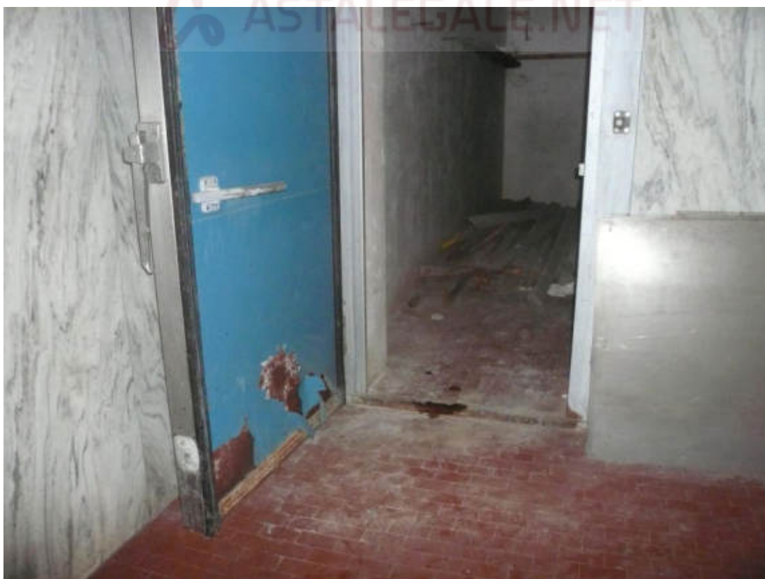
Figura 18 - Vista dei beni oggetto di vendita