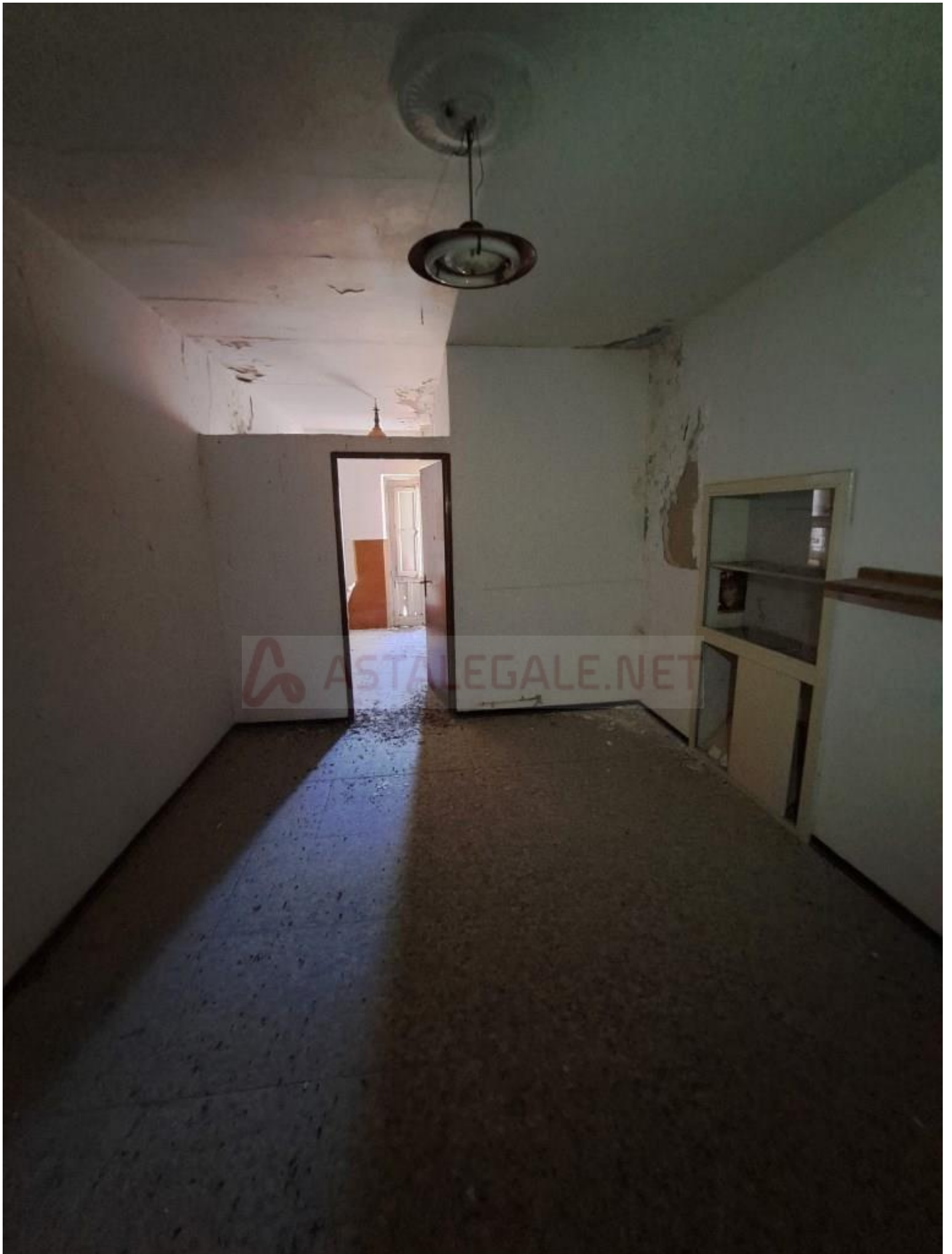
Foto 10 – Interno alloggio (secondo piano), prima stanza (vano cieco)