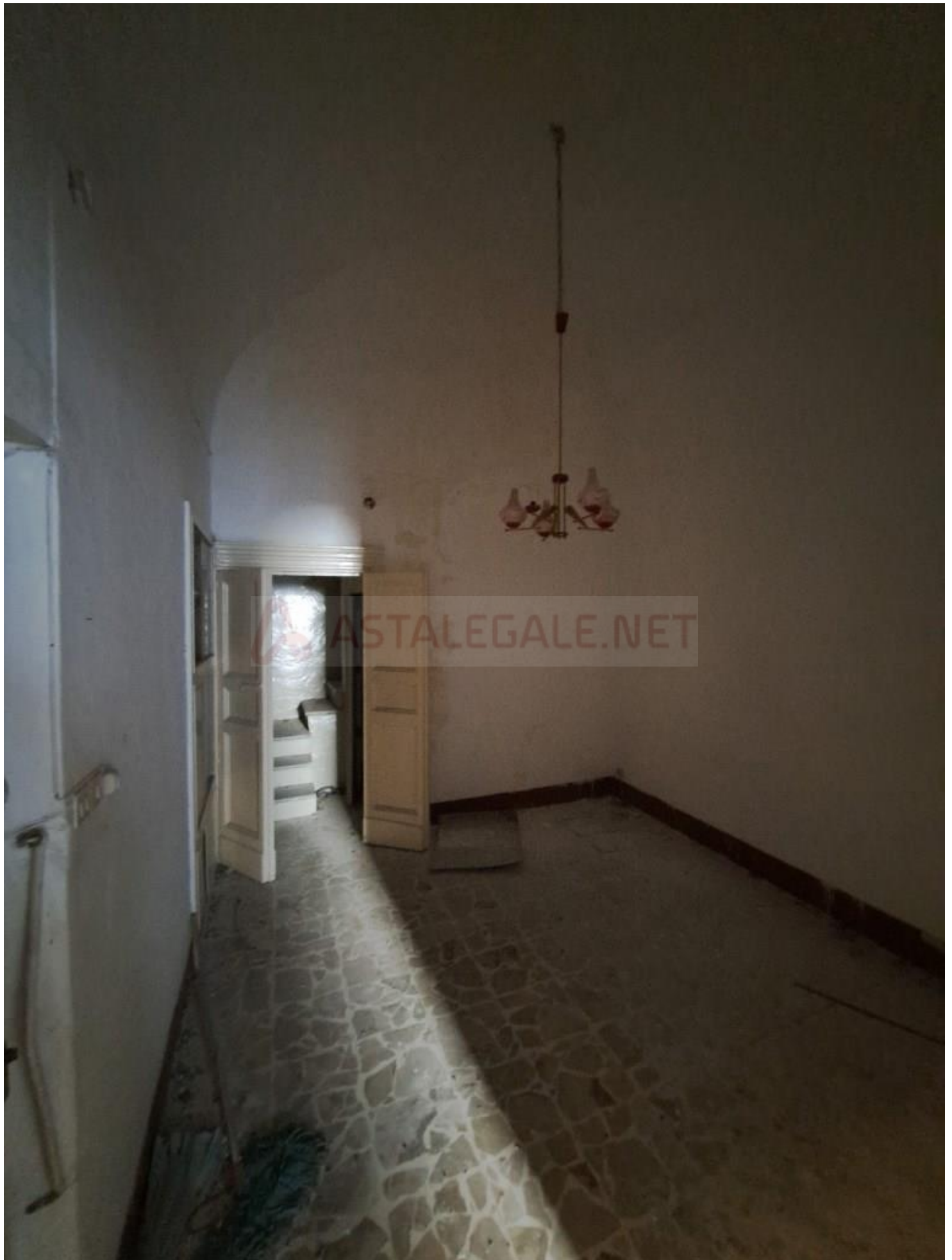
Foto 6 – Interno alloggio (primo piano), vano d'ingresso (privo di aperture esterne)