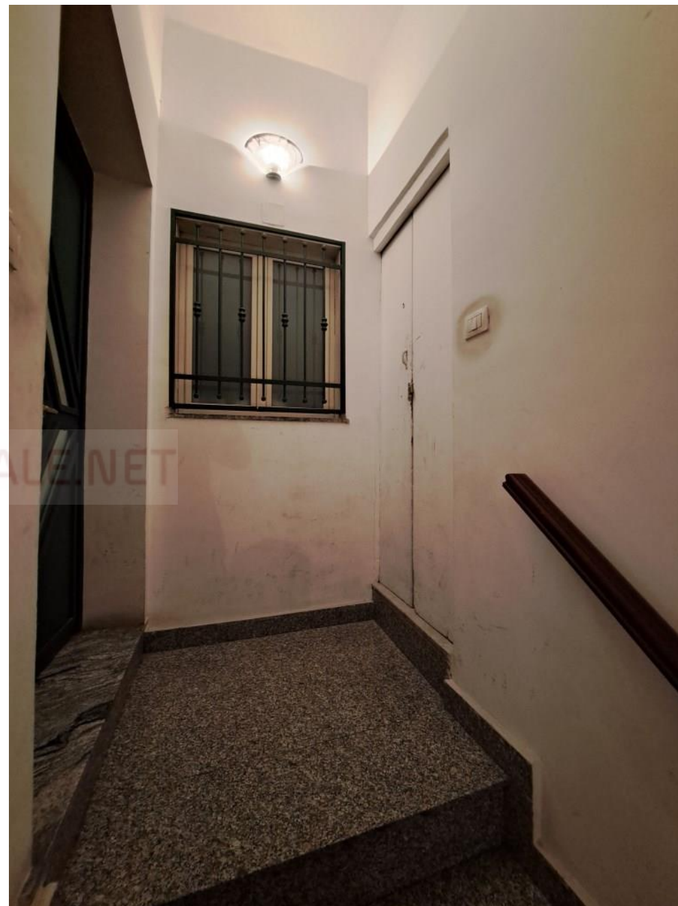
Foto 4 – pianerottolo e ingressi degli alloggi (a destra quello pignorato)