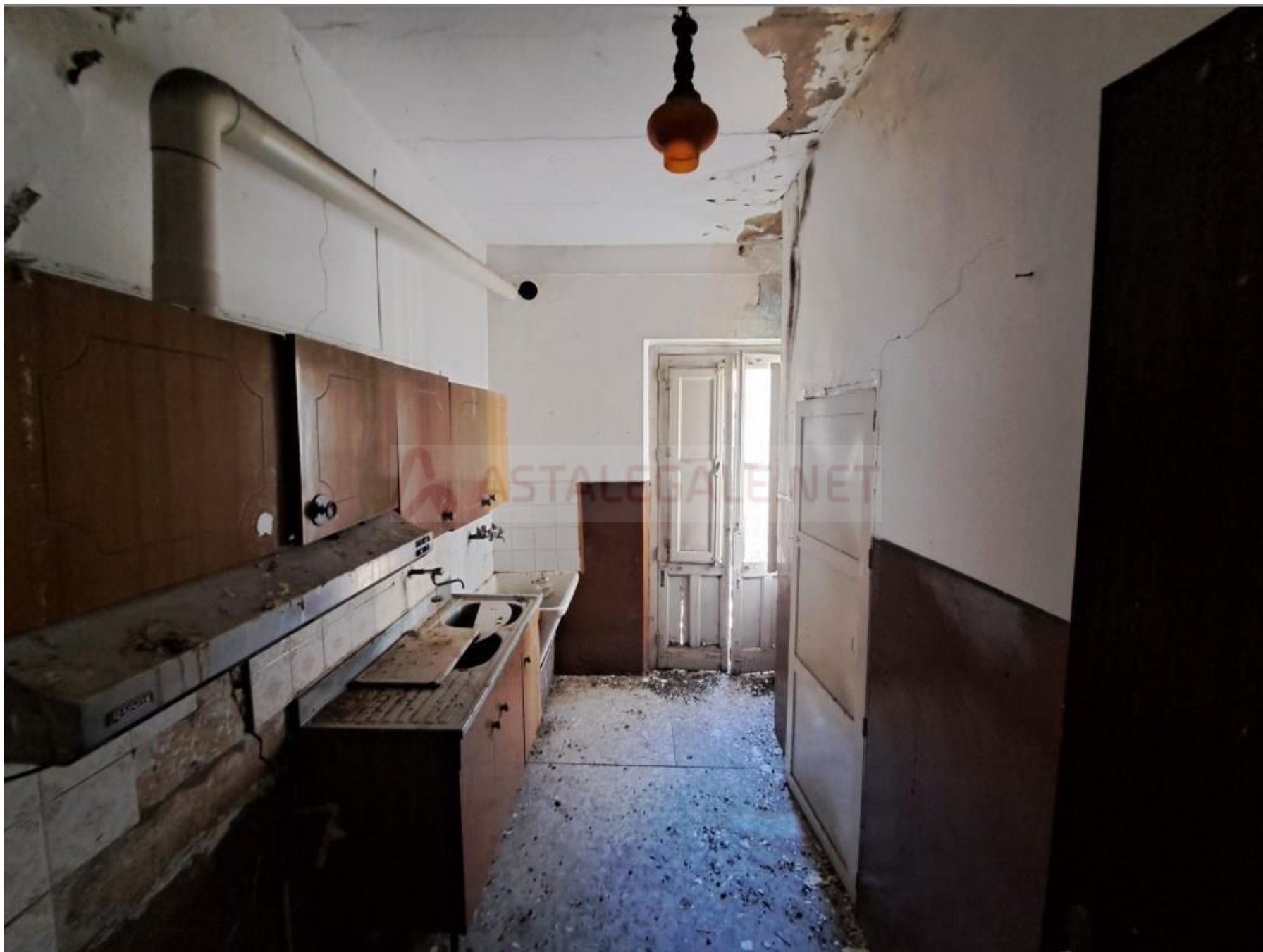
Foto 11 – Interno alloggio (secondo piano), seconda stanza (cucina)