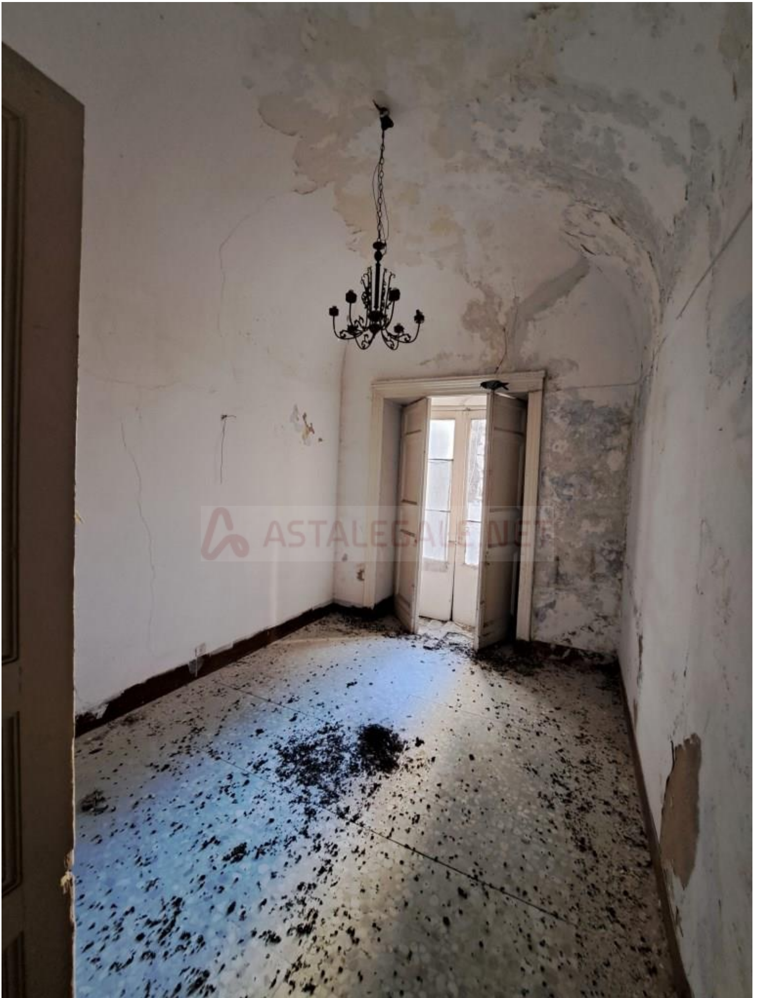
Foto 5 – Interno alloggio (primo piano), vano prospiciente su via Ricasoli