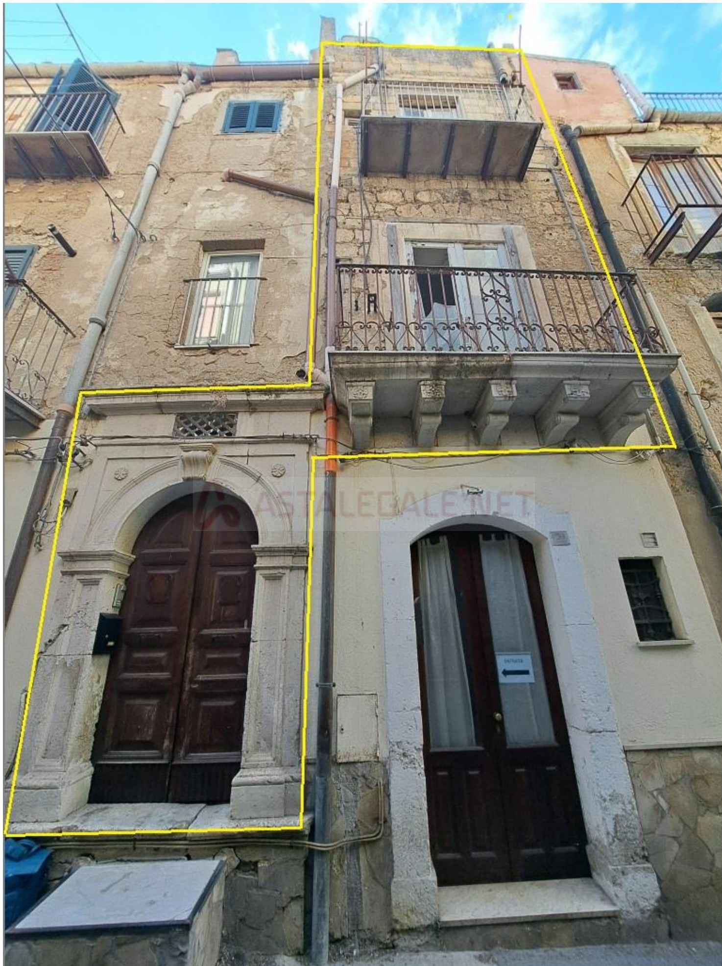
Foto 2 – Prospetto su via Ricasoli dell’immobile pignorato (evidenziato in giallo)