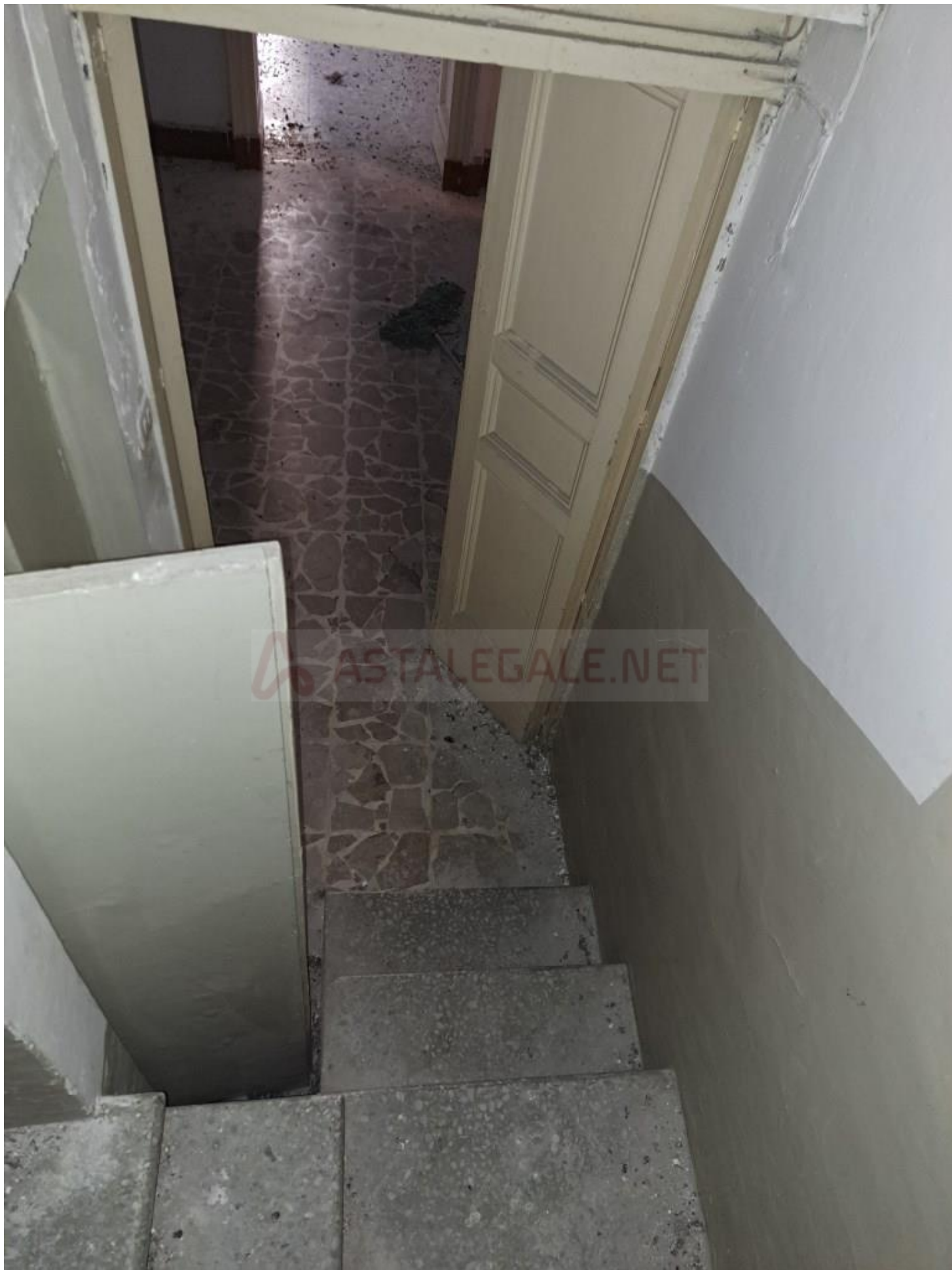
Foto 8 – Interno alloggio (primo piano), porta del ripostiglio e ingresso vano scala interno