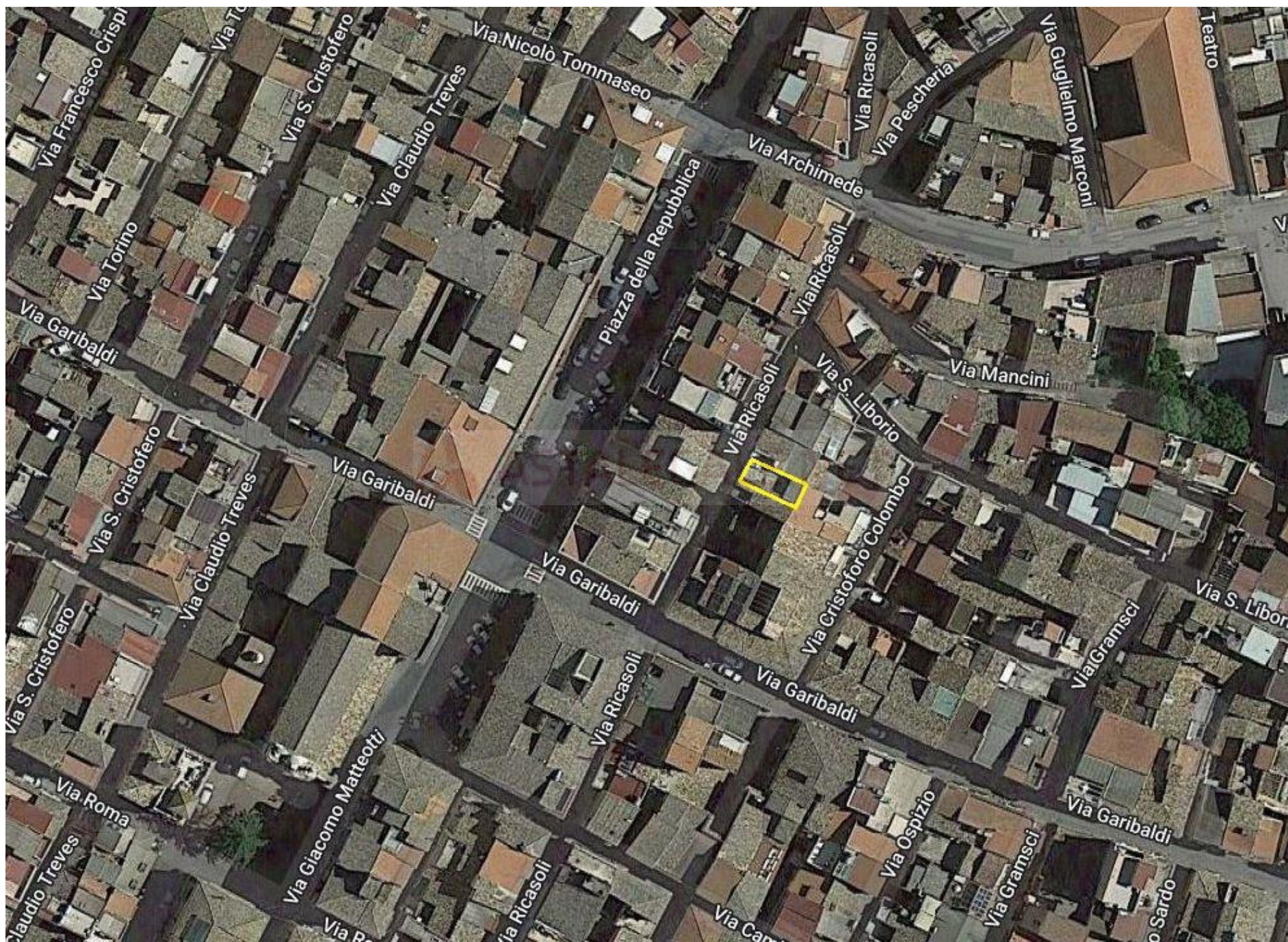
Foto 1 – foto aerea della zona in cui ricade l'immobile pignorato (evidenziato in giallo)