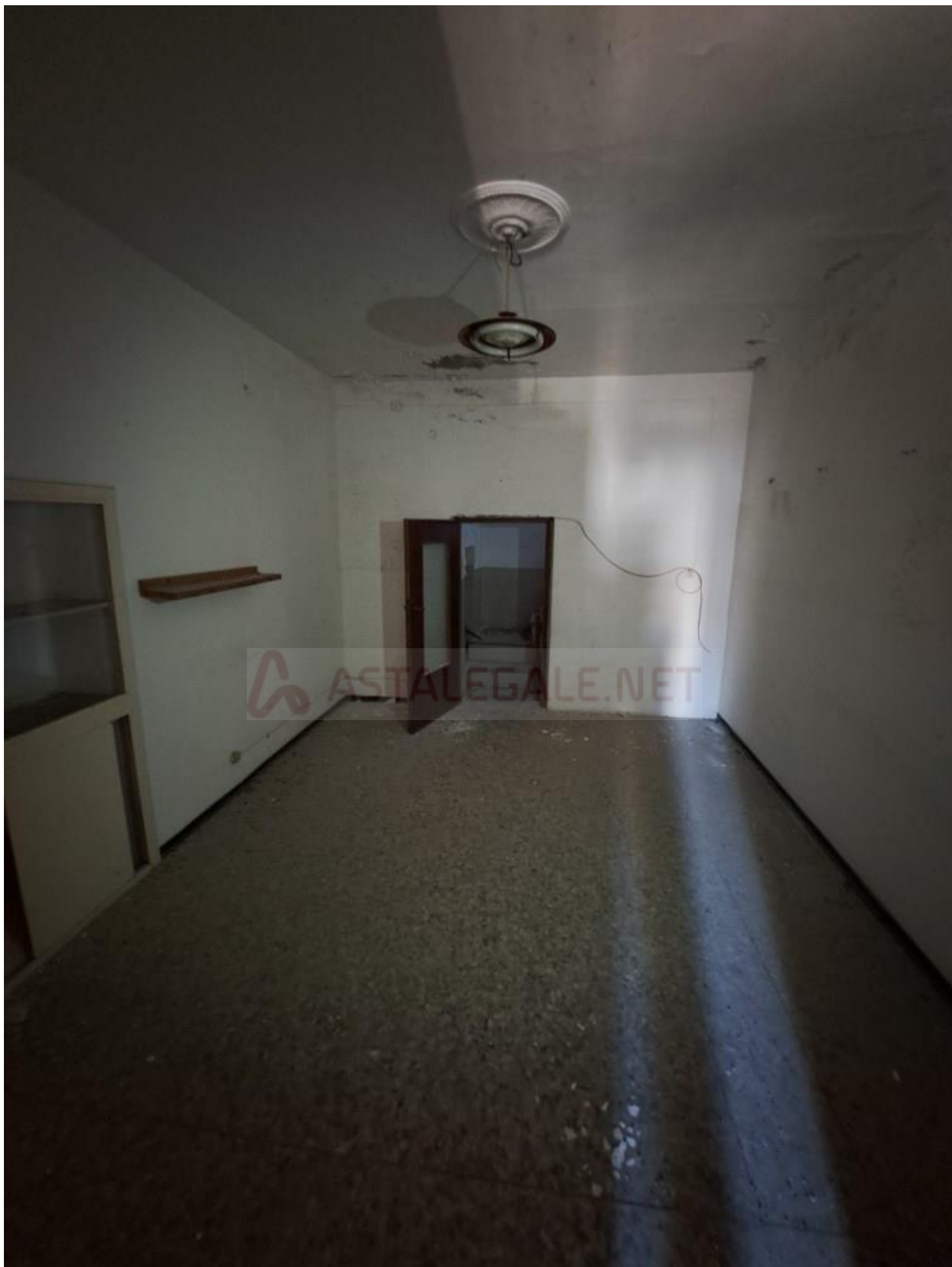
Foto 9 – Interno alloggio (secondo piano), prima stanza (vano cieco)