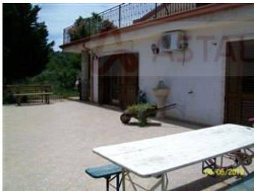
Foto n° 1 – Villa in Spezzano Albanese: terrazzo e prospetto est, piano rialzato.