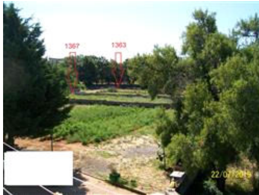
Foto n° 1 - Particelle 1363 e 1367 osservate dalla particella 1348.

Presenta una forma vagamente trapezoidale, un'orografia pianeggiante ed una tessitura prevalente mista.