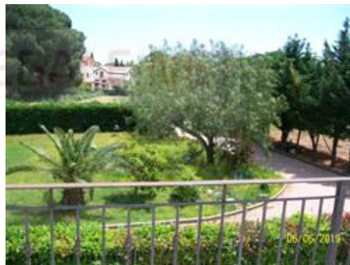
Foto n° 2 – Villa in Spezzano Albanese: ingresso e giardino sul lato est.