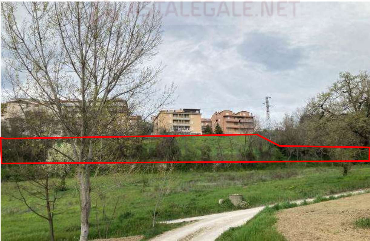
6. Vista da sud