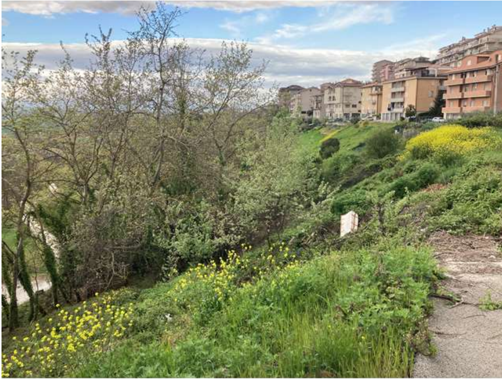
11. Vista da Nord-Est