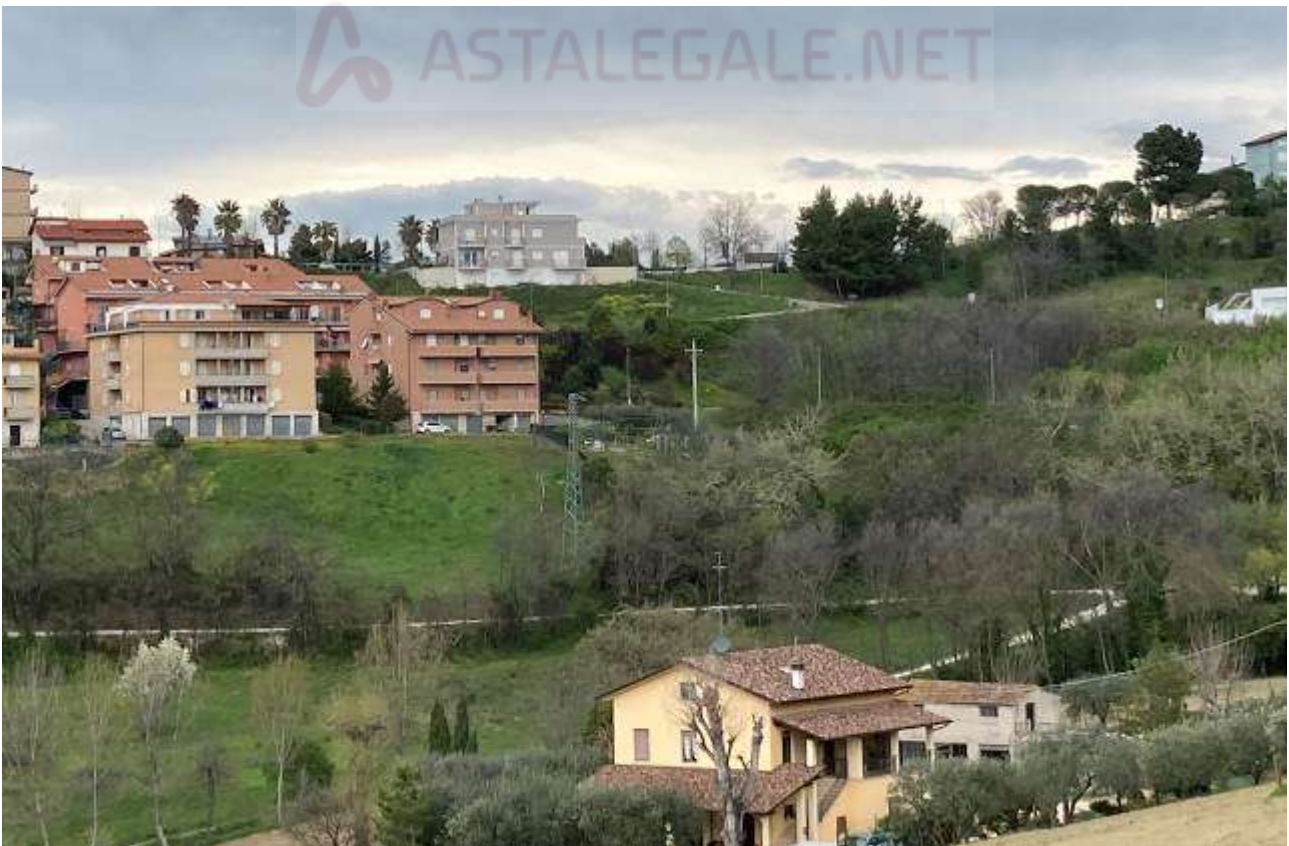
8. Vista da sud