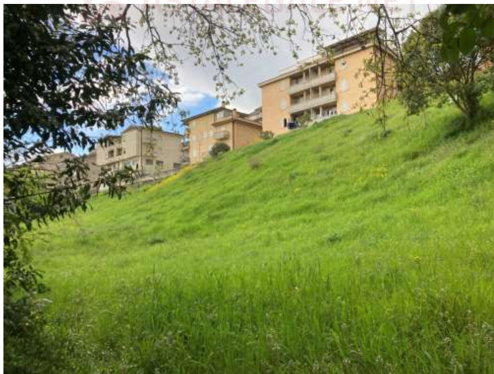
10. Vista da valle in corrispondenza dell’accesso