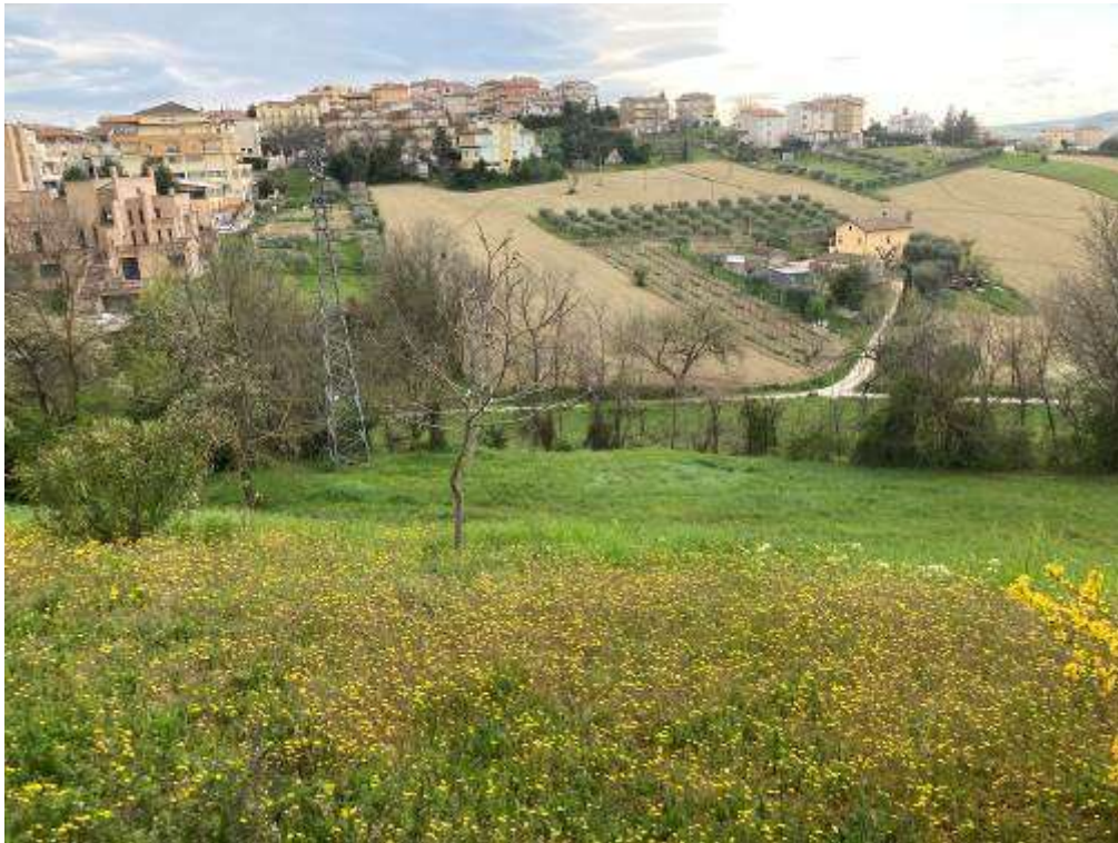
15. Vista da Monte