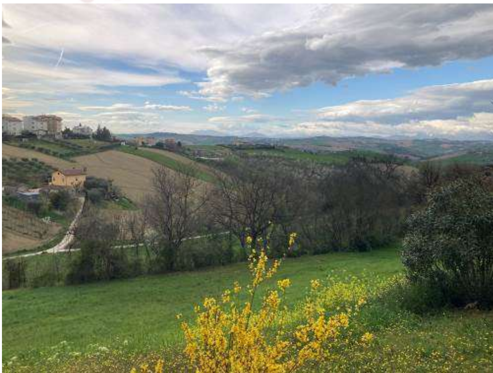
16. Vista da Monte