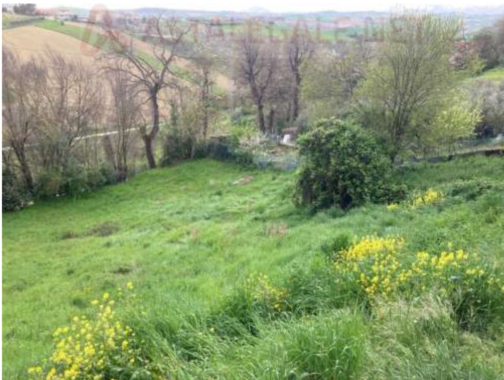
14. Vista da Monte