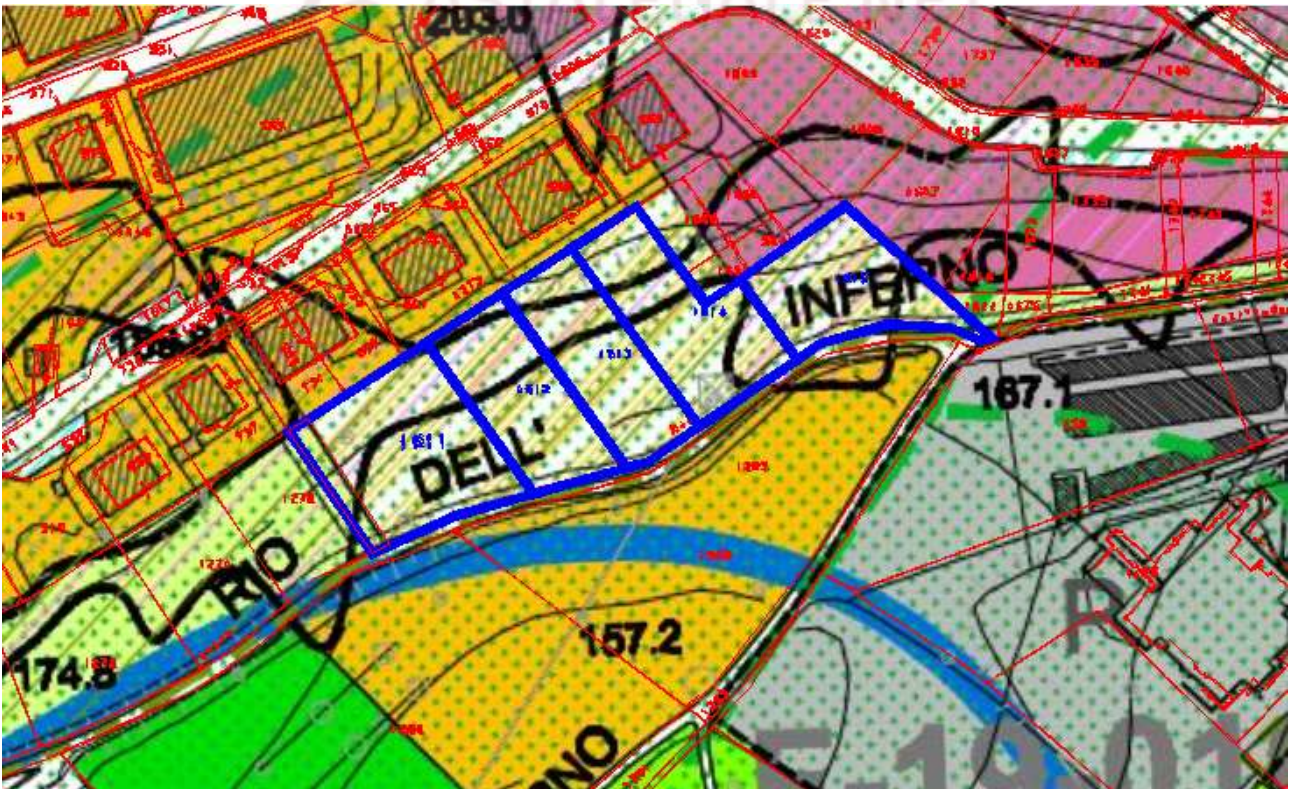
4. Sovrapposizione PRG/Catastale