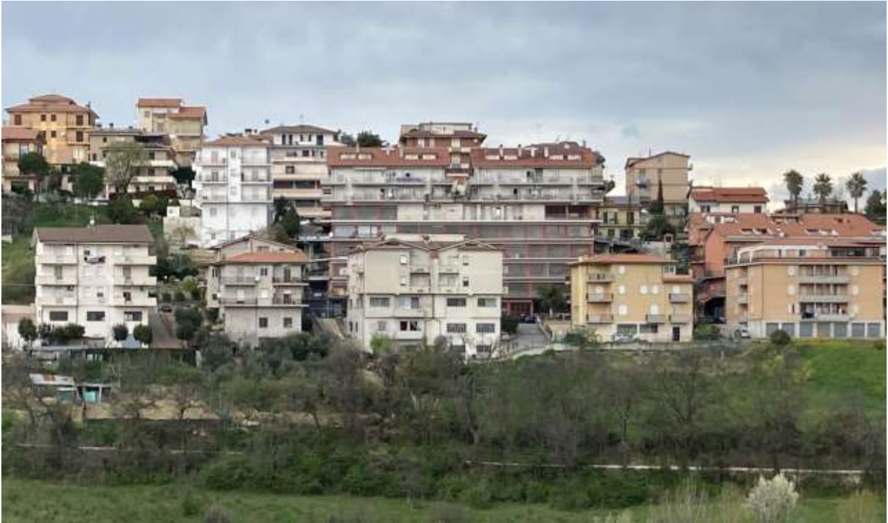
7. Vista da sud