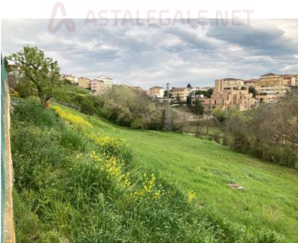
12. Vista da Monte