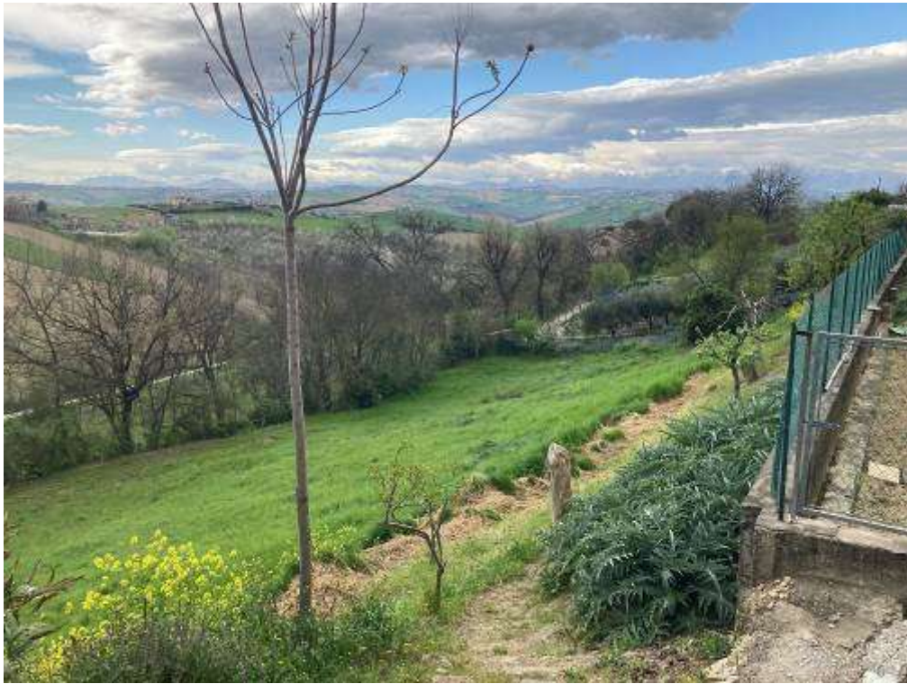
17. Vista da Monte