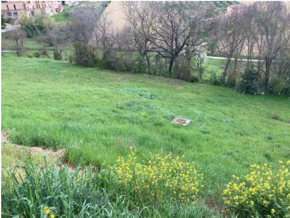
13. Vista da Monte