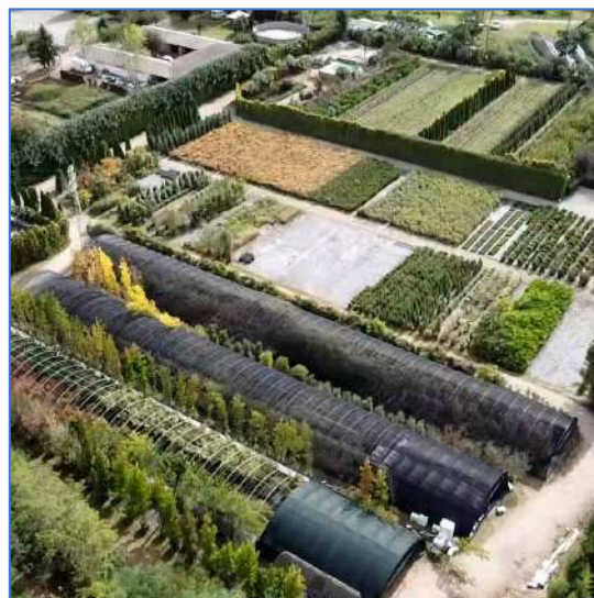
Img. 4 - 5 _ Vista area