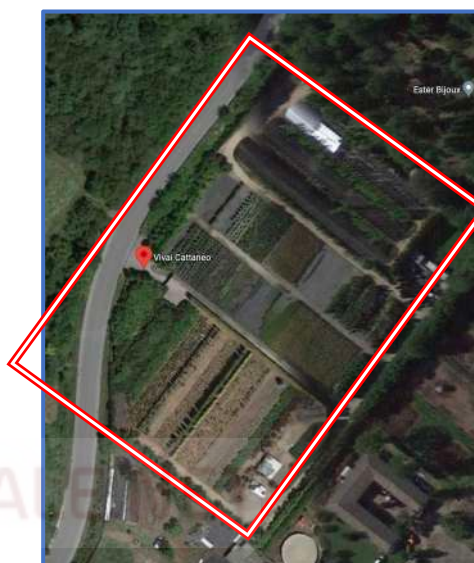
Img. 2 - 3_ Individuazione tramite l'ausilio di Google earth