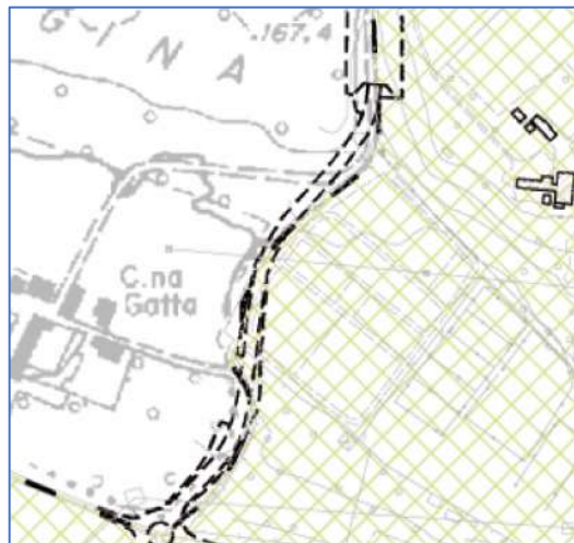
Tavola DP02 _ Carta delle Previsioni di Piano e individuazione degli ambiti di trasformazione "