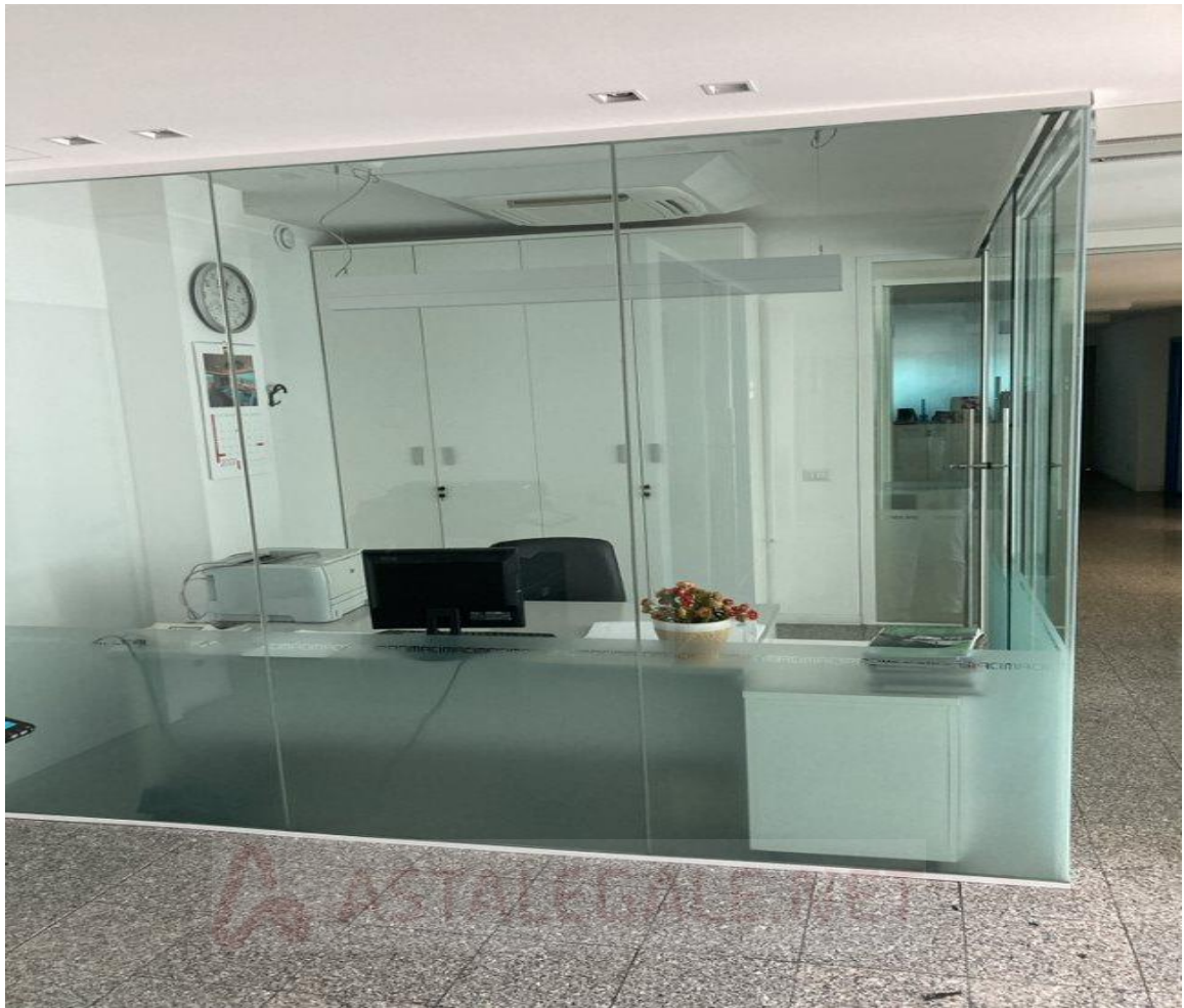
7) 3° UFFICIO SULLA SINISTRA