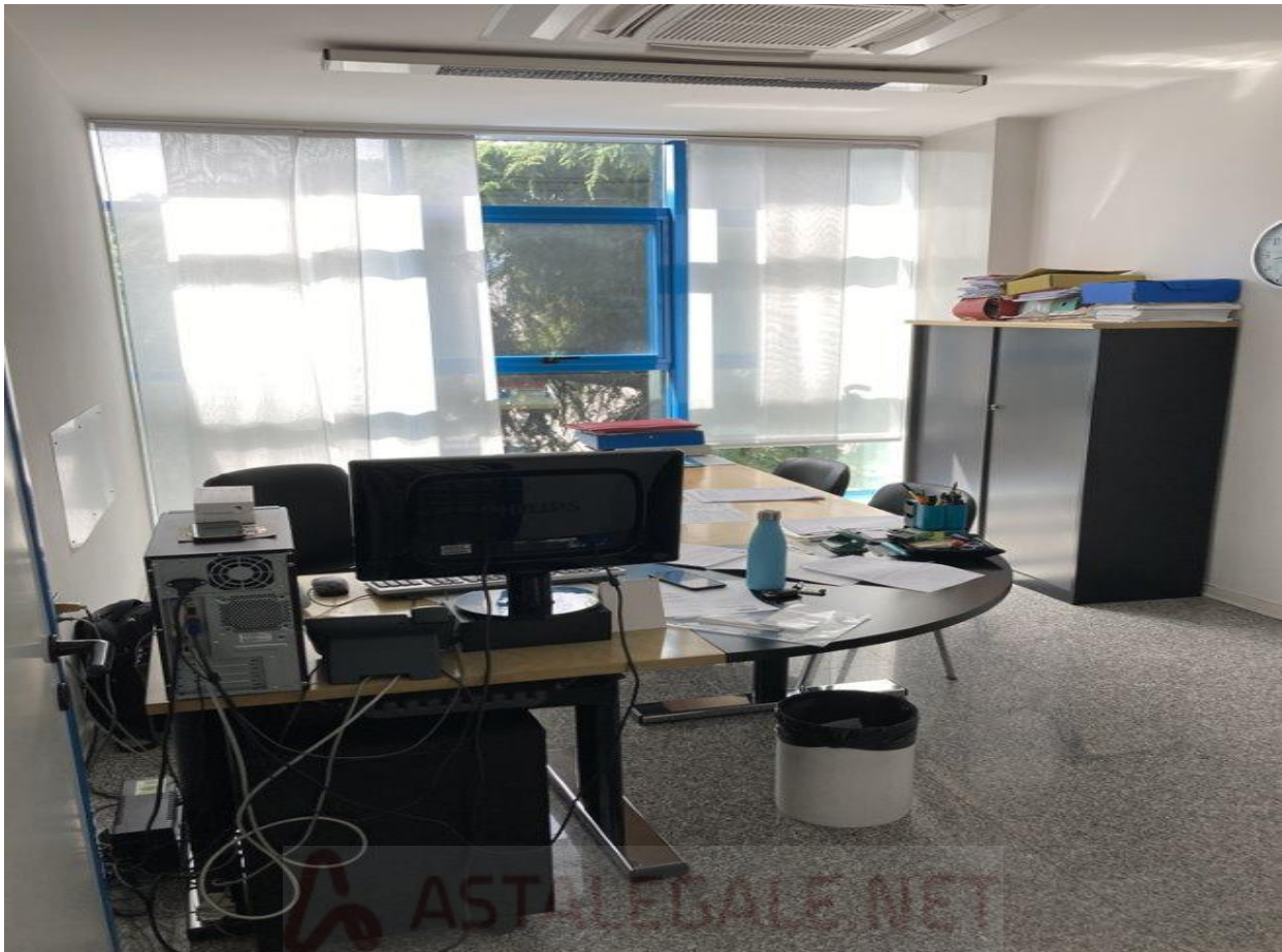
16) 2° UFFICIO SULLA DESTRA