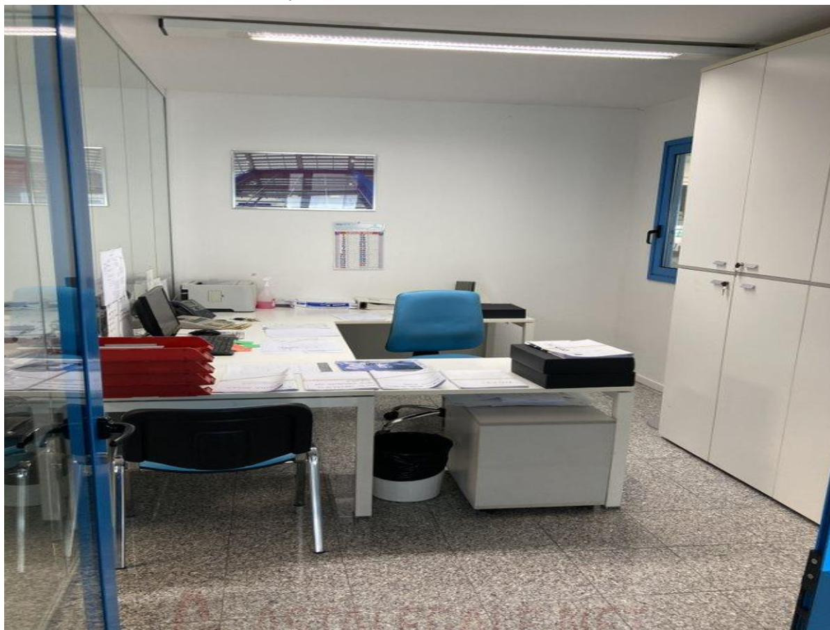
29) 3 POSTAZIONI ALLA SINISTRA DELL'AREA OPENSOURCE