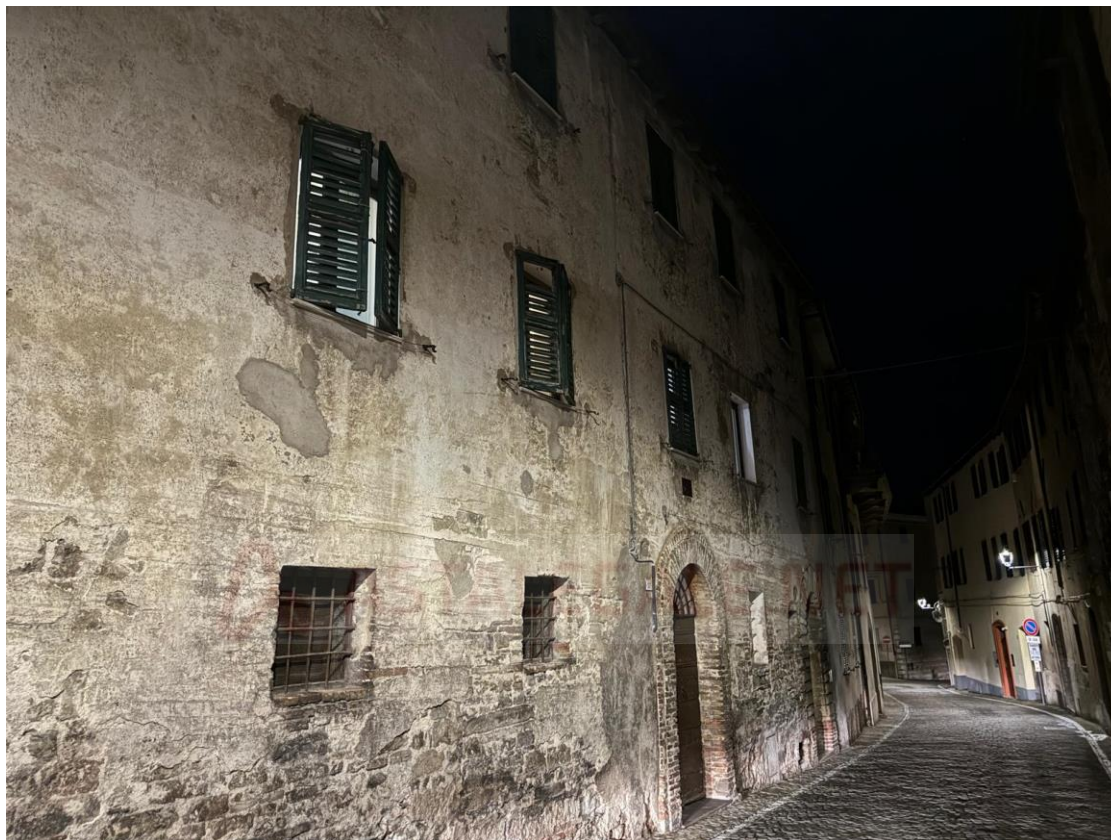
Facciata su Via E. Ramazzani