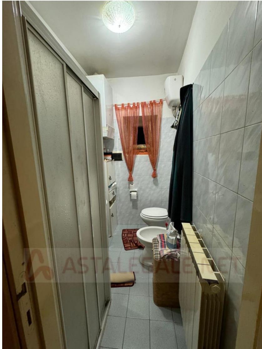
Apt. P.1° - Bagno