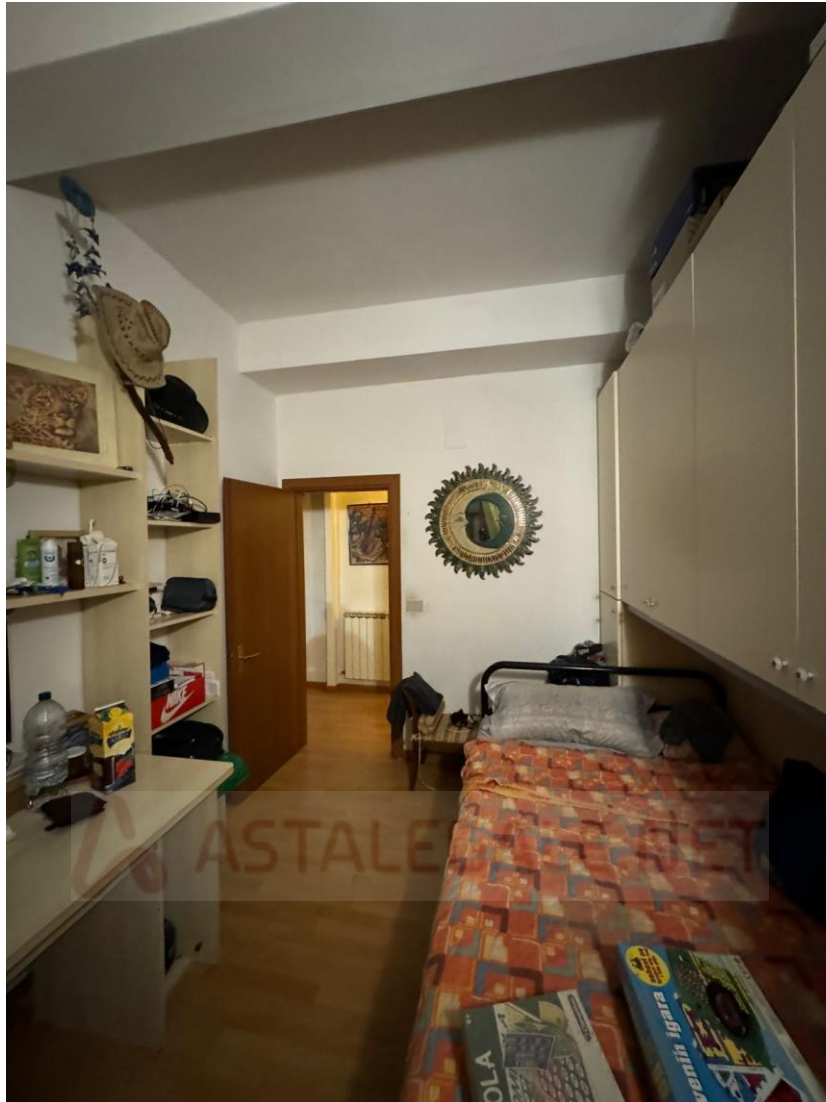
Apt. P.1° - Camera 1