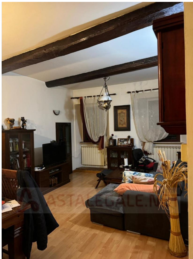
Apt. P1° - Soggiorno