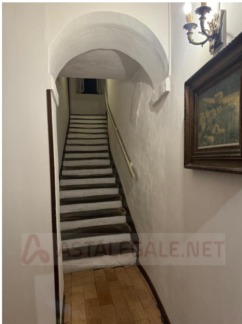
Scala di ingresso