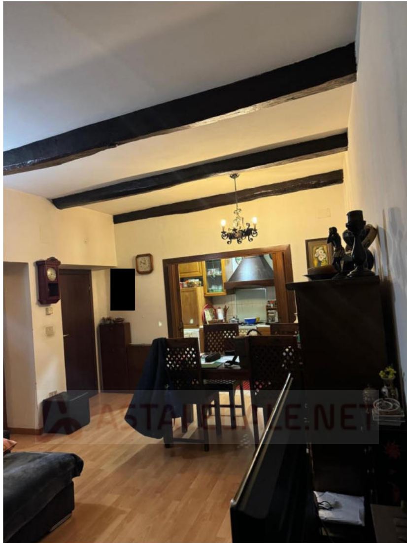
Apt. P.1° - Soggiorno e angolo cottura