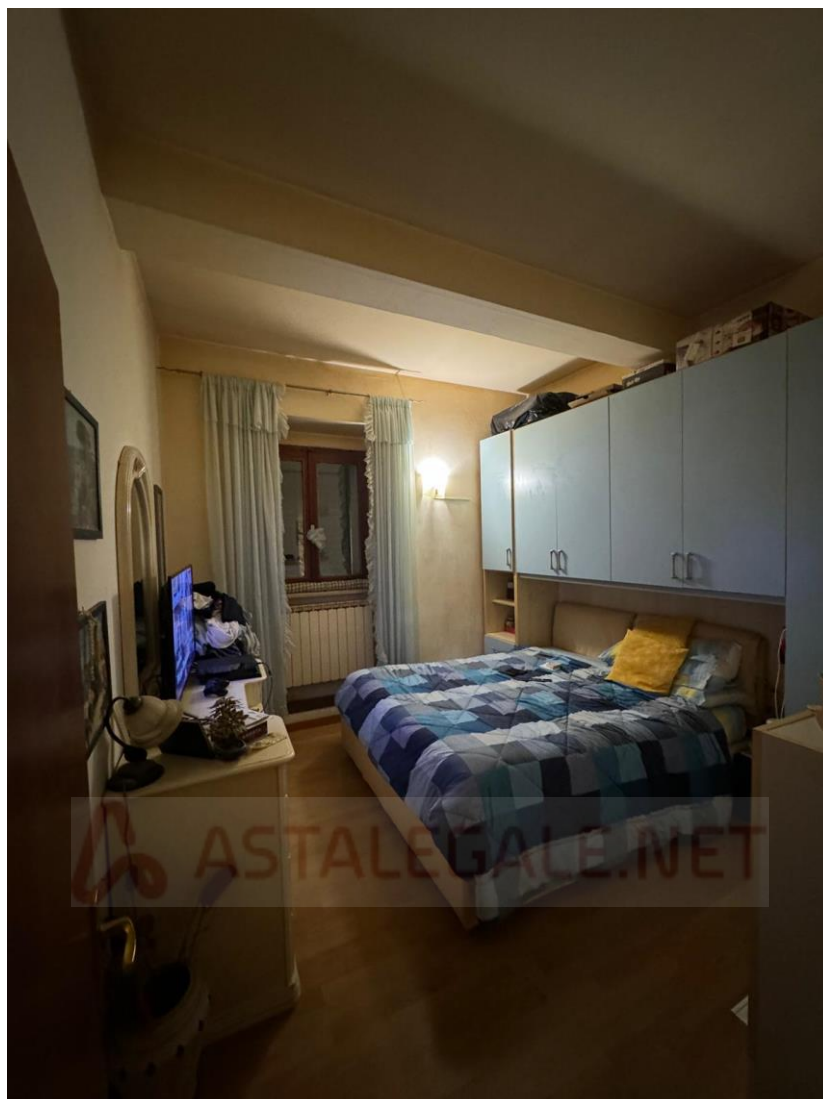
Apt. P.1° - Camera 2