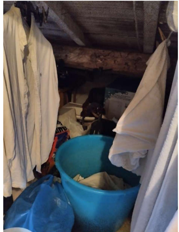
Soffitta 2 con lucernario