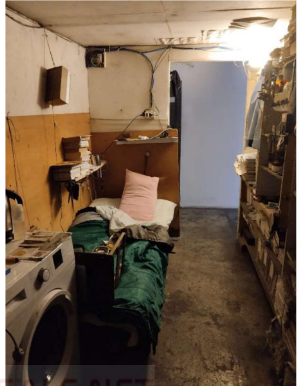
Soffitta 1 finestrata