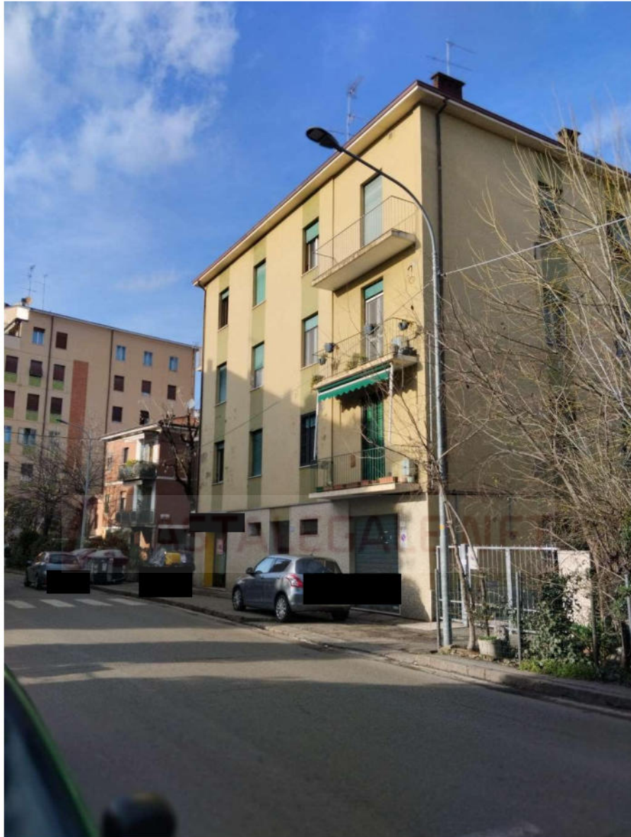
ESTERNO Via Carlo Sigonio, 191