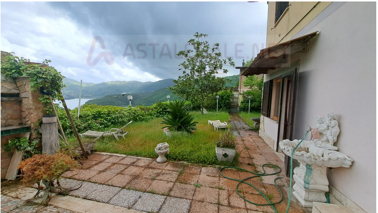
Vedute esterne del fabbricato