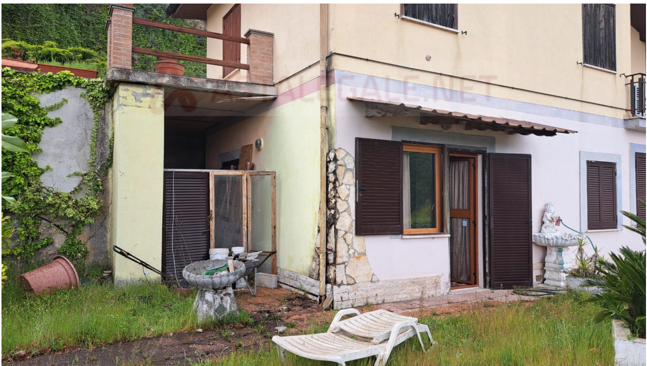
Vedute esterne del fabbricato