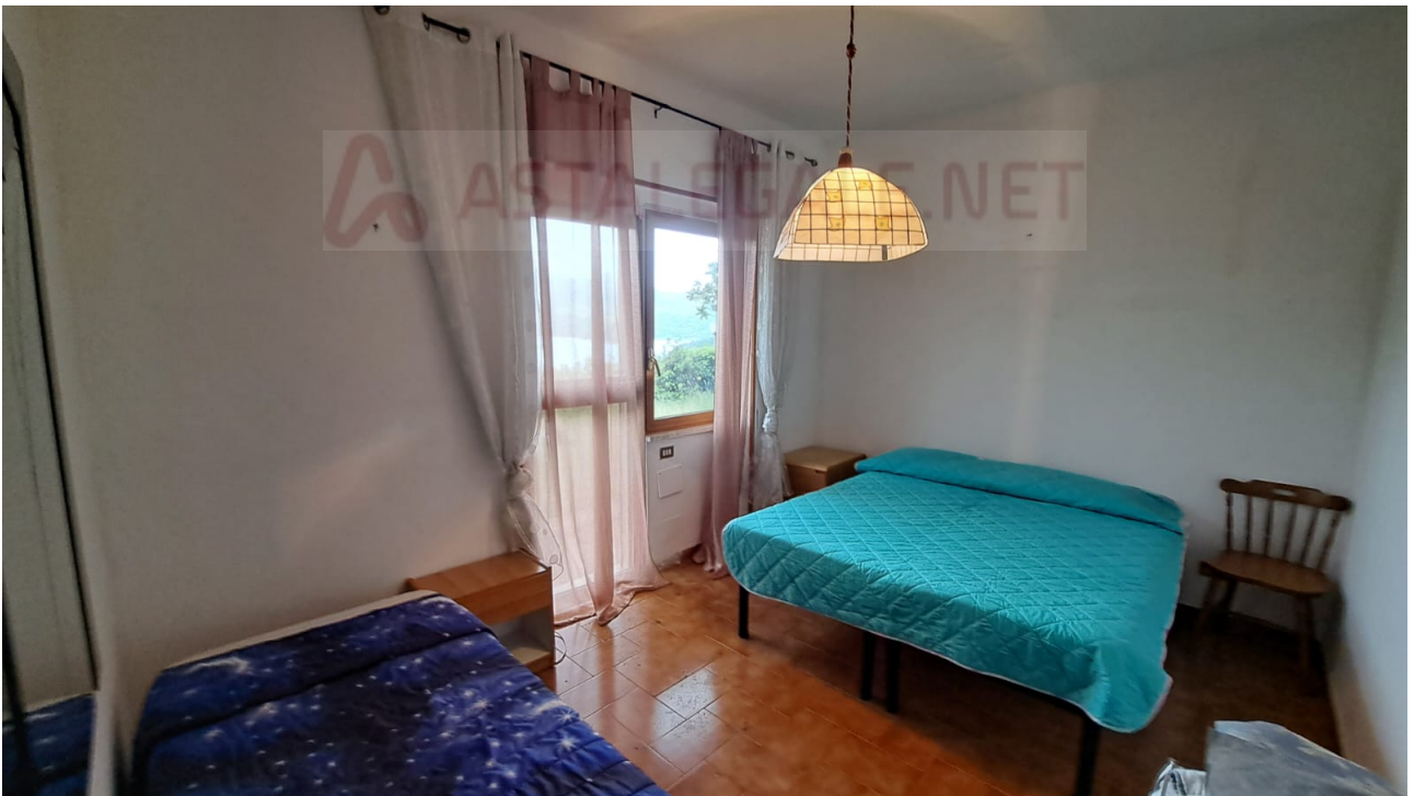
Vedute interne – camera e soggiorno