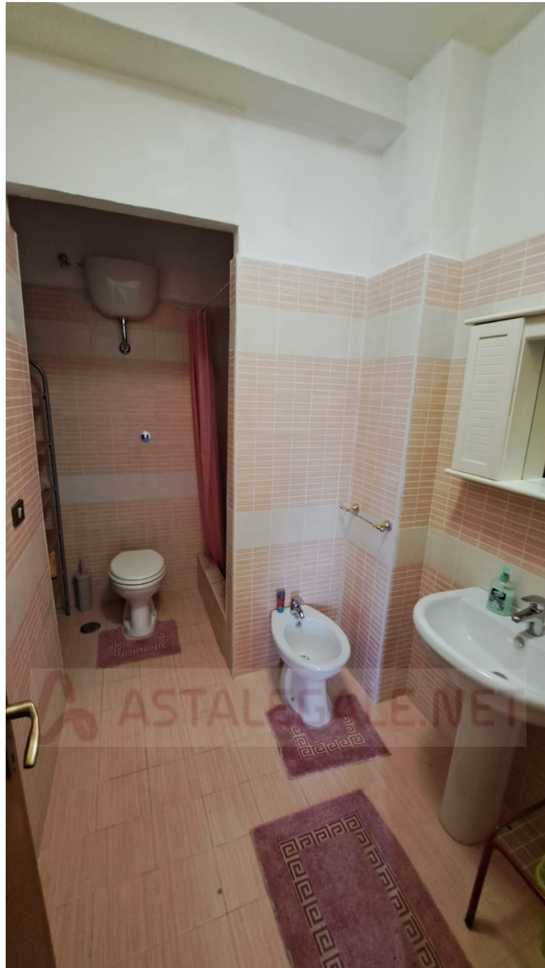
Vedute interne – bagno