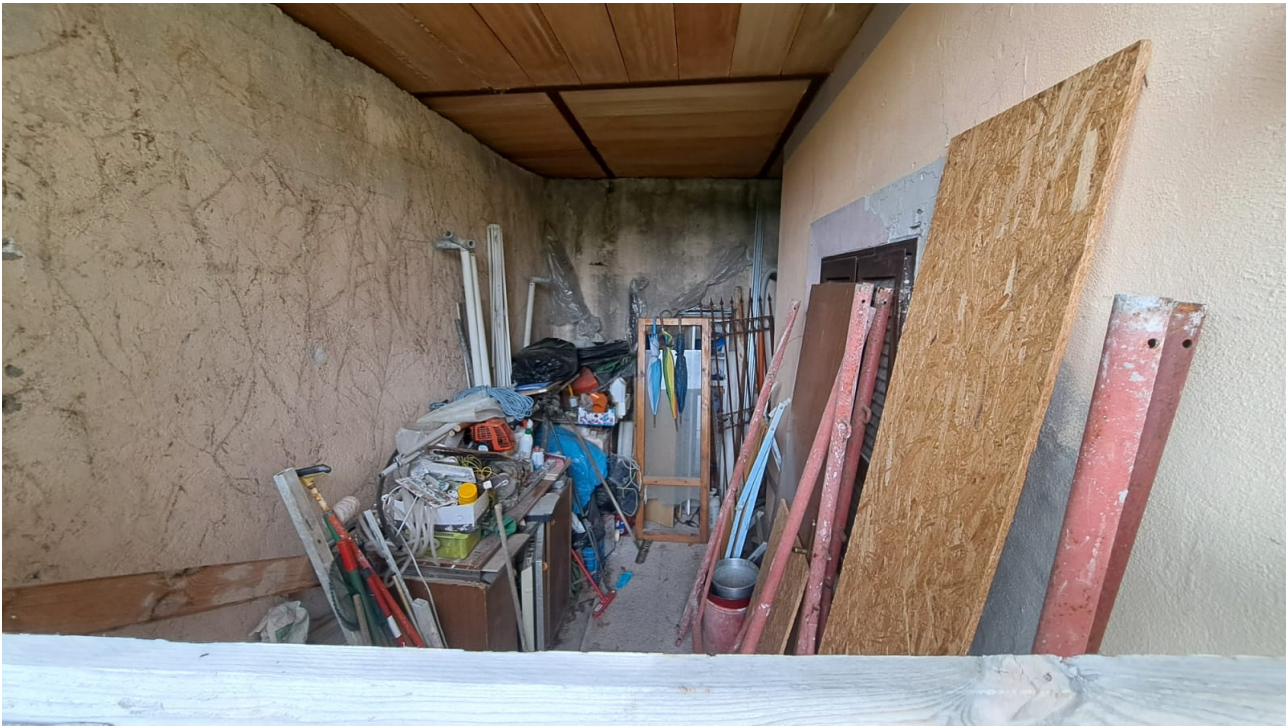
Vedute interne – porzione esterna