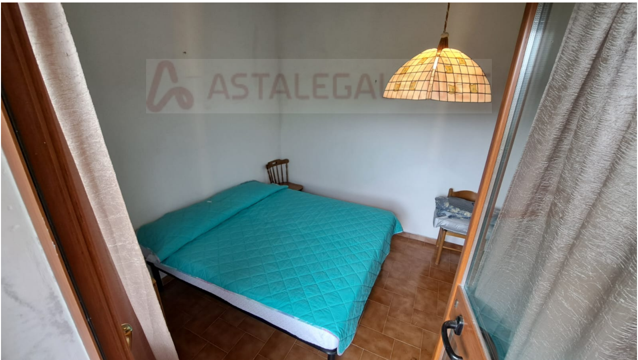
Vedute interne – camera - soggiorno