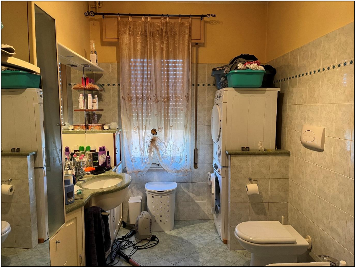
Foto n. 15 e 16 - Bagno