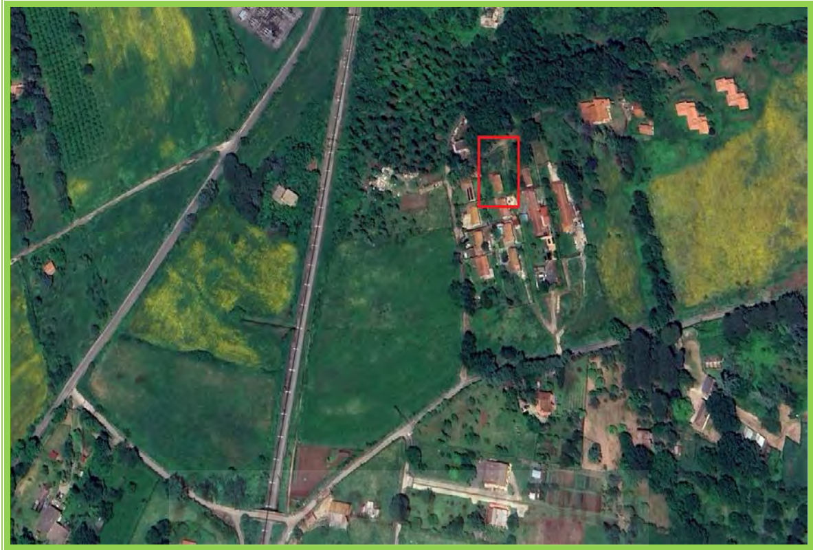
Inquadramento territoriale con area su cui è inserito il bene. Immagine aerea

In tale data, il sottoscritto CTU unitamente al Custode, non poteva accedere allo stesso perché il debitore esecutato non era presente sul posto, dal che si redigeva apposito verbale d'accesso redatto dal Custode nominato Dott. Andolfi Damiano.