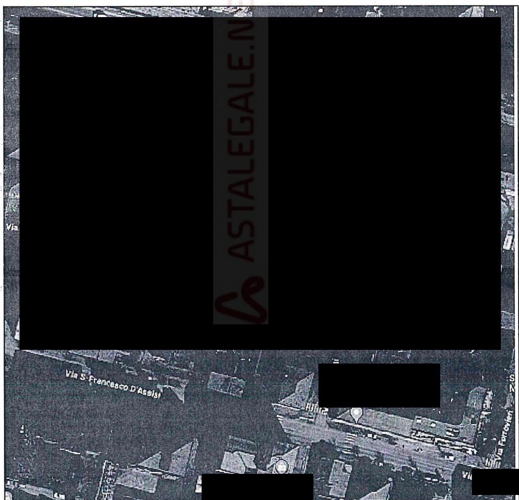
UNITA' IMMOBILIARI IN OGGETTO DI ESECUZIONE STRADA DEL MERLO n. 3 VOGHERA (PV)

I beni oggetto di stima sono costituiti da appartamento di civile abitazione posto al piano primo e una cantina al piano seminterrato. I beni si trovano all'interno di un Condominio denominato "FIORDALISO", nel Comune di Voghera (PV), Strada Del Merlo n. 3.