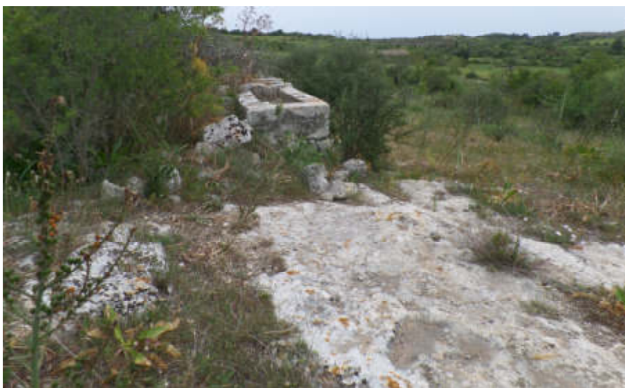
Foto n° 5.9. C.da Piana. Fg. 30, P.lla 107: Cisterna – Fabbricato diruto