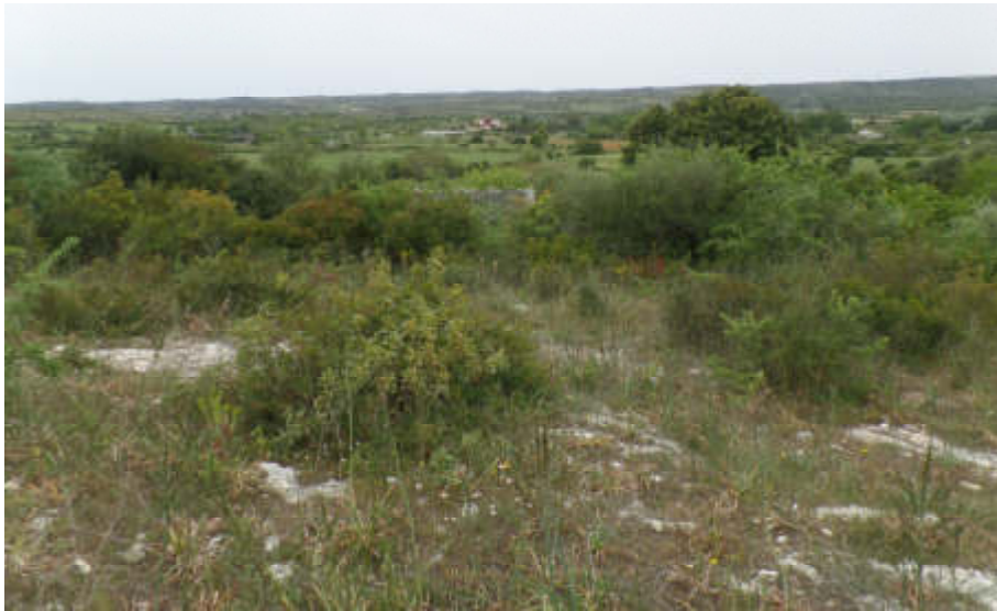
Foto n° 5.4. C.da Piana. Fg. 30, P.lla 104: Area fabbricato demolito