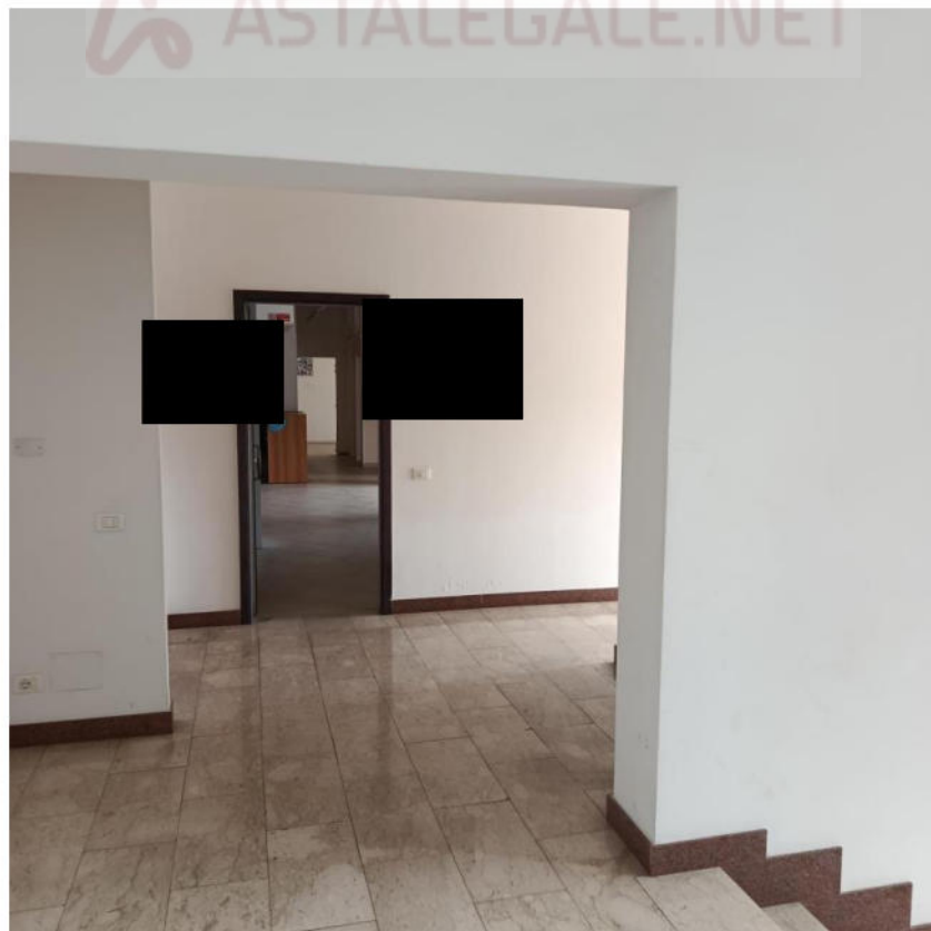
INGRESSO VISTO DA PIANEROTTOLO