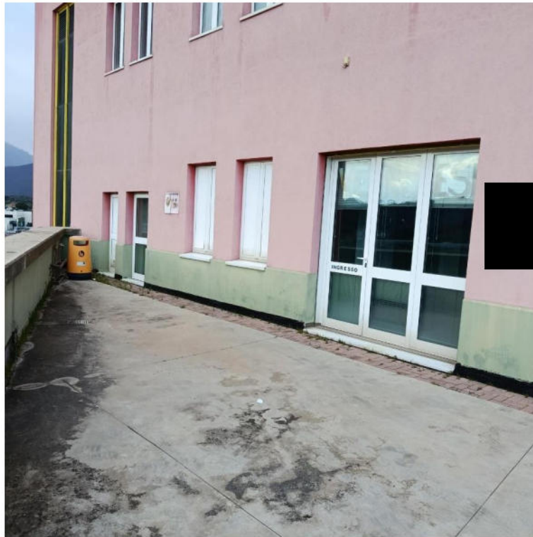
INGRESSO DA PIAZZALE CARRABILE