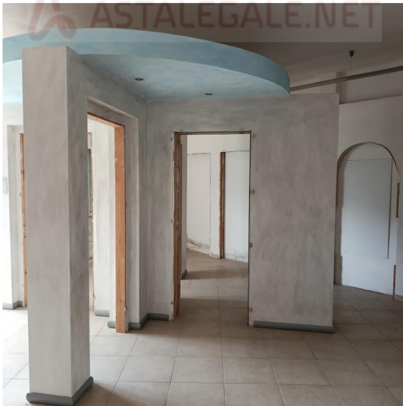
INTERNO UIU ESECUTATA