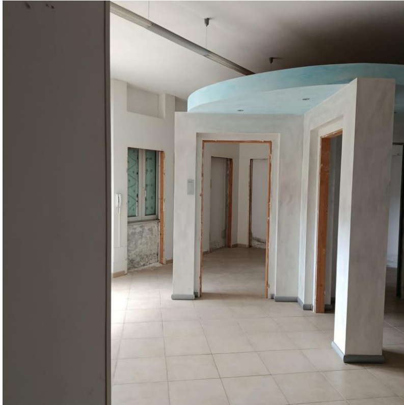
INTERNO UIU ESECUTATA