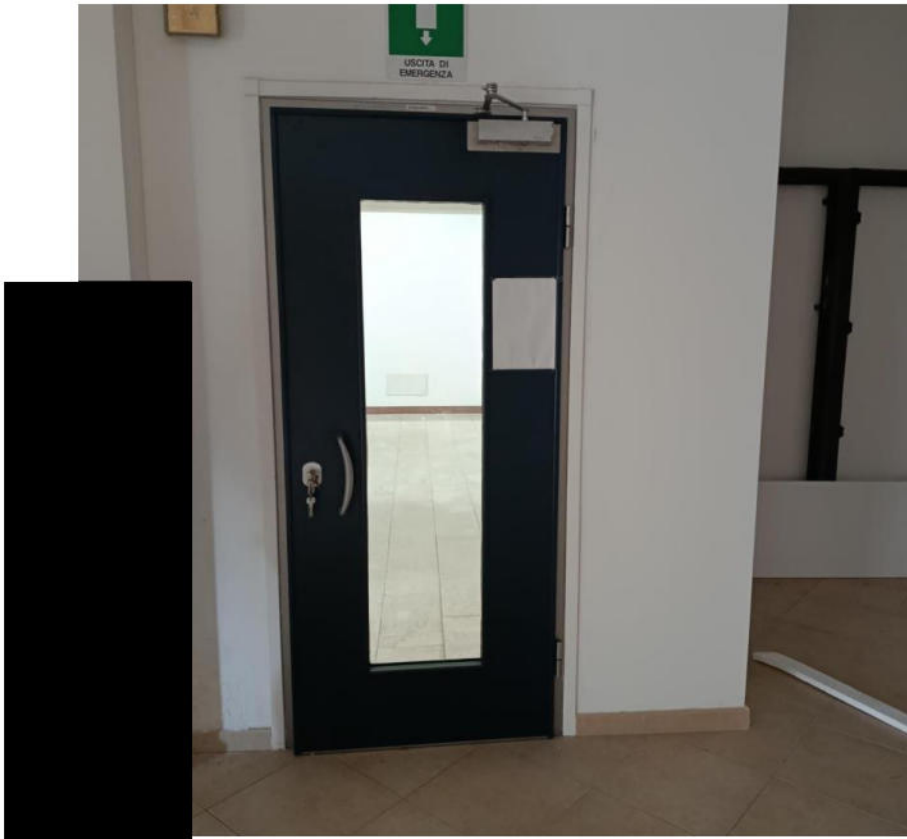
PORTA DI ACCESSO (SU SUB 37)