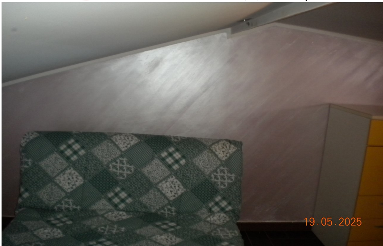
Vista interna accessorio con altezza utile variabile da mt. 1,80 a 1,50; al secondo piano sottotetto.

Nota CTU: alcune foto non riportano data perché effettuate con fotocamera Smartphone in pari data.