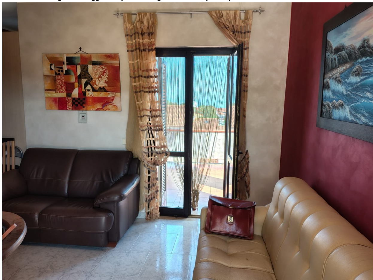
Vista interna ingresso soggiorno pranzo angolo cottura, piano primo