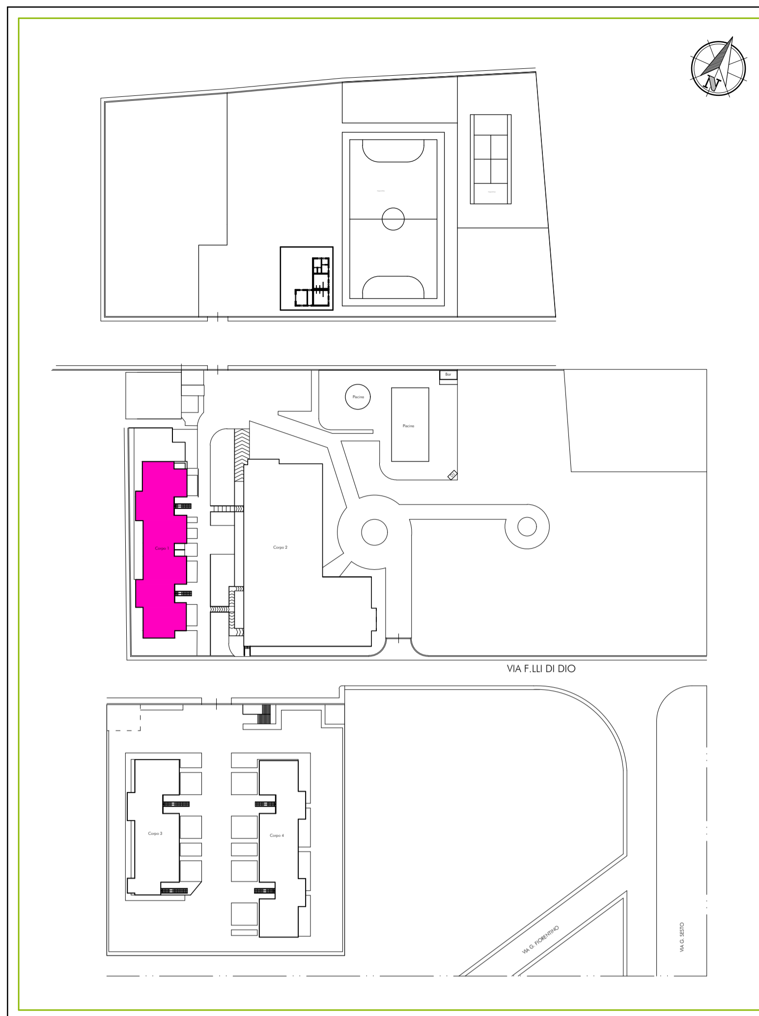
Planimetria generale - Scala 1:1000