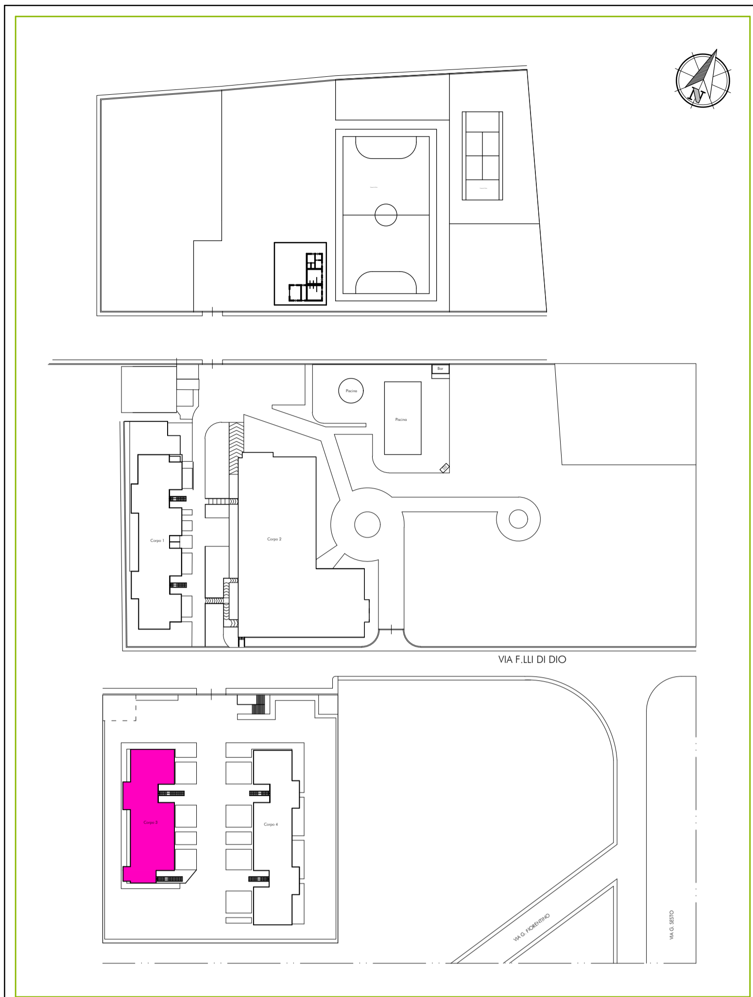
Pianta copertura - Stato di FATTO