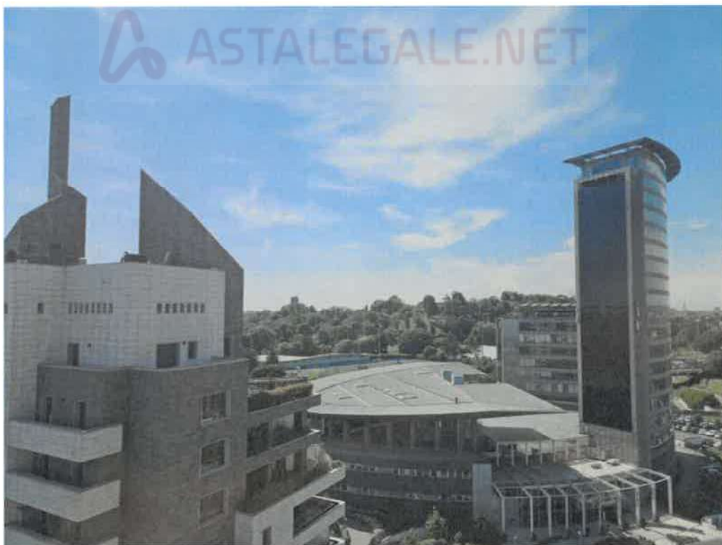
Vista verso l'esterno