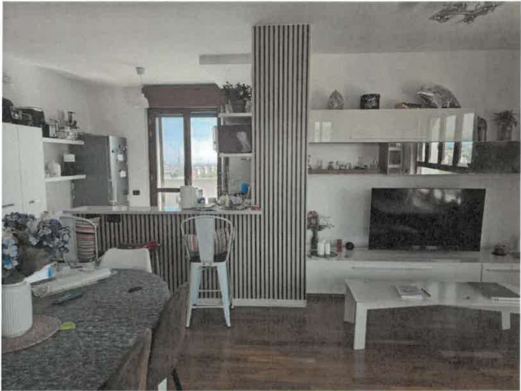
Vista verso la zona cucina