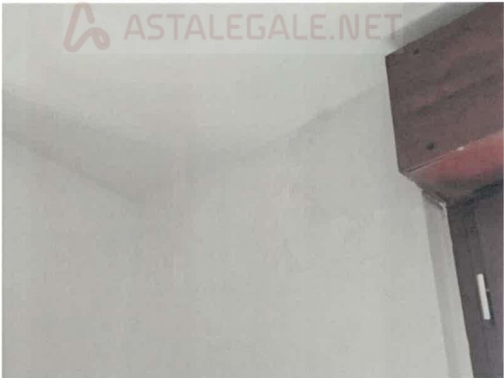
Dettaglio dell'infiltrazione riscontrata

Giudice: Dott. M.G. Ciocca | Custode: Avv. C. Bossi | Perito: Arch. G. Pranzo-Zaccaria 14/22