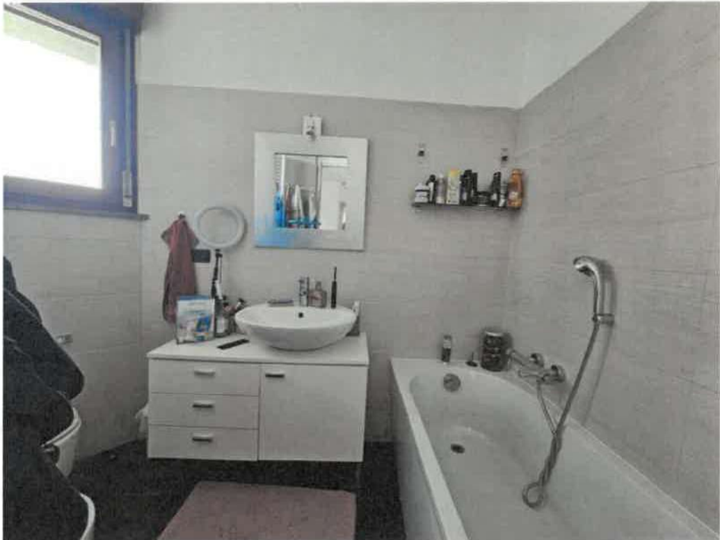
Bagno della matrimoniale