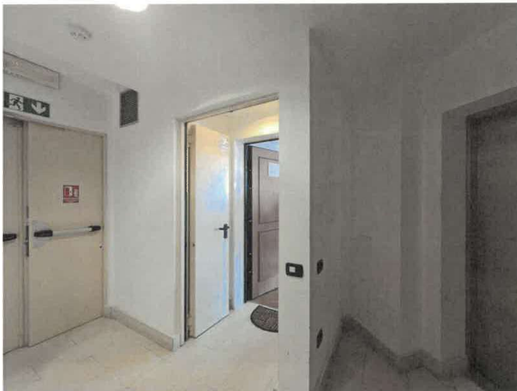
Vista dal pianerottolo