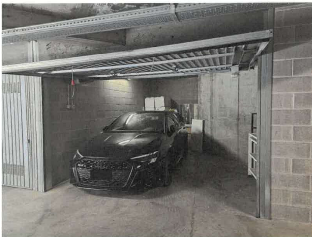
Vista dal corsello