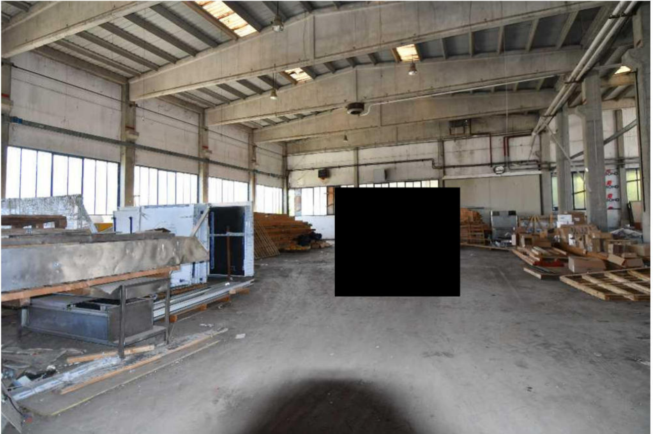
interno parte definita 396 B corpo principale in ferro