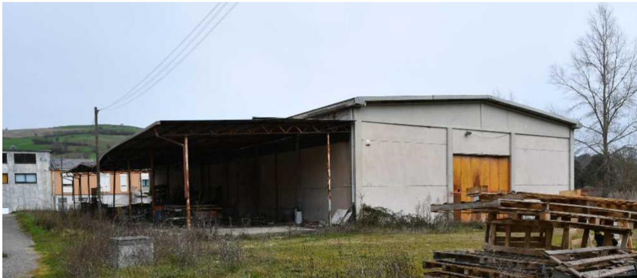
Foto del capannone scattata dal lato posteriore

Il lotto è composto da poco meno di 3 ettari di terreno, urbanisticamente la zona è classificata come rimboscimento .... con vincolo di inedificabilità, ed un capannone adibito alla produzione. Adiacente al corpo di fabbrica, sul lato anteriore, è realizzato un piccolo manufatto, probabilmente una centrale termica o un locale di rimessa. Su un lato è realizzata un'ampia tettoia in metallo.