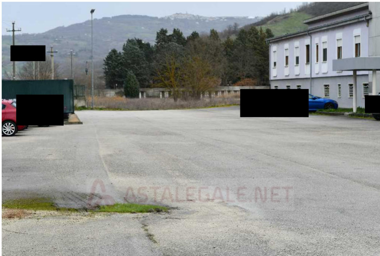
Foto piazzale ed uffici

Il lotto è composto da ampio piazzale, un fabbricato ad uso ufficio al piano primo e locali accessori al pianoterra- seminterrato ed un ampio capannone a forma di L, in effetti composto da due o più corpi di fabbrica, altro locale accessorio.